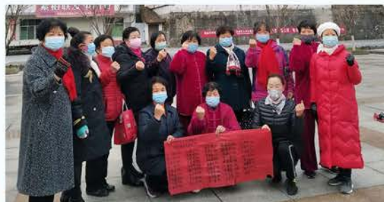
留坝县志愿队伍爱心捐款