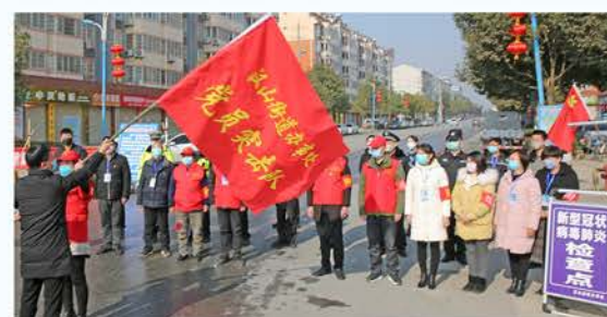
南郑区汉山街道办党员突击队