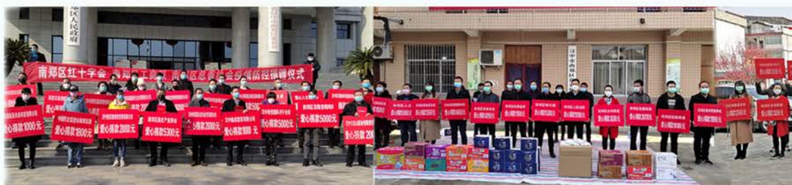
南郑区慈善协会、工商联、红十字会联合行动抗疫募集166.4万元