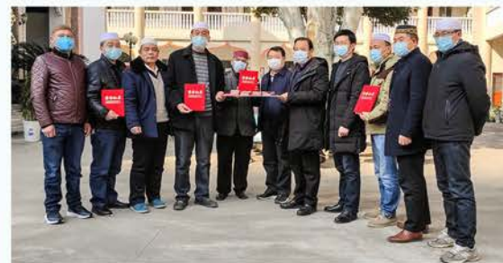
市、区伊斯兰教界为汉台区疫情防控捐款65200元