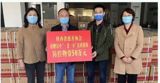
陕西省慈善协会捐赠汉中民政50万元防控物资