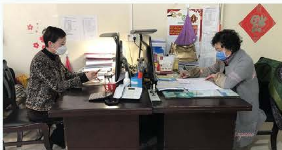
南郑区慈善协会工作人员