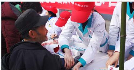
汉中高新医院慈善志愿者医疗服务