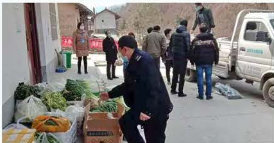
留坝县慈善志愿者给防控检查点送菜