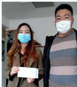
仙台坝镇588人捐款36466元