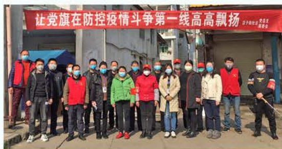
南郑区店子街社区志愿者