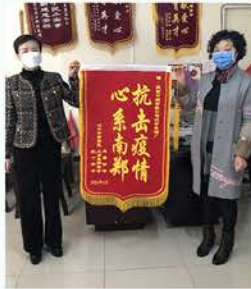
南郑慈协向爱心企业赠送锦旗