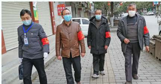
留坝县慈善志愿者防控巡逻