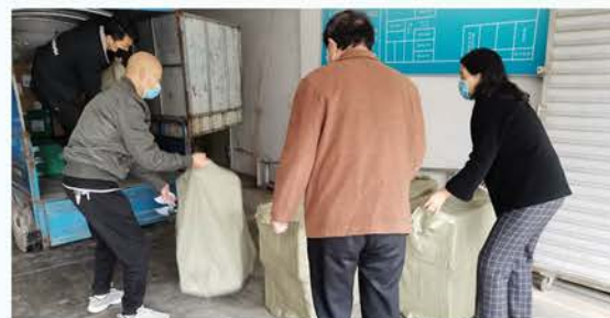
陕西省慈善联合会捐赠汉中1.2万个口罩