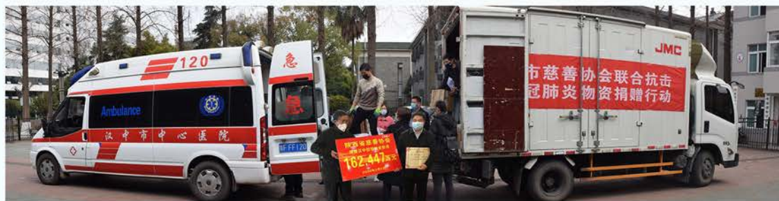
陕西省慈善协会捐赠汉中防控物资 162.447万元