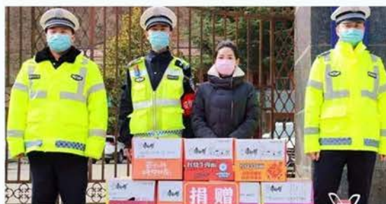
宁强县慈善志愿者慰问执勤民警