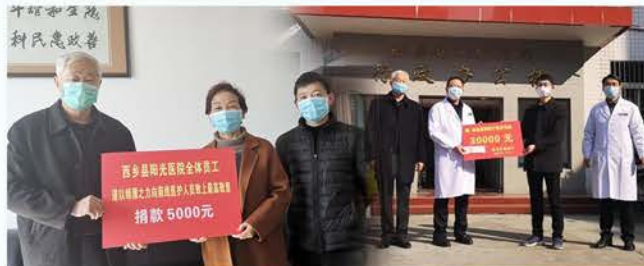
西乡县慈善协会抗疫募集39.8万元