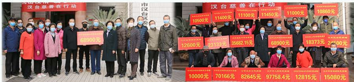
汉台区慈善协会配合政府、企业、机关、社区抗疫募集150.1万元