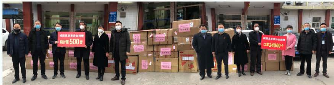
南通市经济开发区慈善协会捐赠城固防控物资 20.2万元