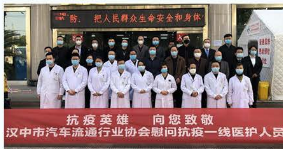
汉中市汽车流通行业协会向市第二人民医院爱心捐款慰问抗疫一线医护人员