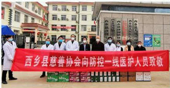
西乡县慈善协会慰问沙河镇防控一线医务人员