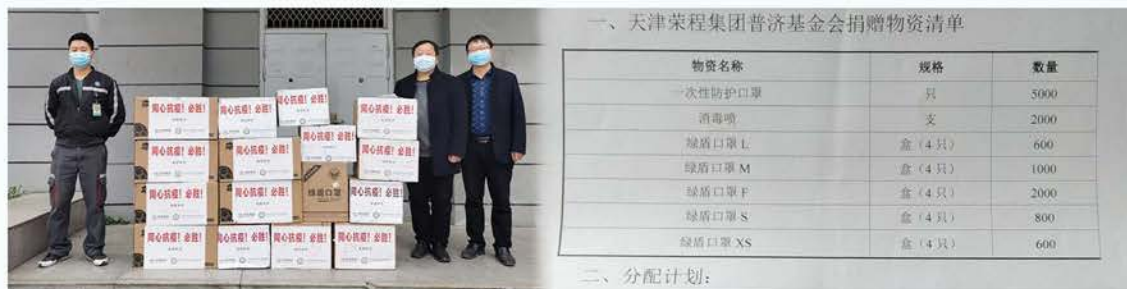
一、天津荣程集团普济基金会捐赠物资清单