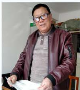
略阳长青树艺术团39人捐款 4100元