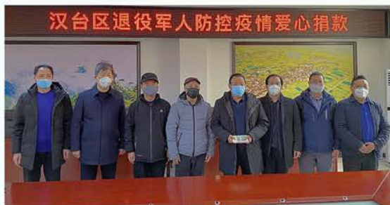
汉台区124名退役军人疫情防控捐款12350元