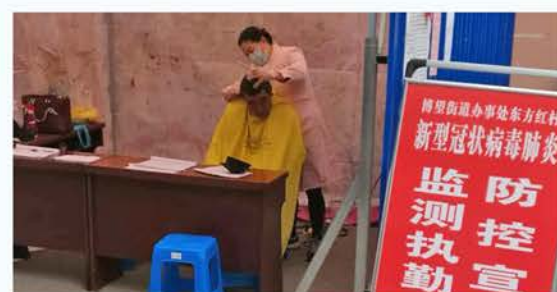
城固县慈善志愿者义务理发