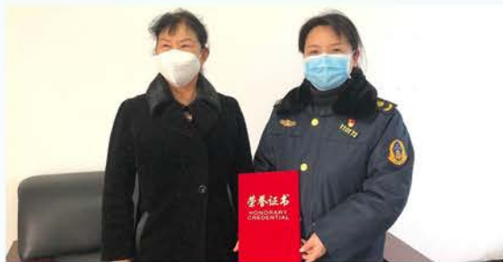
城固县道路运输管理所捐赠 6600元