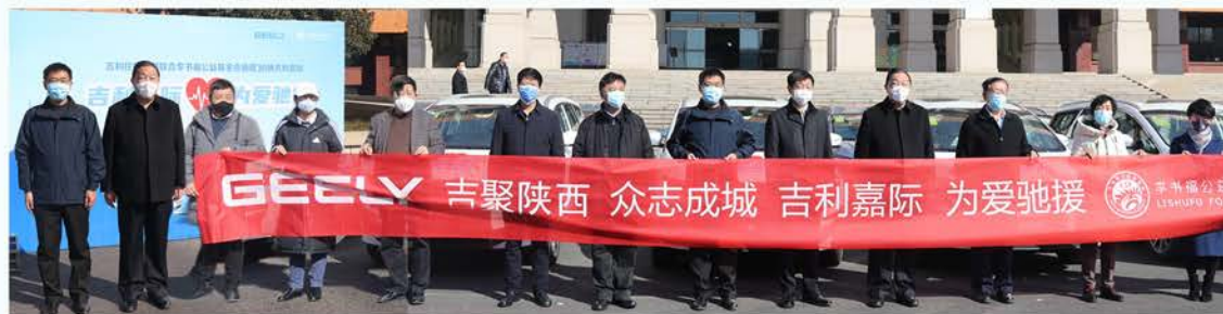
浙江省李书福公益基金会捐赠汉中抗疫用车二辆