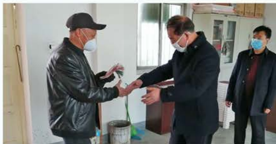
留坝县老科协爱心捐款 11250元