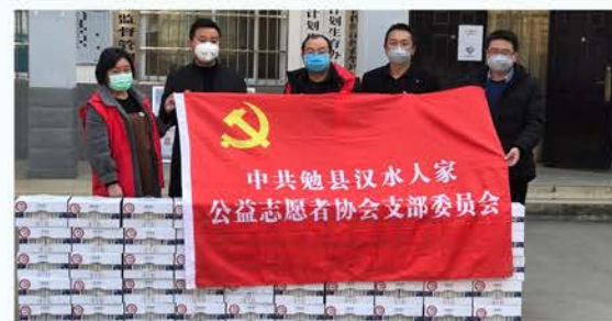
勉县公益志愿者协会捐赠物资