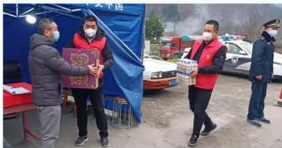
略阳县慈善志愿者慰问防控执勤点