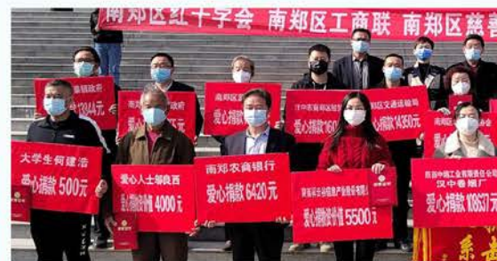
南郑区企业个人防控疫情爱心捐款