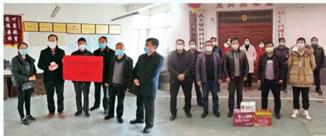
留坝县慈善协会抗疫募集65.6万元