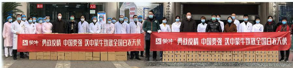
汉中市慈善协会抗疫募集96.4万元联合蒙牛集团慰问汉中抗疫一线医护人员