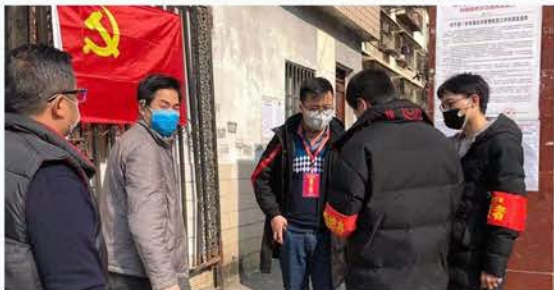
汉台区中山街办慈善志愿者防控执勤