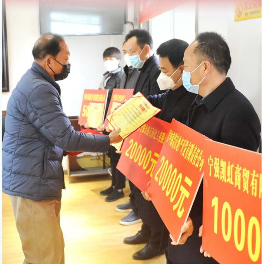
宁强县慈善协捐赠仪式