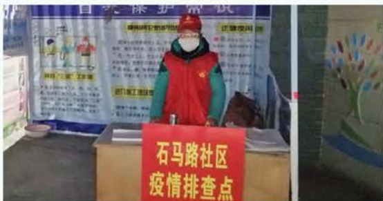
汉台区石马路社区慈善志愿者执勤