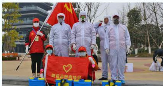
勉县志愿者协会防控消毒