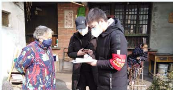
汉台区东关办慈善志愿者治安巡逻