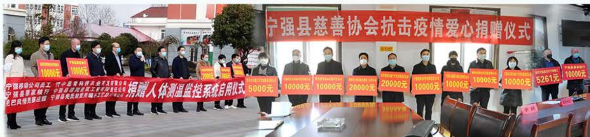
宁强县慈善协会发出动员倡议联合社会各界抗疫募集127.5万元