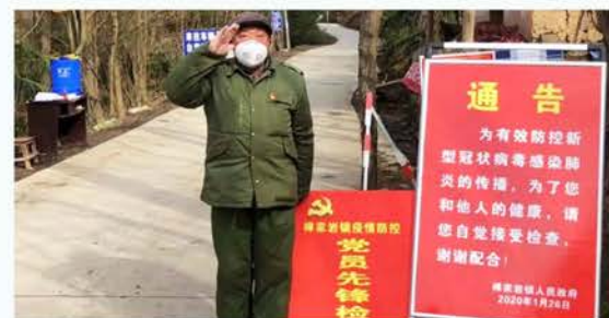
宁强县禅家岩镇志愿者防控检查点执勤