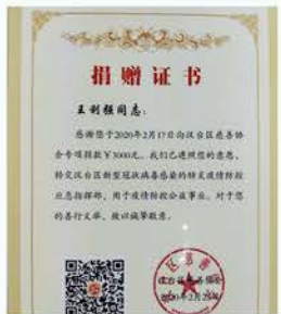
汉台区慈善协会向爱心人士颁发捐赠证书