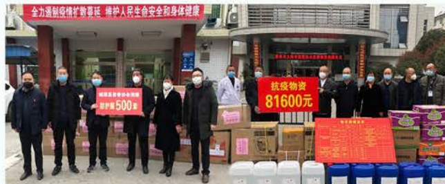
城固县慈善协会抗疫募集38.1万元