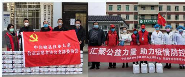
勉县慈善协会抗疫募集41.7万元