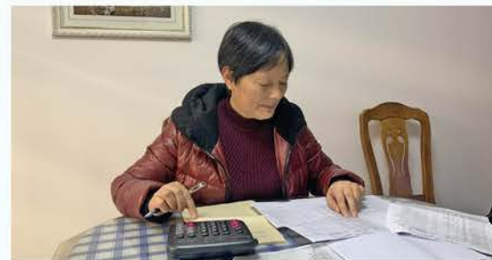
汉台区慈善协会工作人员