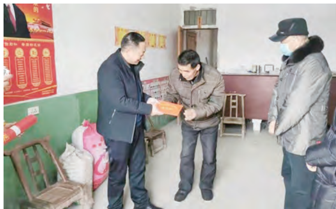
陈元安局长和童兆阳部长为困难退役军人送去慰问金

人书写新春对联，同省退役军人事务厅制作的2021年年画一起送达困难退役军人手中。