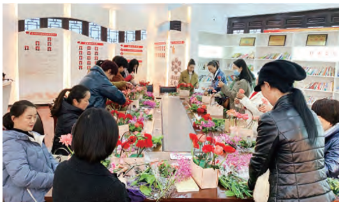
平利县南城社区慈善老年大学开展庆三八插花活动。