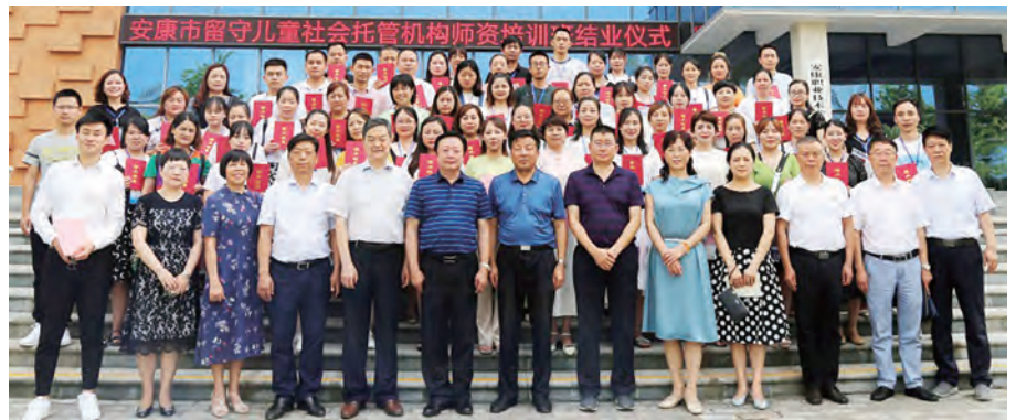
举办关爱留守儿童社会托管机构师资培训班并组织慈善分会开展结对帮扶

十二、市县区慈善协会获得多项荣誉。崔光华会长获中华慈善总会“全国基层慈善先进工作者”奖。在去年陕西省文明办、陕西省慈善协会“三秦善星”评选中，我市有11个集体（个人）获奖。其中市慈善协会、平利县慈善协会、旬阳县慈善协会会长贾中军、石泉县慈善协会会长胡吉应等榜上有名。在2019年度全省志愿服务表彰名单上，我市获9个奖项。在全省慈善项目先进集体表彰决定中，市慈善协会、旬阳县慈善协会、石泉县慈善协会受奖。旬阳县慈善协会、平利县慈善协会会长陈世斌获市委、市政府授予的“脱贫攻坚突出贡献奖”。