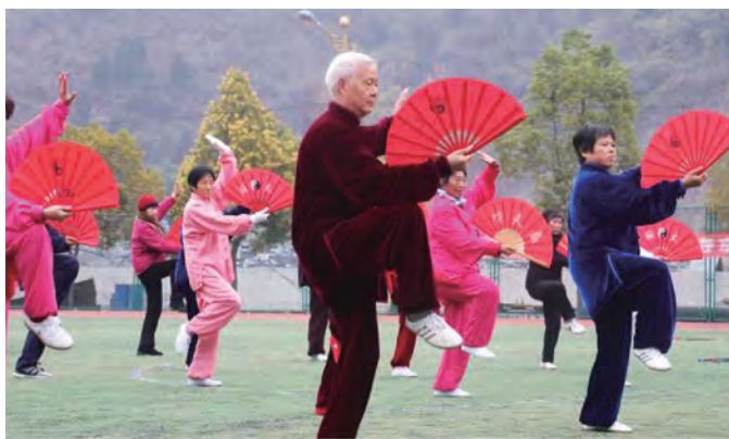
旬阳县老城社区慈善老年大学体育班的学员正在练习太极扇。