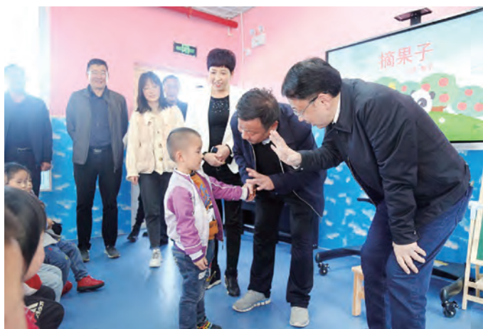
殷勇副市长（右一）和崔光华会长（右二）看望财梁九年制学校幼儿园的小朋友

2020年11月12日，市委常委、副市长殷勇，市慈善协会会长崔光华、监事会主席杜保华，建设银行安康分行副行长陈昕荣一行来到汉滨区县河镇财梁社区，就中国建设银行股份有限公司捐资实施的慈善扶贫项目进行考察。汉滨区委常委、组织部部长郭正锋，县河镇党委书记廖道琴陪同。