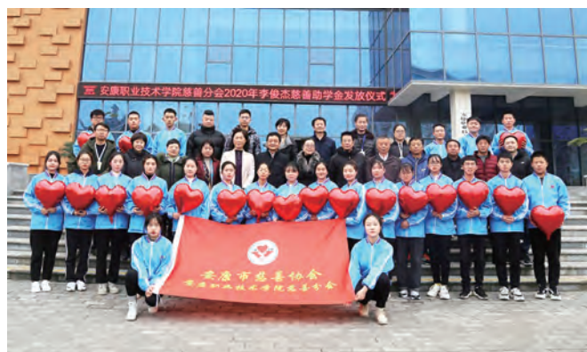
与会领导和受助学生合影