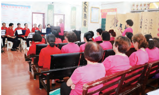
岚皋县号房湾社区慈善老年大学音乐班正在上课。