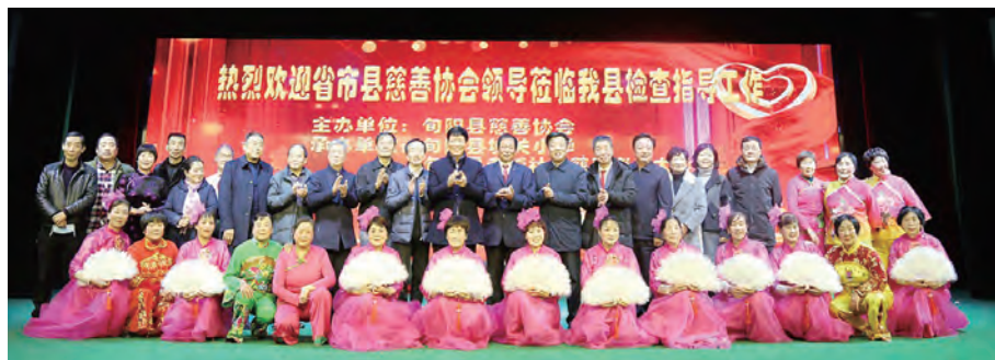
与会人员观看了老城社区慈善老年大学学员表演的文艺节目