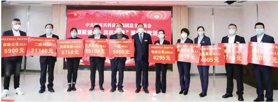
陕西兴科房建集团发动职工捐款支持疫情防控

2020年，安康市各级慈善组织凝神聚力，积极参与抗击新冠肺炎的阻击战，积极参与扶贫攻坚收官之战，在慈善资金募集、慈善项目实施、慈善队伍建设等方面，开拓进取、巩固提高、积极作为，取得了丰硕的成果，实现了新的突破。