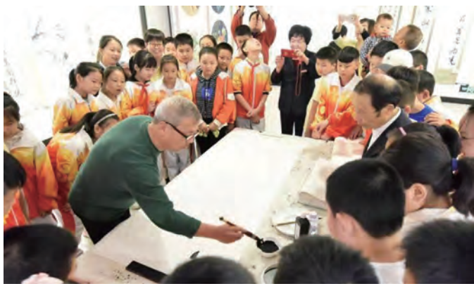
石泉县北街社区慈善老年大学举办书画展。