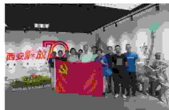
西安市慈善会党支部组织党员和工作人员 开展“不忘初心、牢记使命”多做贡献活动