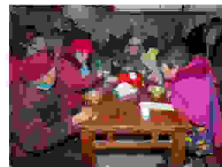
老人们吃着热腾腾的饺子欢度元宵节