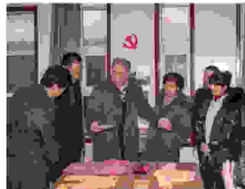
市、区慈善会领导调查了解羊城西源社区慈善老年大学编织班的教学情况