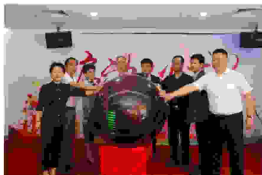
西安市慈善会、华夏眼科医院领导共同启动“善行陕西·圆梦摘镜”慈善活动

这次圆梦摘镜慈善扶贫活动，是西安市慈善会联手西安华夏眼科医院开展的一项公益援助活动，是西安华夏眼科医院为了贯彻落实国家关于我国青少年视力防控工作的指示精神，开展的一项慈善扶贫活动。此项活动将对10名家庭困难的青少年学生免费做近视手术，对320名资助对象进行部分费用援助。让这些有梦青年得以圆梦，早日报效国家，为社会做出应有的贡献。