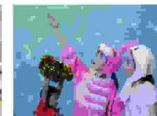
活动仪式上，孩子们 表演了精彩的文艺节目