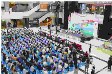
庆祖国华诞·圆梦“六一”公益慈善活动在大明宫钻石店启幕

爱心传递、使命召唤；怀揣初心、圆梦六一。5月30日上午，由西安市慈善会、大明宫实业集团联合主办的“童”庆祖国华诞·圆梦六一第六季慈善公益活动在大明宫钻石店举行。市慈善会会长、副会长，各区县慈善会领导，西安大明宫实业集团员工、慈善志愿者、受助儿童代表以及媒体记者200多人参加了活动。