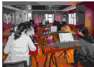
沣东新城羊城西源社区慈善老年大学古琴班的学员正在上课