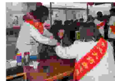
开心大药房的慈善志愿者来到敬老院为老人们热情服务