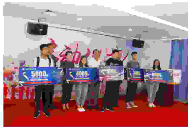
市慈善会领导为受助学生发放摘镜资助善款