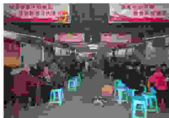
元宵节，十里八村百位老人来到免费敬老院吃饺子、品汤圆、自演自唱闹元宵