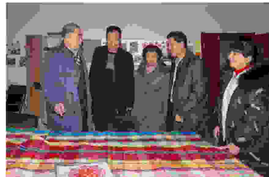
市、区慈善会领导检查了解沣东新城灞源社区慈善老年大学织布班的教学情况