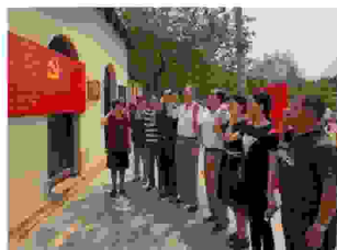
9名党员庄严宣誓重温入党誓词，决心 认真履行党员义务，为党的事业奋斗终身

烈士陵园进行“不忘初心、缅怀先烈、激发热情、多做贡献”教育活动，并参观了西安解放70年图片展。大家一致表示，要在习近平新时代中国特色社会主义思想引领下，继承和发扬革命光荣传统，以革命烈士的大无畏精神，联系实际干好本质工作，为实现中国梦多做贡献。