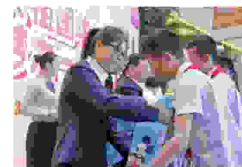
有关领导为困难家庭儿 童发放“六一”心愿礼物