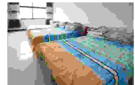
敬老院为老人们准备的休息房间