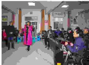
灞桥区席王街道汽配社区慈善老年大学戏剧班的学员正在学习秦腔演唱