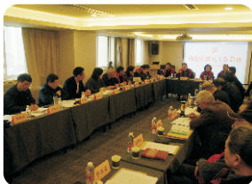
西安市慈善会召开工作会议