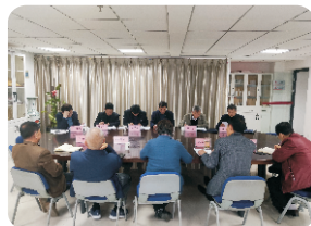
西安市慈善会与魏都慈善总会召开座谈会