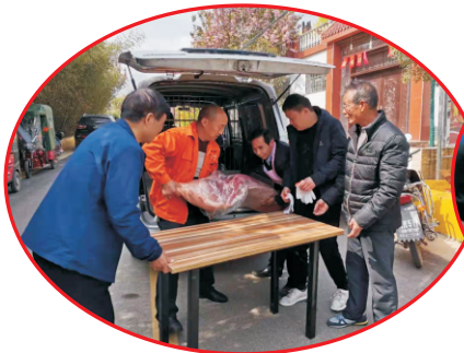
周至县慈善会公益捐赠活动