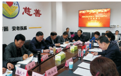
陕西省慈善协会与西安市慈善会座谈