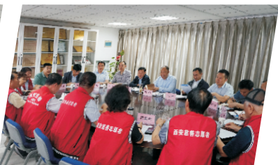
市慈善会与市民政局座谈