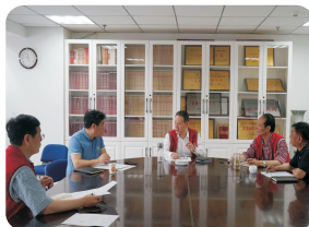
市慈与西北大学慈善研究院座谈