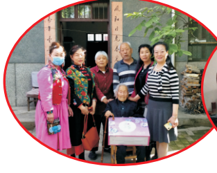
蓝田县慈善会与百岁老人同度五一