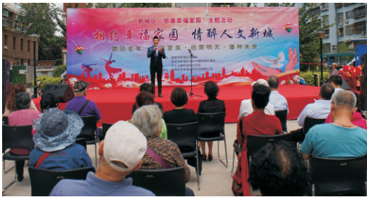
新城区慈善会慈善幸福家园活动

据悉，莲湖区慈善协会、雁塔区慈善会、灞桥区慈善会、长安区慈善会、周至县慈善会也在如火如荼开展慈善幸福家园项目。