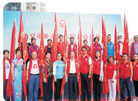
志愿者直属队授旗仪式