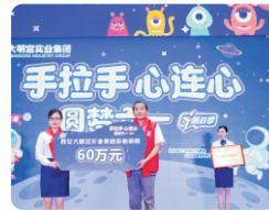
西安大明宫实业集团向西安市慈善会捐赠60万元

2021年是中国共产党建党100周年，为了庆祝党的生日，也为了践行大明宫实业集团“企业发展·党建领航”的发展理念，在物质帮扶的基础上，本次活动还将携手陕西省妇女儿童发展基金会，西安市雁塔区慈善会分别开展“少年儿童心向党”困境儿童延安行红色教育活动，“山里孩子看古都”研学活动，从精神层面积极引导孩子们，在提高孩子们眼界，传递正能量的同时，为建党100周年献礼。