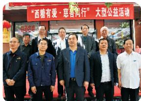
西安市首家慈善企业授牌