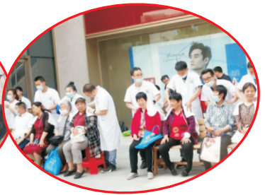
莲湖区慈善协会慈善幸福家园活动