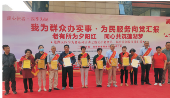
莲湖区慈善协会慈善幸福家园活动