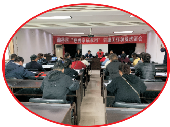
灞桥区慈善会召开慈善幸福家园动员培训会