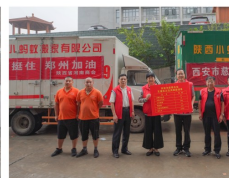
市慈善会驰援河南50万元抗洪物资送达仪式