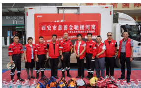
市慈善会救援队驰援河南