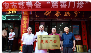
市慈善会授牌慈善门诊