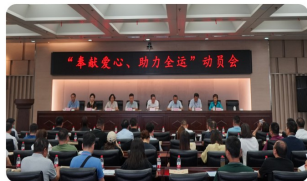
“奉献爱心、助力全运”动员会