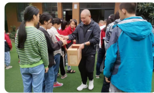
周至县慈善会开展公益捐赠活动