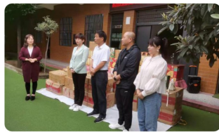
周至县慈善会开展公益捐赠活动