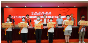
为学生发放助学金