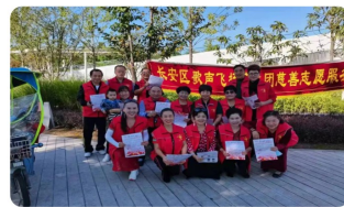
长安区慈善会开展99公益日众筹活动