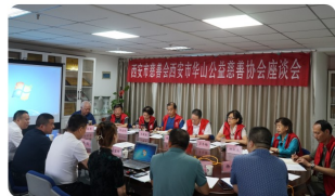
西安市慈善会与西安华山公益慈善协会座谈