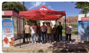
长安区慈善会开展99公益日众筹活动