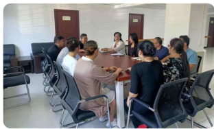
临潼区慈善会召开慈善老年大学座谈会