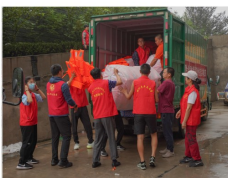
市慈善会驰援河南抗洪的第一批物资送达仪式