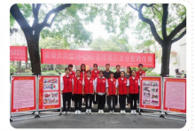
高陵区慈善会开展公益宣传活动