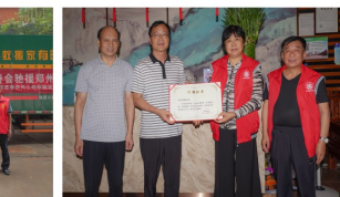
郑州市慈善总会为西安市慈善会颁发捐赠证书

连日来，河南洪灾牵动人心，西安市慈善会快速反应，第一时间做出援助河南刻不容缓的决定，当即安排部署驰援河南抢险救灾工作。