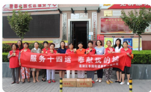
莲湖区慈善协会开展中秋慰问活动