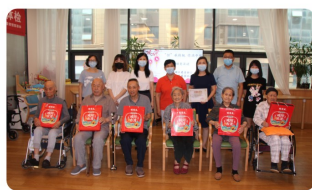
莲湖区慈善协会开展中秋慰问活动