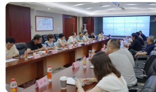
西安市慈善会与陕西省慈善联合会座谈