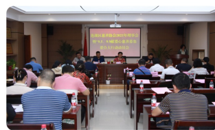
莲湖区慈善协会召开理事会