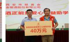
金徽酒向市慈善会捐赠40万元助学金