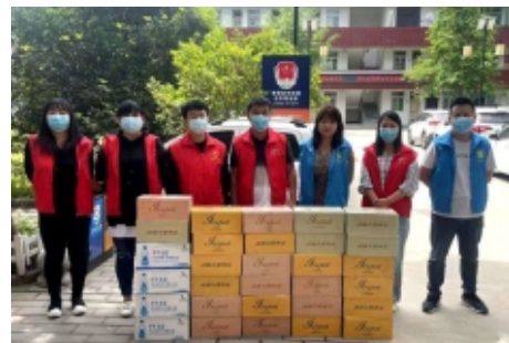
鄠邑区慈善会开展“盛夏助力抗疫送爽”活动