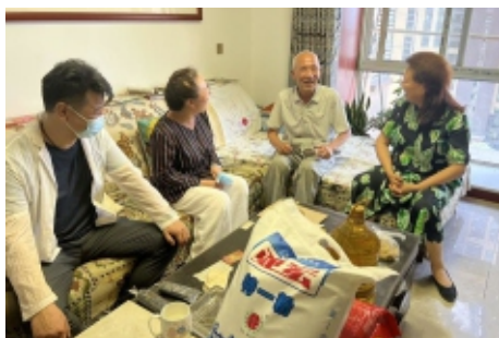
未央区慈善协会看望辖区困难群众