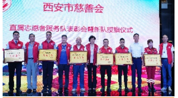
为受表彰的志愿者服务队及个人颁发铜牌、证书

他要求，各直属志愿者服务队：一要统一思想，提高政治站位。要时刻与党中央保持一致，把讲政治放在第一位，严格遵守法律法规和各项政策。二要抓好队伍建设，规范队伍管理。要加强志愿者培训及素质提升，按照现代慈善管理要求，健全内部管理制度。三要坚持工作创新，推动慈善发展。要不断更新观念、开拓思路，为慈善工作做出新的贡献。四要因人制宜，精准服务。要根据不同弱势群体特点和需求，开展有针对性的服务活动。