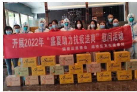
灞桥区慈善会开展“盛夏助力抗疫送爽”慰问活动