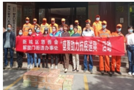
新城区慈善会开展“盛夏助力抗疫送爽”活动