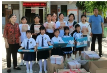
碑林区慈善会为蓝田老区留守儿童送去“六一”礼物