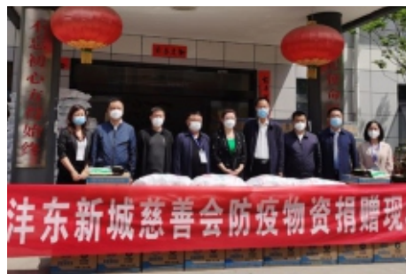
沣东新城慈善会为封控区群众送生活物资