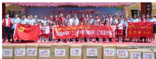
“六一”看望校园留守儿童