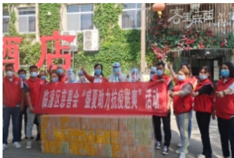
临潼区慈善会开展“盛夏助力抗疫送爽”活动