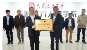
为西安工商学院授牌