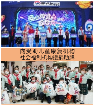
向受助儿童康复机构 社会福利机构授牌