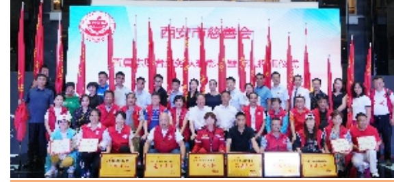
西安市慈善会召开直属志愿者服务队表彰会暨新队授旗仪式合影

和社会治理制度，开辟了慈善事业的新时代。我们的直属志愿者服务队开展的慈善活动不仅是简单的公益活动和利他行为，更是响应党中央号召，践行为人民服务的宗旨。