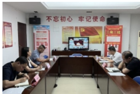
高陵区慈善会学习“乡村振兴陕西专场”会议精神