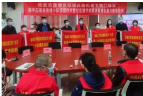
莲湖区慈善协会为社区楼宇志愿者救援队授旗