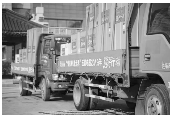
暖心的新年大礼整装待发

收到爱心家电的困难群众脸上露出笑容，他们感谢区慈善协会和五星电器送来暖心的新年大礼。