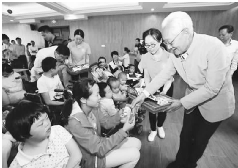
“大手拉小手”助孤项目慰问市儿童福利院孤儿

通人的改变。2018年，总会继续拓展互联网慈善运作模式，网络募捐 170 多万元，参与人数 1.55 万人次。其中，为南京地铁患重病职工开展的专项募捐产生较大社会反响，24 小时内募捐额达到 27.2 万元。