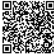
5、演讲 航天人讲航天梦