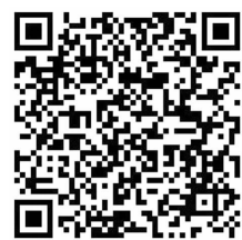
4、新闻 《慈善助孤 21 载》