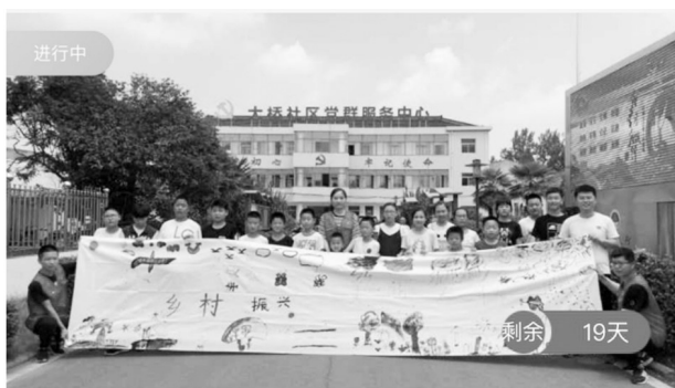
伴宁成长, 约绘未来

南京市浦口区永宁街道大桥社区互助基金刚刚认领, 用于帮困、扶贫、助学、环境改造、文