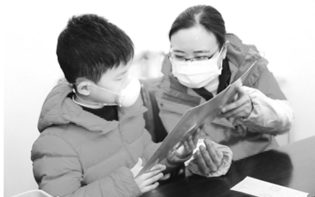
小学生捐赠压岁钱。