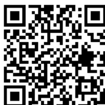
5、纪录片 当你老了第1集《家有一老》