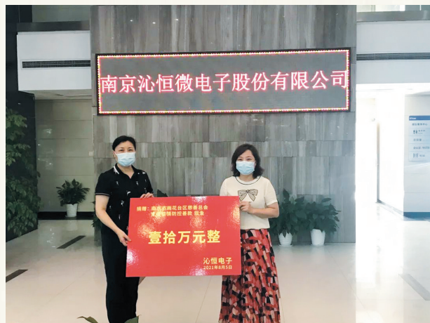
江苏沁恒股份有限公司捐款