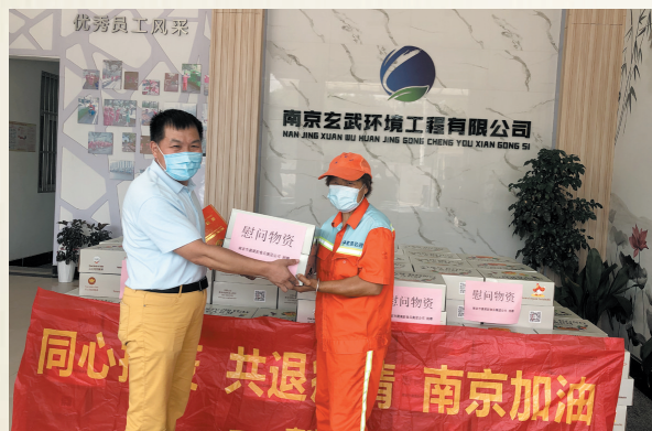
南京市蔬菜副食品集团有限公司捐赠慰问环卫工人 (更多报道详见“抗疫纪实”专栏，排名不分先后)