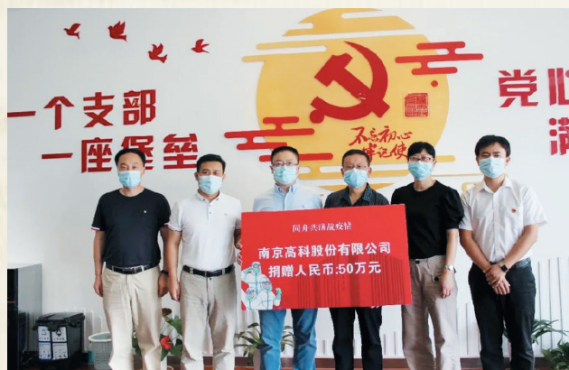
南京高科股份有限公司捐赠