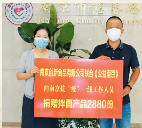
创新食品有限公司