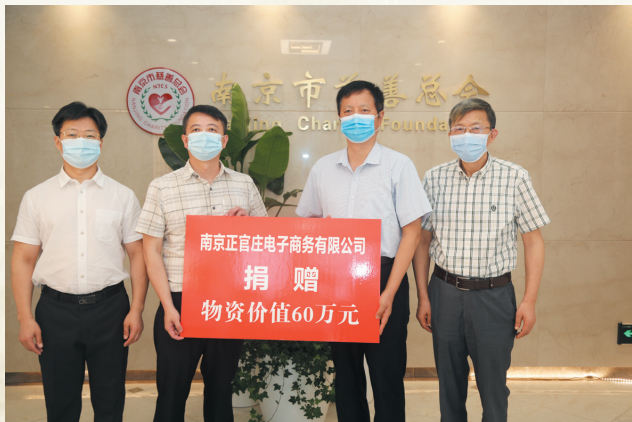
南京正官庄电子商务有限公司捐赠