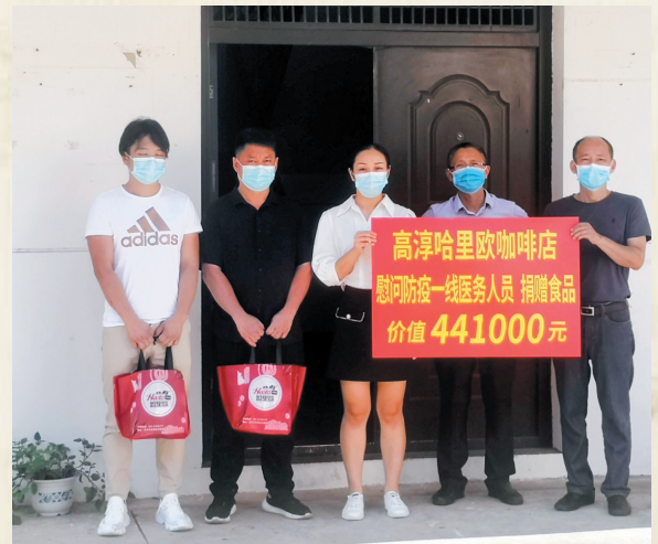
高淳哈里欧咖啡店捐赠