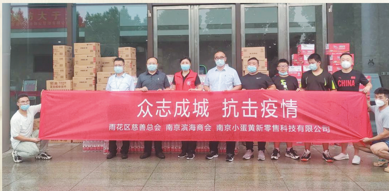
南京滨海商会、南京小蛋黄新零售科技有限公司捐赠