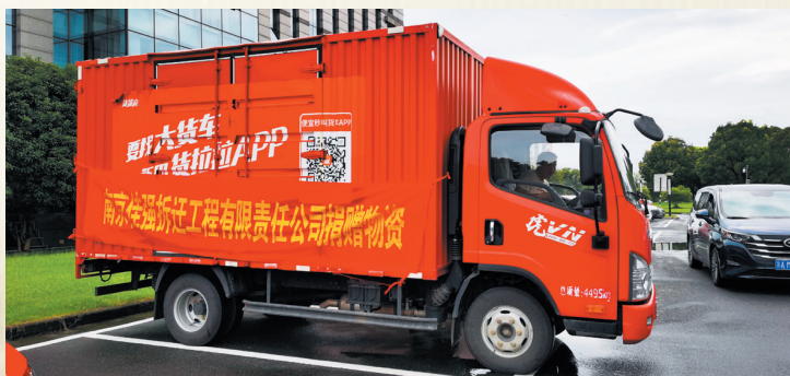
南京佳强拆迁工程有限责任公司捐赠