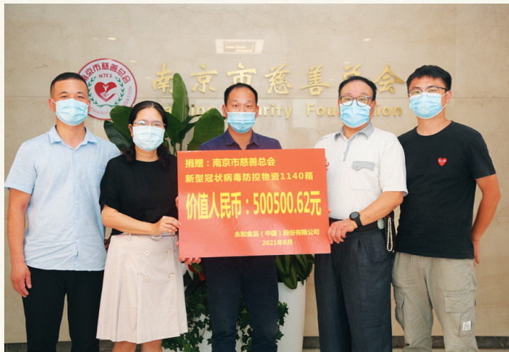
永和食品股份有限公司捐赠