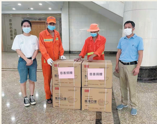
秦淮区慈善总会向环卫工人赠送口罩