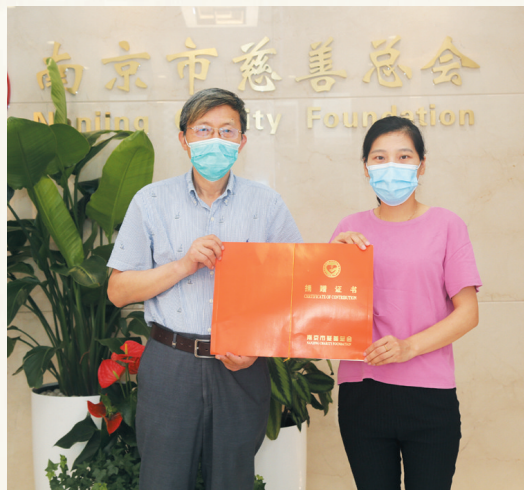
南京恒佳医疗有限公司捐赠