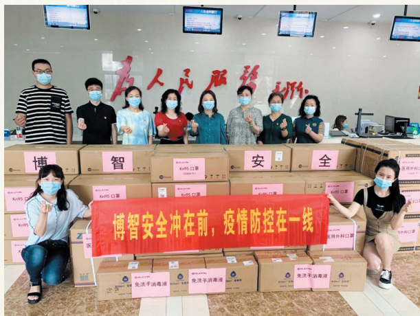
博智安全科技股份有限公司捐赠