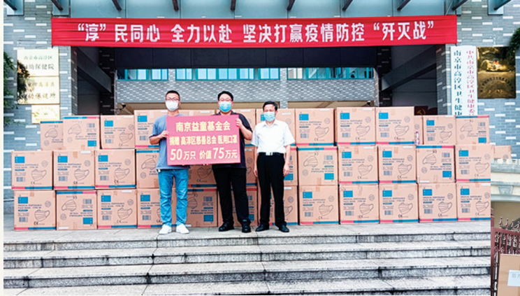
“益童”基金会 一日两援淳