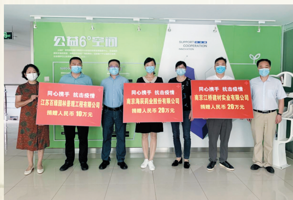
南京海辰药业股份有限公司、南京江桥建材实业有限公司、江苏百绿园林集团有限公司捐赠