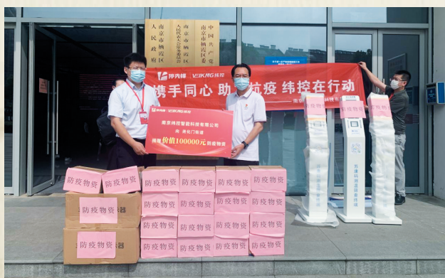
南京纬控智能科技有限公司捐赠