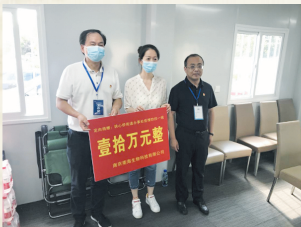
南京南海生物科技有限公司捐赠