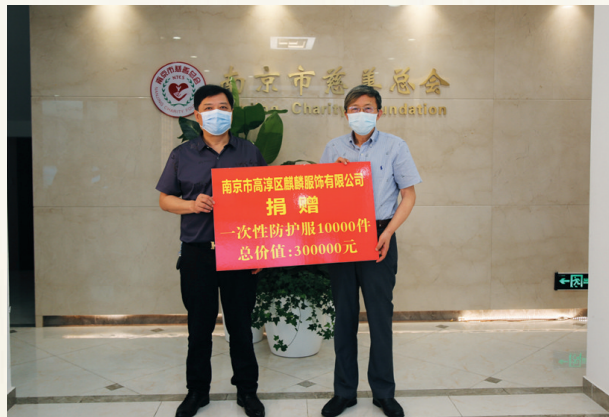
高淳麒麟服饰捐赠