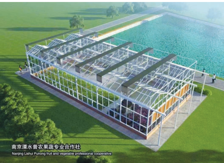
南京溧水普农果蔬专业合作社 Nanjing Lishui Punong fruit and vegetable professional cooperative