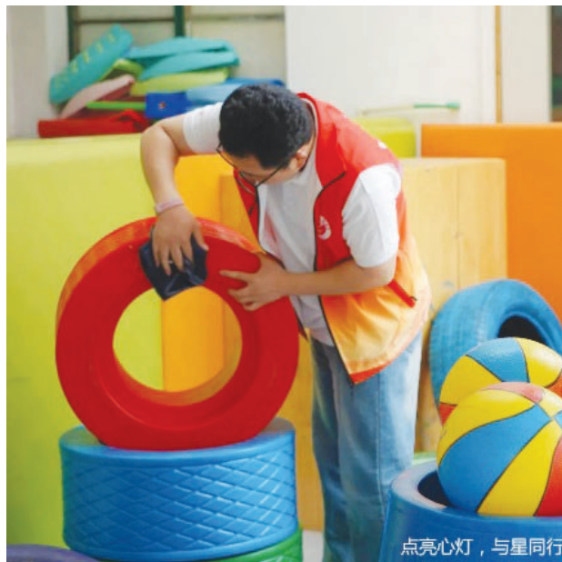
点亮心灯，与星同行

劳动过后，在阵阵音乐声下，星宝们在家长的带领下，逐渐开始跟着志愿者们动起来、跳起来，他们开始手拉着手转圈圈，一起坐在地上拍手唱歌，一起玩老鹰捉小鸡，原本夹杂着哭闹声的教室充满了欢声笑语，有星宝们的，也有志愿者们的。