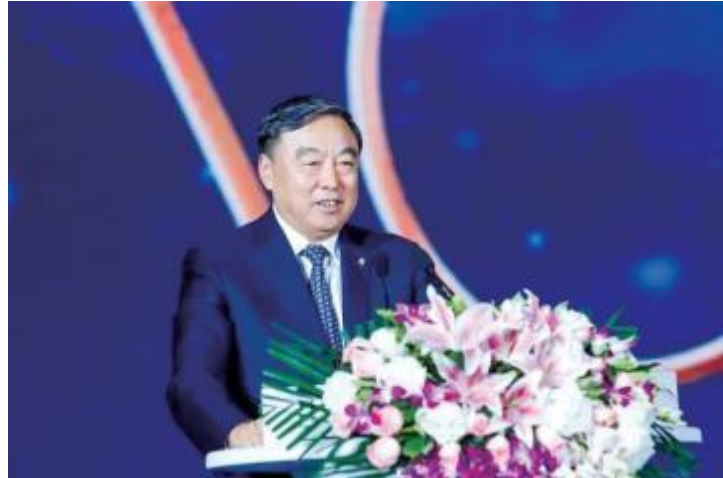
马蔚华 深圳国际公益学院董事会主席、招商银行原行长