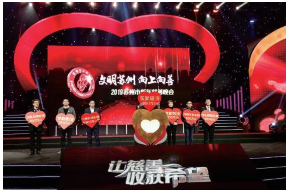
活动现场举行了捐赠活动，全市14家爱心企业举牌捐赠善款达3260万元。