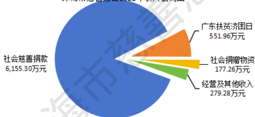
珠海市慈善总会2022年收入概况图

受新冠肺炎疫情和国内外复杂形势影响，2022 年，珠海市慈善总会累计收入 7163.80 万元，同比下降 68%。其中，社会慈善捐款 6155.30 万元；广东扶贫济困日捐赠 551.96 万元；物资评估作价 177.26 万元；经营及其他收入 279.28 万元。全年累计接收物资 52713 件，发放物资 52713 件。