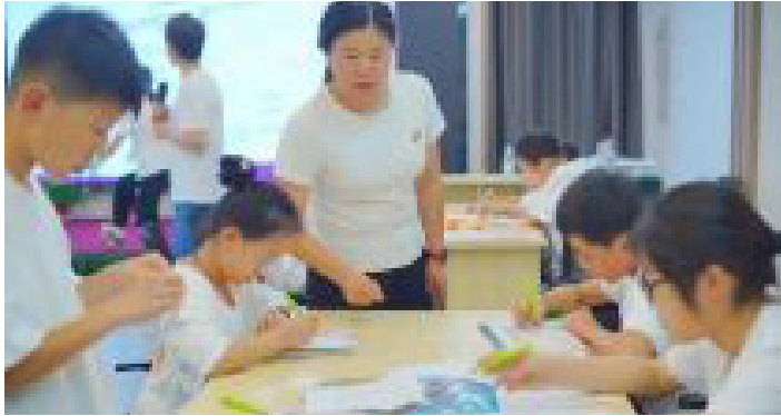
星空露营烧烤·派对

《青春无悔》这个课程帮助孩子考虑自己的未来，更清楚的认识自己，学会为自己做出健康正确的决定。