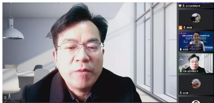
武汉科技大学副校长吕勇致辞

法学与经济学院以及湖北非营利组织研究中心，为发展社会工作专业建设与公益慈善方向研究形成的相关成果。希望通过会议精彩的思想碰撞，彼此启迪，加深联结，探究公益慈善事业的发展趋势与走向，为社会工作学科建设贡献一份力量。