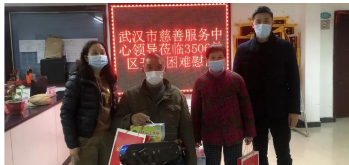
市慈善总会慰问 3506 社区困难群众

郑辉精准慈善组织社会定位，树立“‘慈’续幸福、与‘善’同行”党建品牌，创新慈善救助工作思路和“雪中送炭”方式方法，促进党建工作富有生机、充满活力，增强支部凝聚力、号召力和创造力，团结带领党员群众抓好重点、破解难点、打造亮点，努力成为组织信赖、群众拥护的典范。