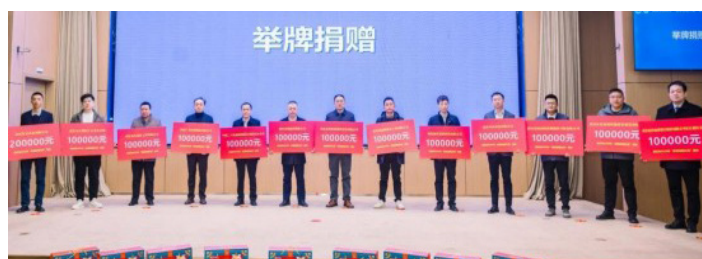
2026年武汉慈善情暖江城活动

2.“国信善·华源证券乡村振兴系列慈善信托”由华源证券股份有限公司委托、武汉市慈善总会作为双受托方之一实施,精准聚焦乡村发展需求,量身定制帮扶方案,展示了金融力量在乡村振兴中的独特价值,获评“优秀慈善信托”。