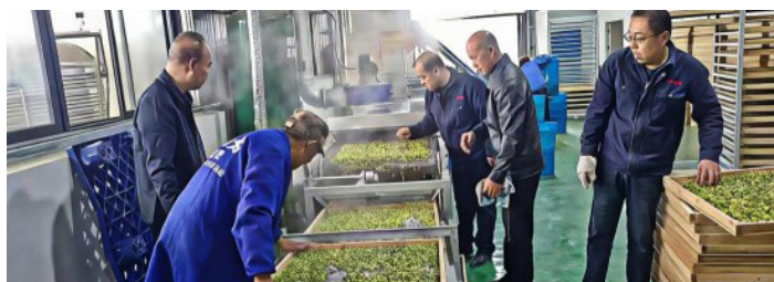
慈善信托支持的麻城市上马石村菊花产业园