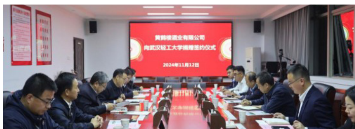
黄鹤楼酒业有限公司向武汉轻工大学捐赠设立“黄鹤楼·菁英”基金

此次获奖,是对武汉市慈善总会及其合作伙伴在扶弱济困、服务民生、乡村振兴等领域所做贡献的充分肯定。总会将以此次表彰为新的起点,继续凝聚社会爱心力量,推动我市慈善事业高质量发展,为助力建设现代化大武汉贡献慈善力量。