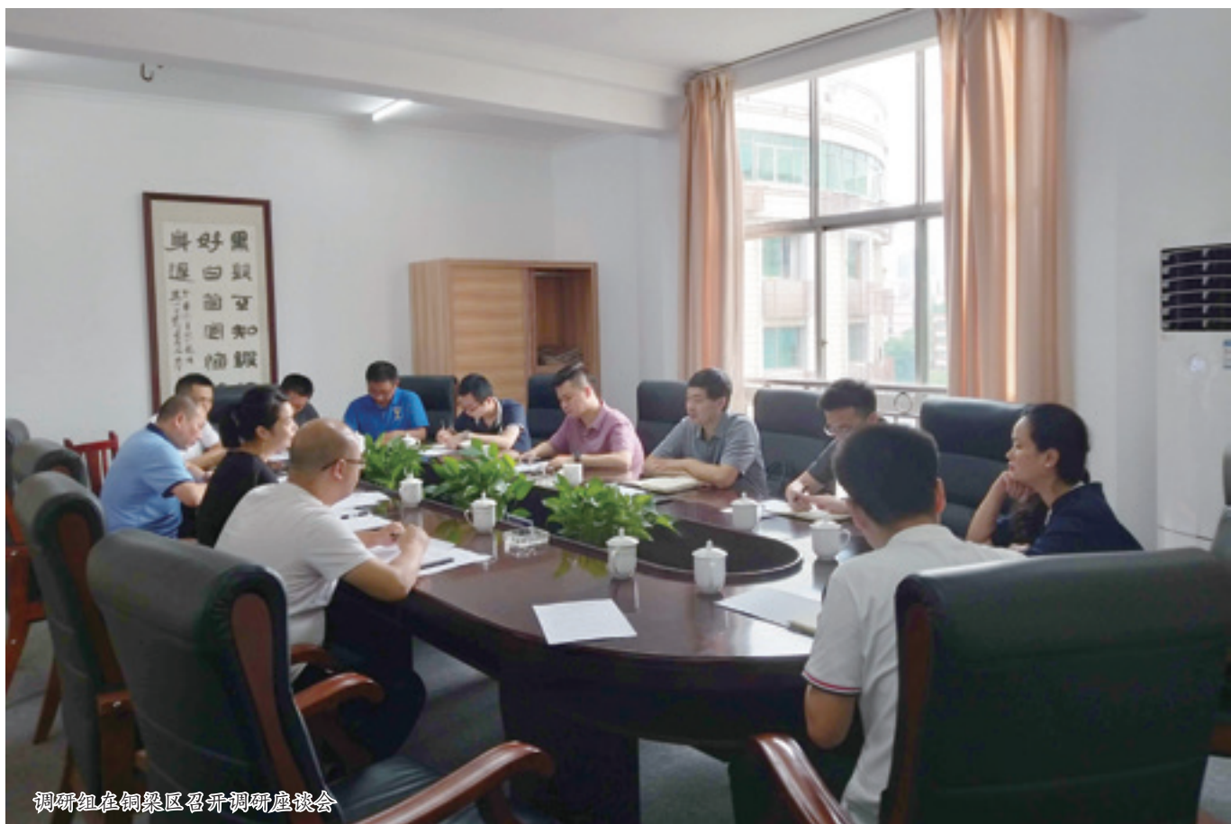
调研组在铜梁区召开调研座谈会

此外，调研组还分别同各分中心召开座谈，就调研中反应出来的问题、上半年工作中发现的问题，逐个检视、逐个探讨，共同研讨对策，找出差距抓紧落实，并把所有研讨结果淬炼成调研成果。调研结束后，三个调研组将梳理形成课题报告，为进一步分析解剖问题、切实落实整改输送养分，为实现全年目标任务夯实基础。❄