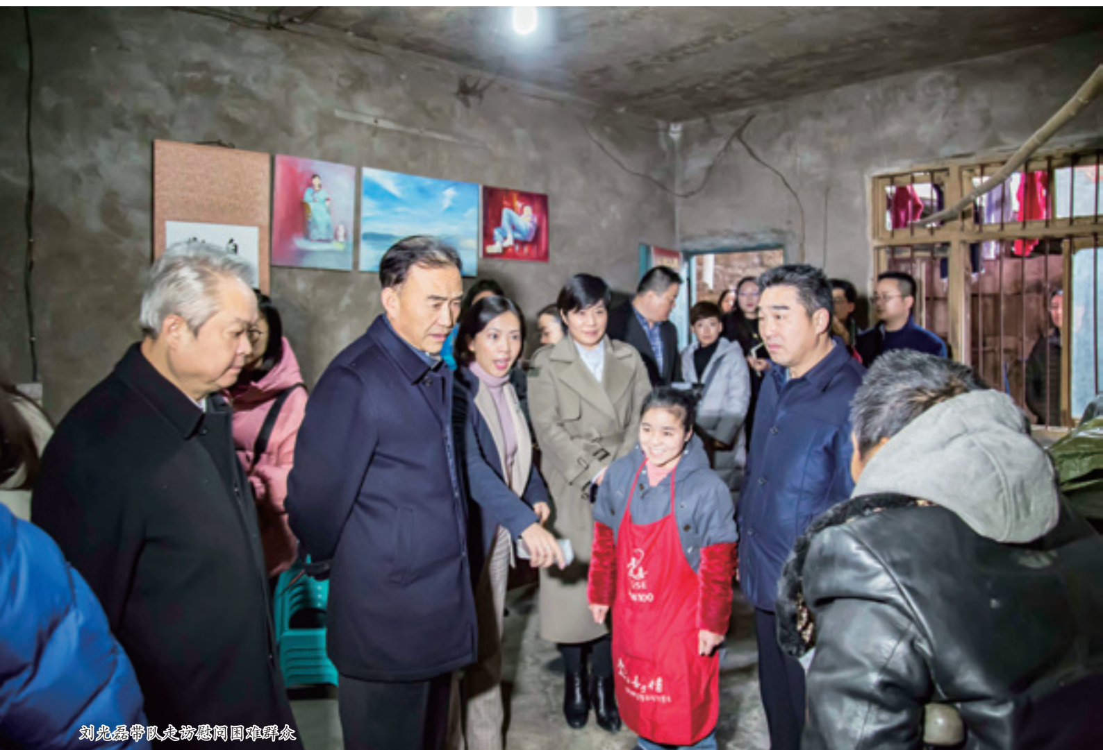
刘光磊带队走访慰问困难群众