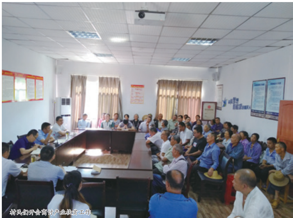
村民们开会商讨产业扶贫工作

2017年以来，在重庆市慈善总会的对口帮扶下，朝阳村完成了76户的脱贫任务；完善了公共