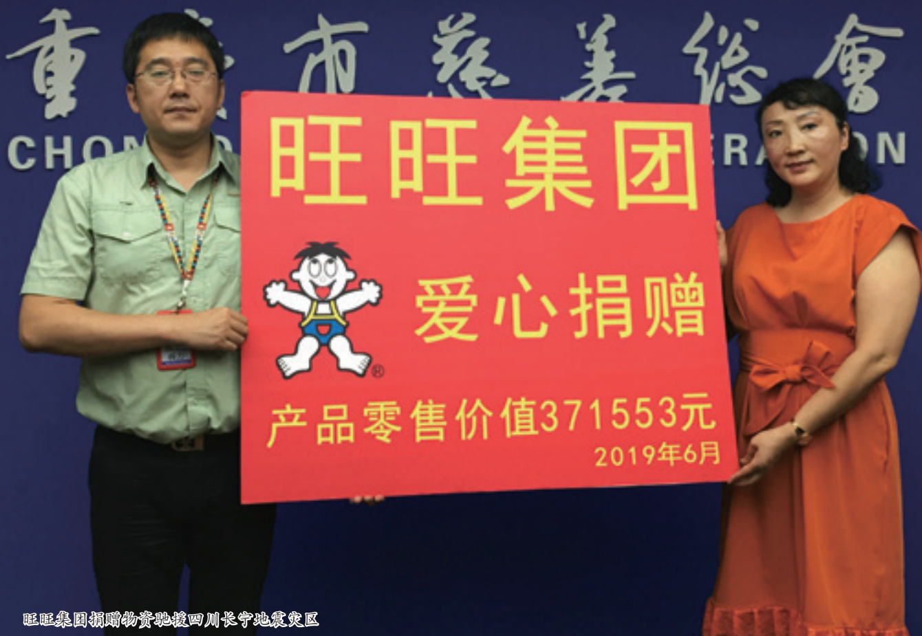
旺旺集团捐赠物资驰援四川长宁地震灾区

方有难，八方支援。6月17日，四川宜宾长宁县发生6.0级地震。地震发生后，各方救援组第一时间