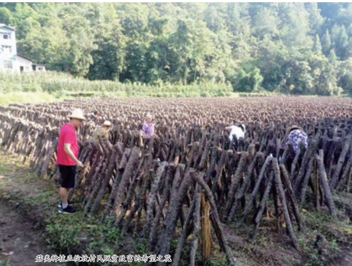
苗木种植正绽放村民脱贫致富的希望之花

在产业扶贫上，重庆市慈善总会将资助 48.5 万元在云阳县泥溪镇架设便民桥。继续支持龙洞镇朝阳村核桃基地和葱花基地发展，将拨付后续资金 15 万元用于基地管护工作。