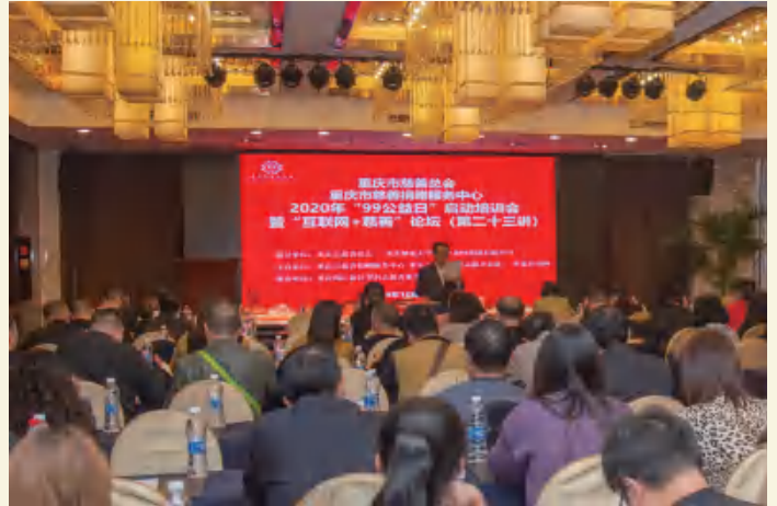
△ 况由志主持2020年“99公益日”培训会