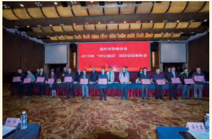
△ 市慈善总会2019年“99公益日”表彰先进单位（二）