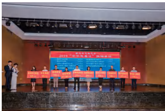
△ 2019“中华慈善日”重庆爱心企业举牌捐赠（二）