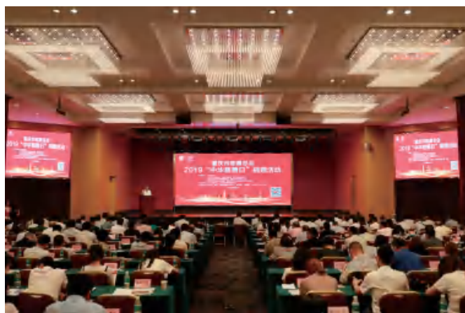
△ 市慈善总会开展2019“中华慈善日”活动