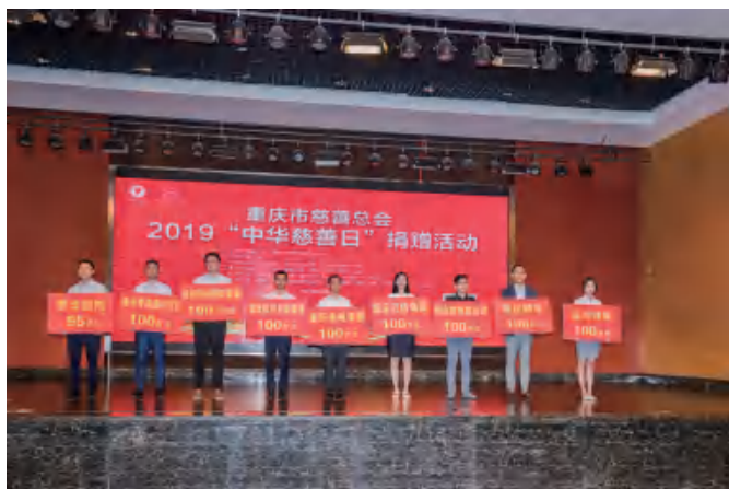
△ 2019“中华慈善日”重庆爱心企业举牌捐赠（一）