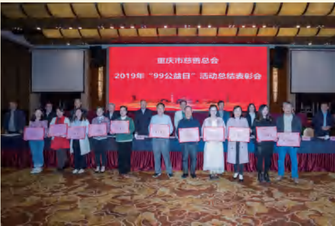
△ 市慈善总会2019年“99公益日”表彰先进单位（一）