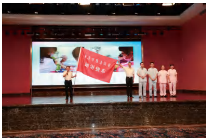
△ “助浴快车”活动负责人介绍项目试运行情况及未来展望