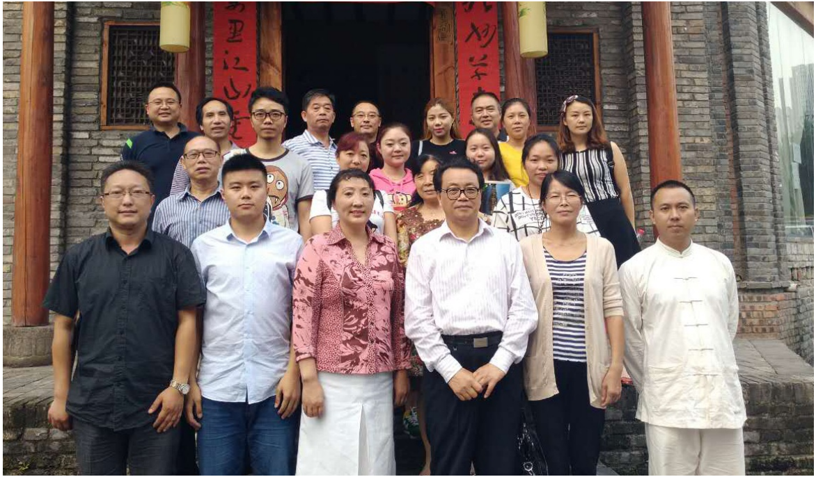
2016年9月21日在南桥书院开展“互联网+慈善”论坛（第五讲）活动