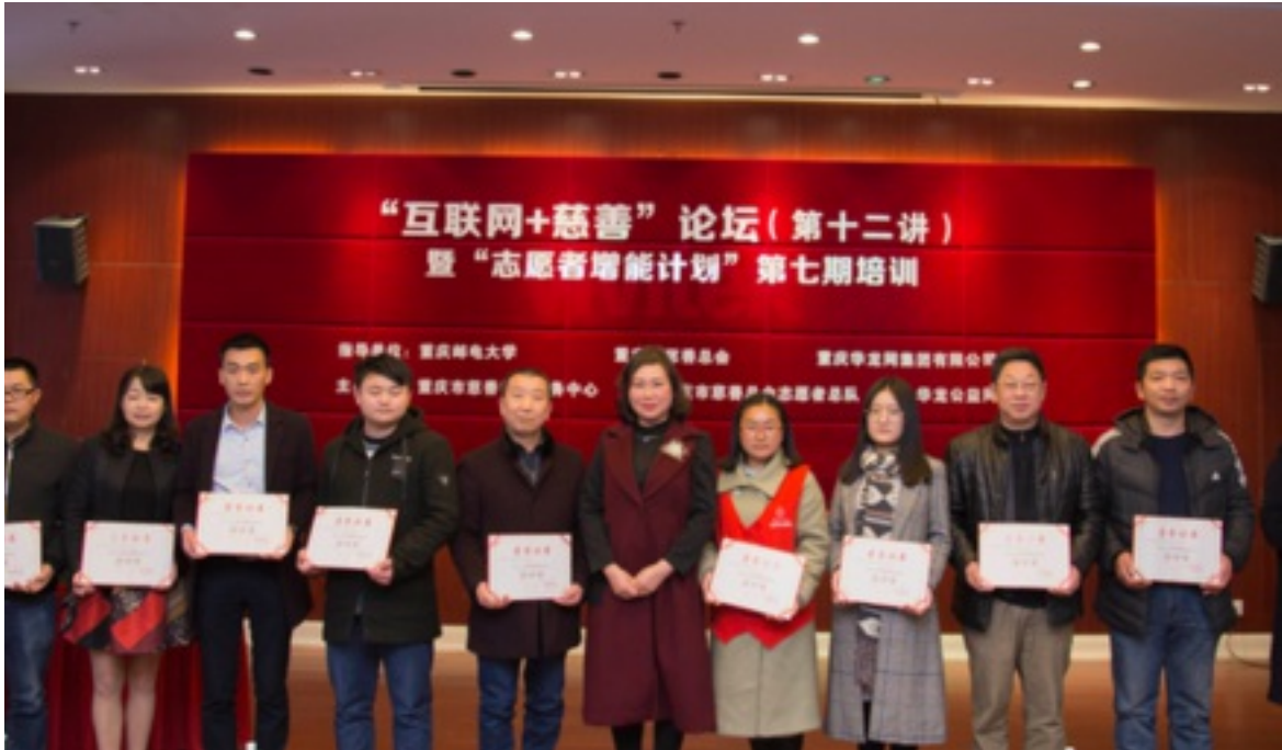
2017年12月8日 重庆市慈善总会在市政协一楼会议室举办“互联网+慈善”论坛第十二讲活动