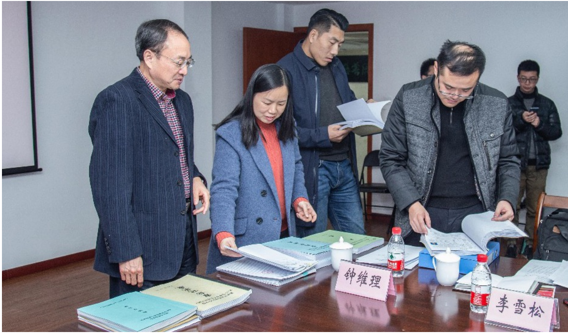
2019年12月12日重庆市慈善总会举行第四届监事会第六次会议