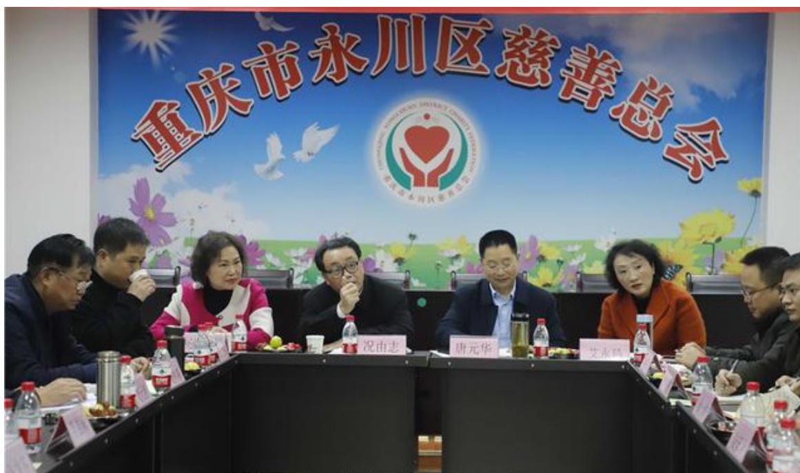
2020年1月10日 重庆市慈善总会、重庆市慈善捐赠服务中心在永川区慈善总会组织召开2020年“99公益日”活动启动片区会议