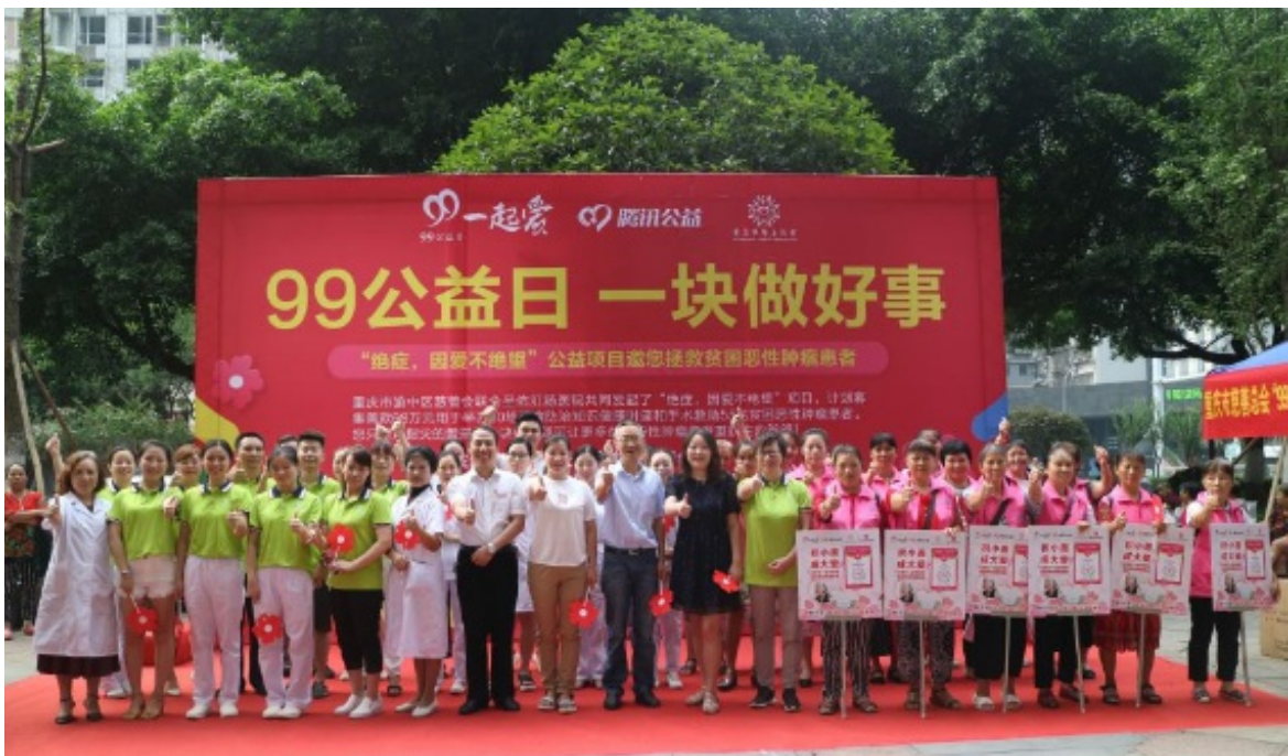
2019年9月7日渝中区慈善会举行“99公益日” ——贫困恶性肿瘤患者公益募捐启动仪式