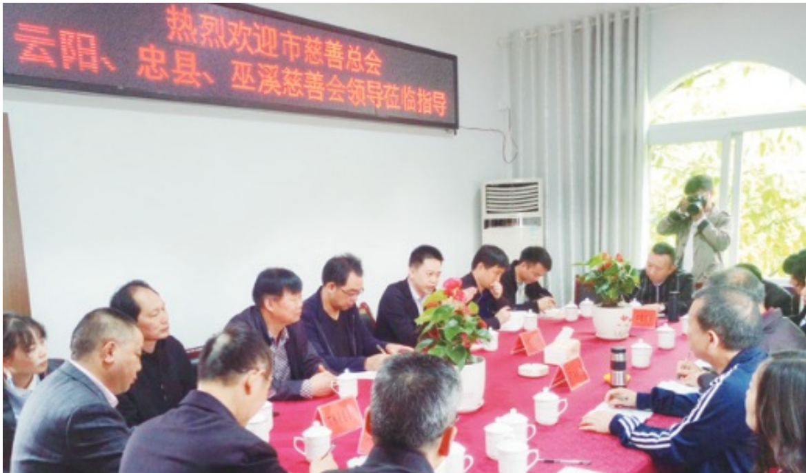
2019年5月9日 重庆市慈善总会邀请忠县、云阳、巫溪等县慈善会在石柱县慈善会举办“99公益日”活动专题交流培训