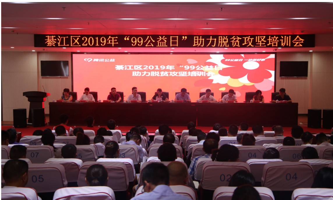
2019年8月26日，綦江区召开2019年“99公益日”助力脱贫攻坚培训会