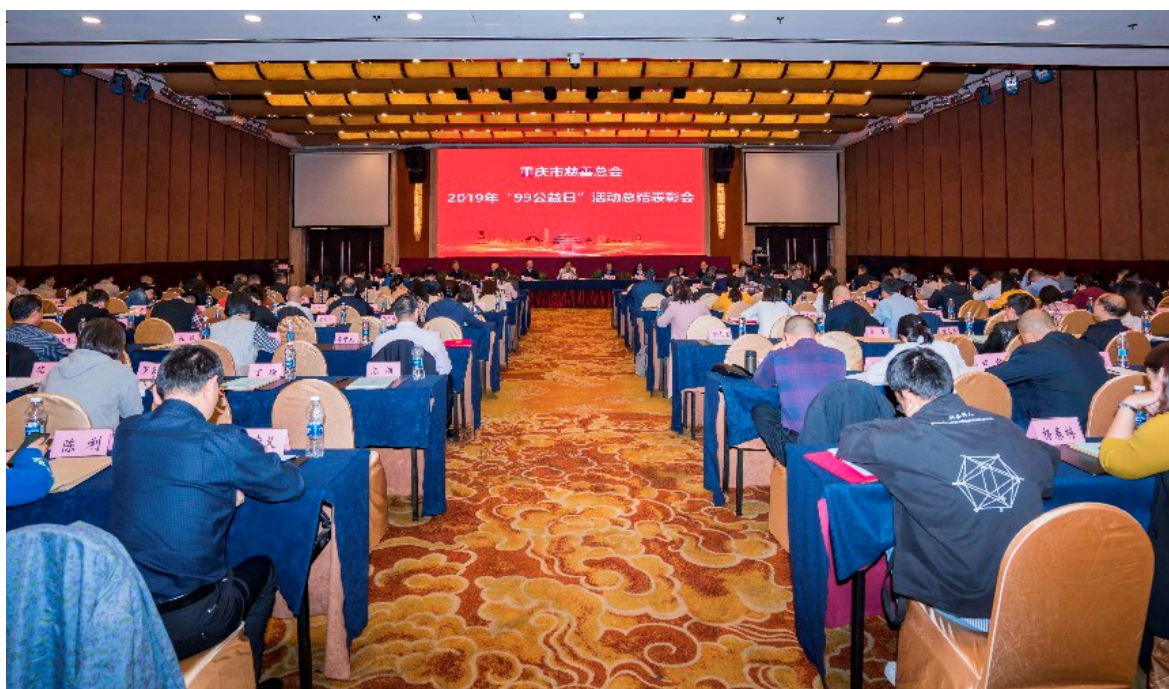
2019年11月1日 重庆市慈善总会举行2019年“99公益日”活动总结表彰会暨“互联网+慈善”论坛（第二十四讲）