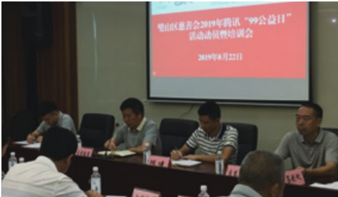
2019年8月22日 重庆市慈善总会互联网办公室 赴璧山区慈善会举行“99公益日”活动动员暨培训会