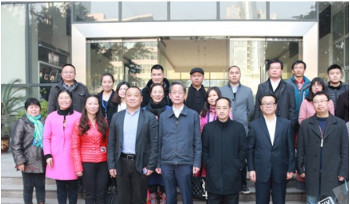
2017年02月17日“互联网+慈善论坛（第七讲）