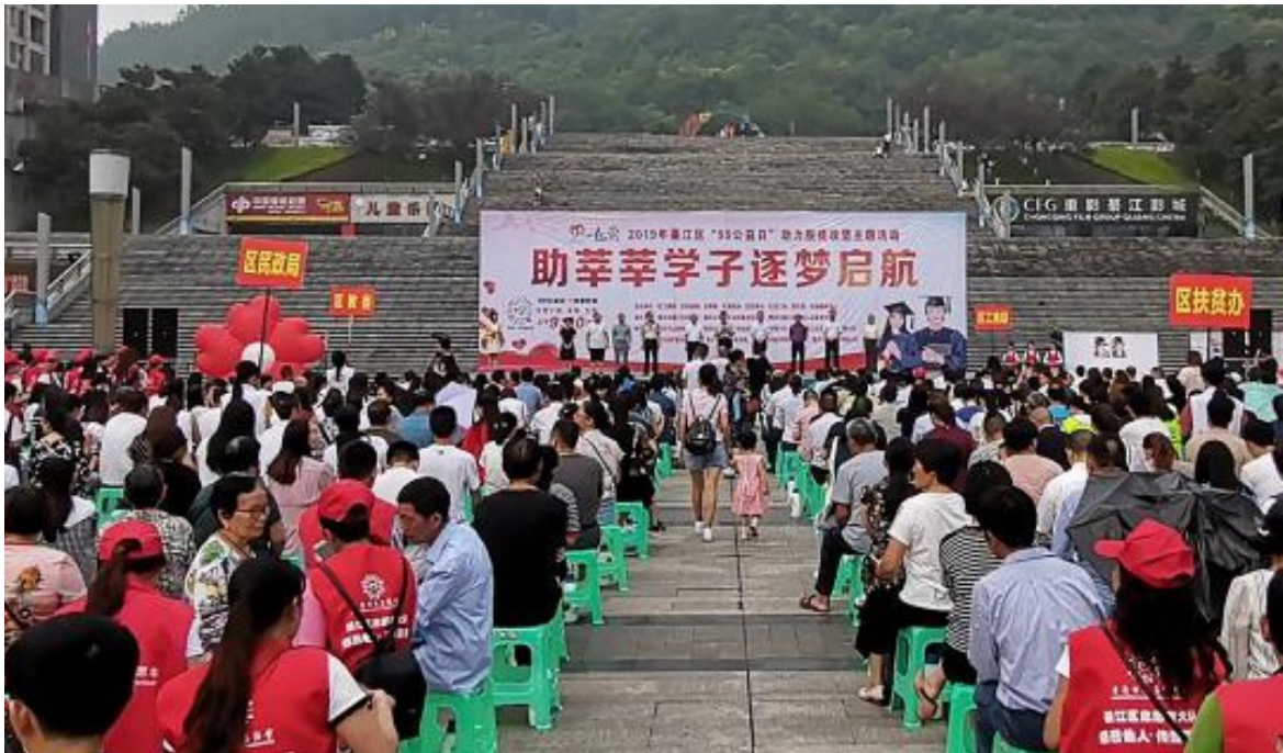
2019年9月11 綦江区“99公益日”网络募捐突破一千万大关