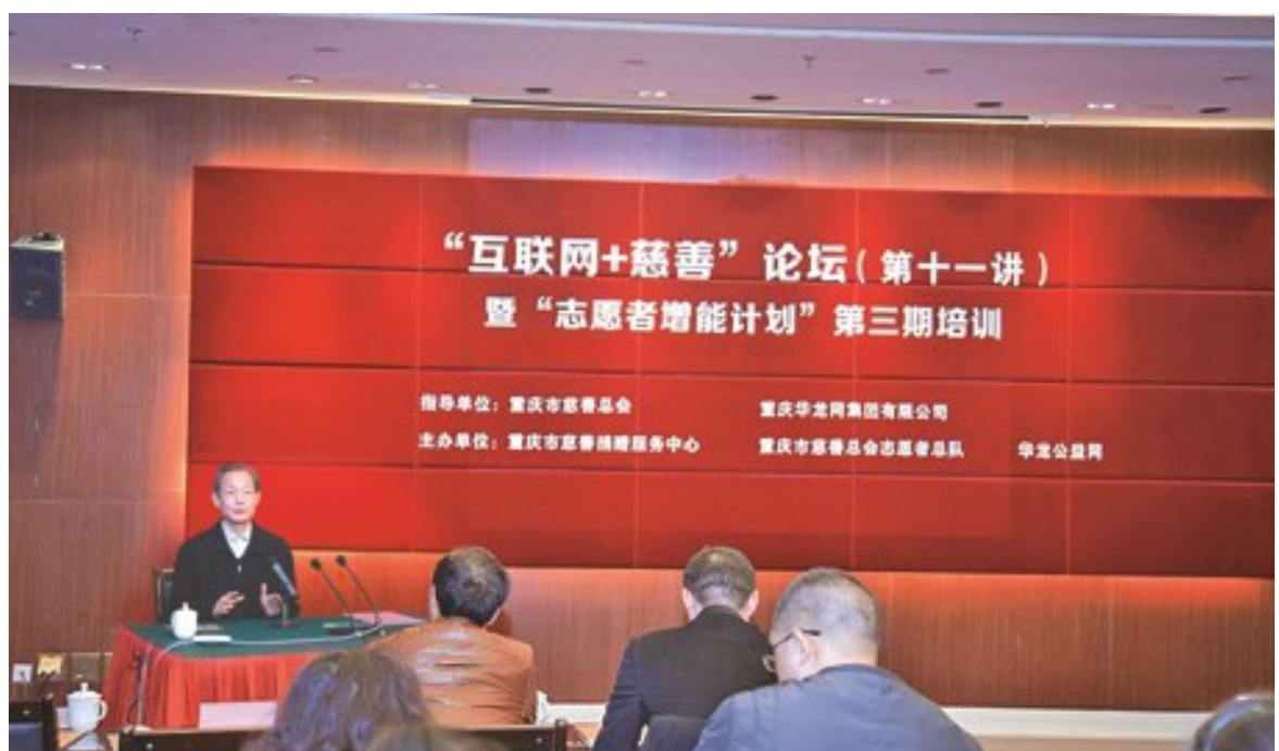
2017年02月28日“互联网+慈善”论坛（第十一讲）暨“志愿者增能计划”第四次培训，重庆市政协办公厅底楼会议室