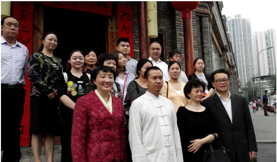
2016年4月28日“互联网+慈善”论坛（第三讲）在南桥书院开讲