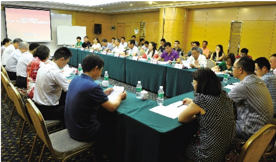
2018年6月11日 重庆市慈善总会举行2018年“互联网+慈善”项目策划和培训会