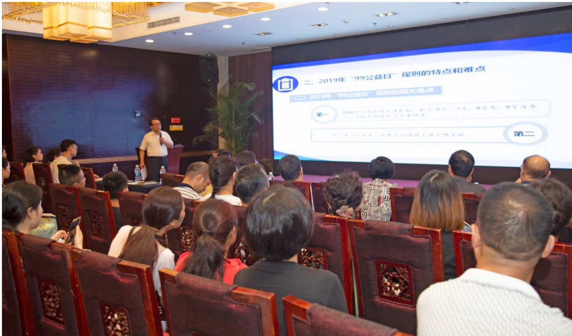
2019年7月26日 重庆市慈善总会举办 “互联网+慈善”论坛第二十二讲