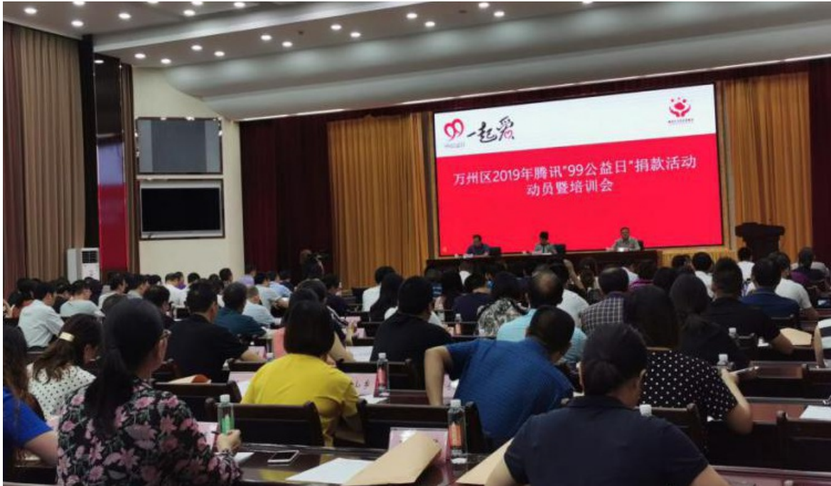
2019年9月3日 万州区2019年腾讯“99公益日”募捐动员暨培训会