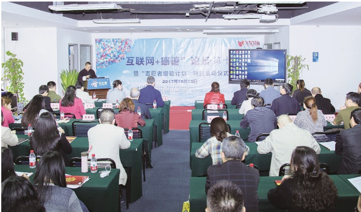
2017年10月12日 重庆市慈善总会“互联网+慈善”交流会(第十讲)