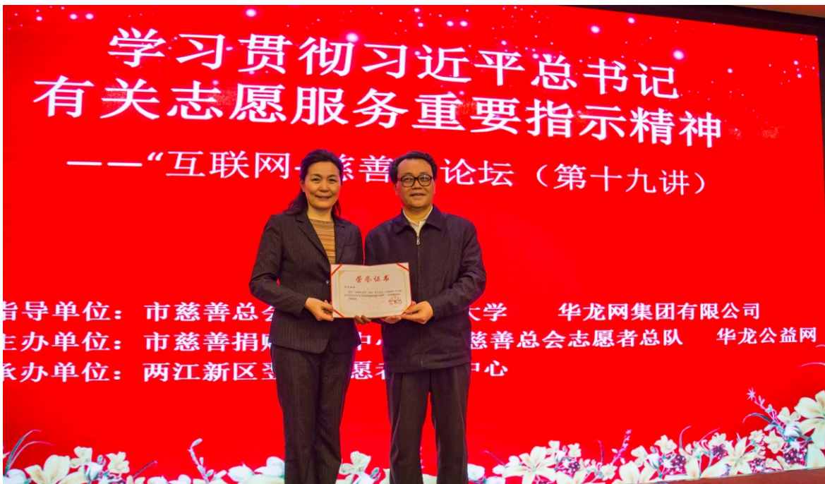
2019年3月22日重庆市慈善总会举办“互联网+慈善”第十九讲分享会和区县慈善工作座谈