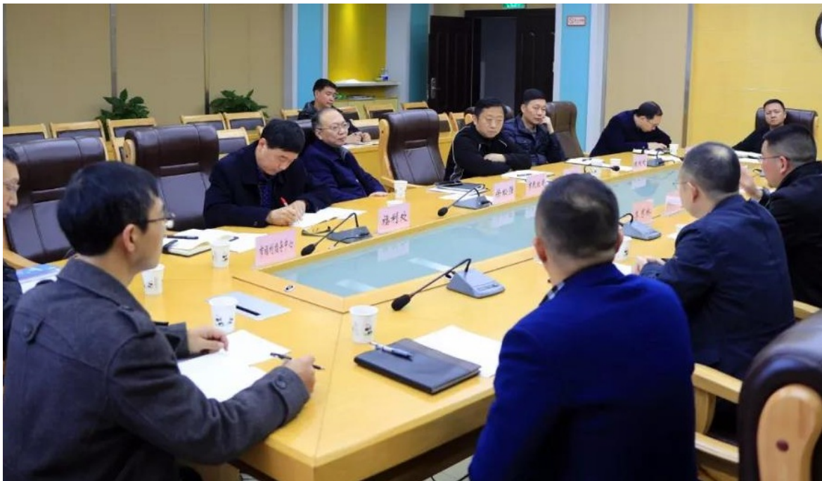
2018年11月29日 市民政局召开 智慧社区智慧养老云平台建设对接会