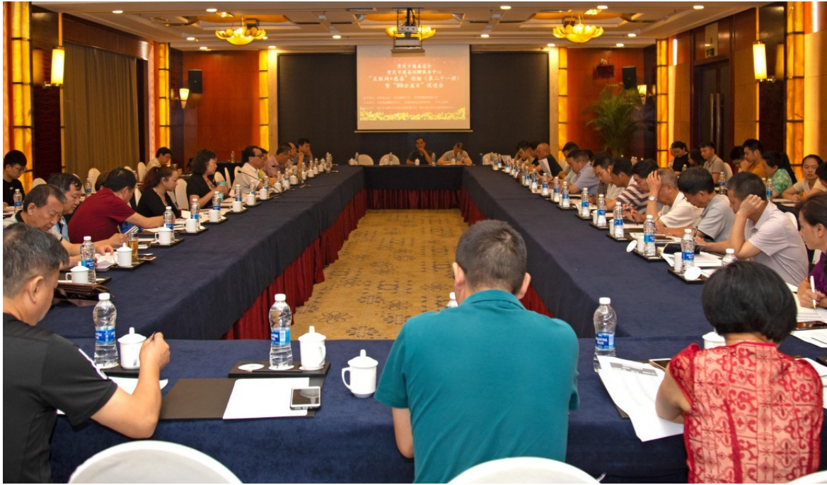
2019年7月8日，重庆市慈善总会在世纪金源大饭店举行“互联网+慈善”论坛（第二十一讲）暨“99公益日”促进会