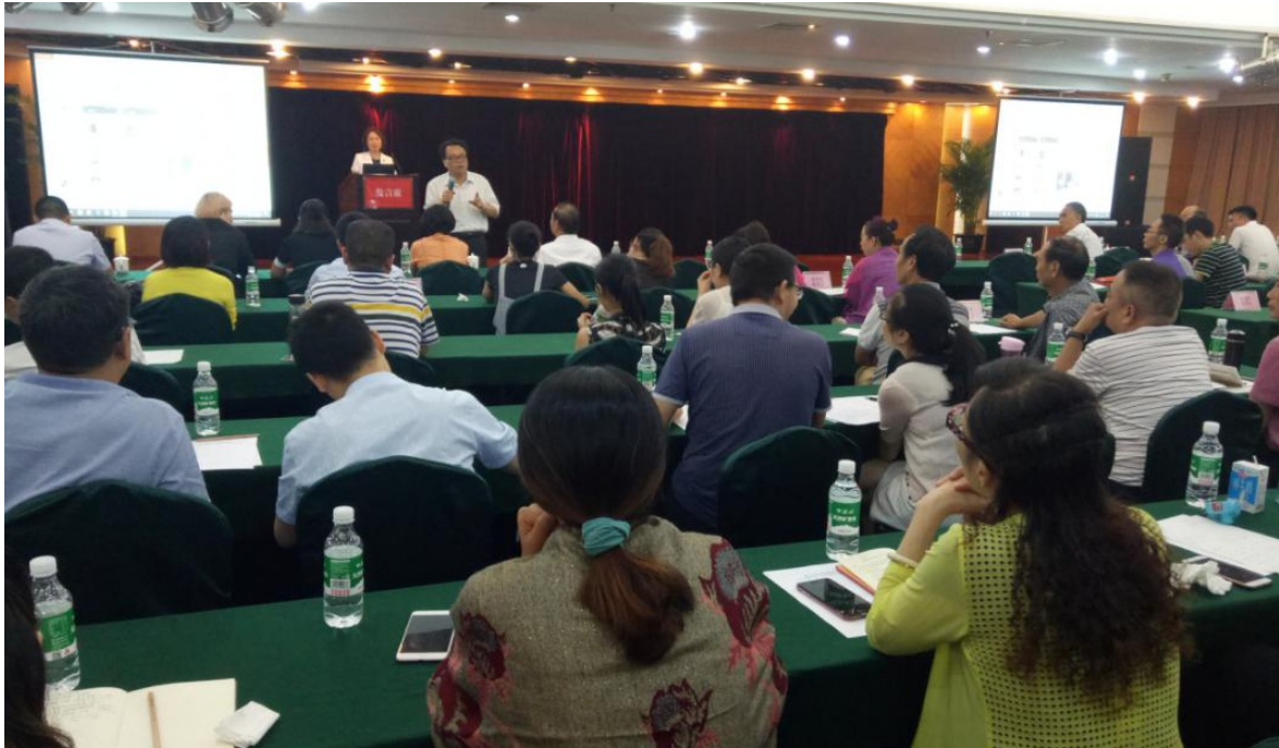
2018年6月8日“互联网+慈善”论坛（第十五讲）， 重庆市江北区红锦大道63号重庆阳光五州大酒店