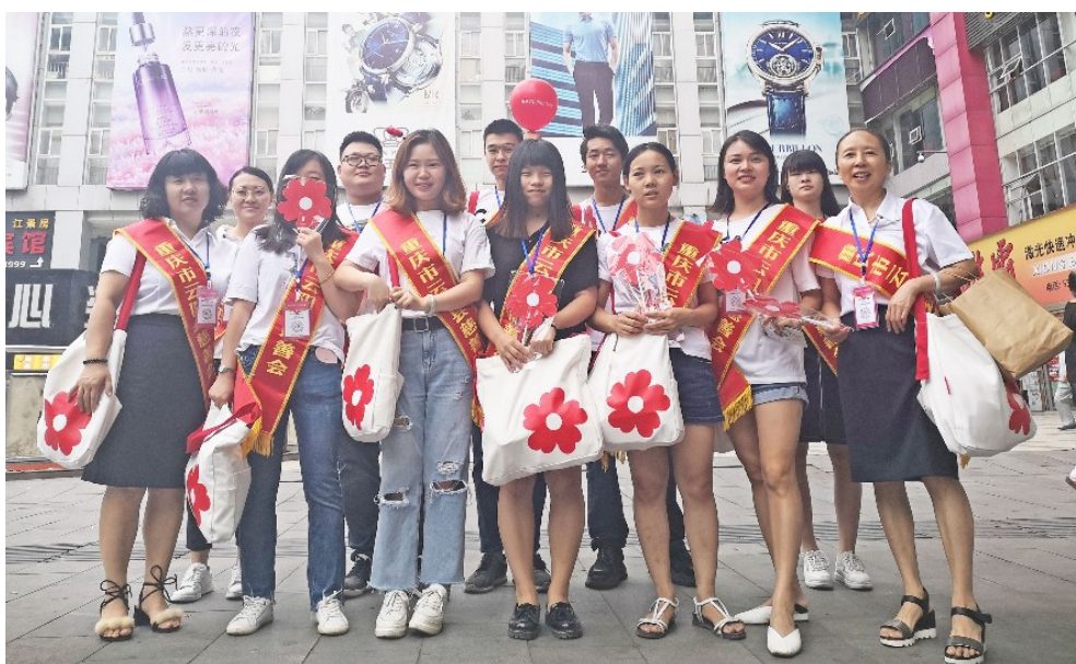
2019年9月7日 云阳县慈善会自愿者 在重百广场开展“99公益日”宣传和扫码活动