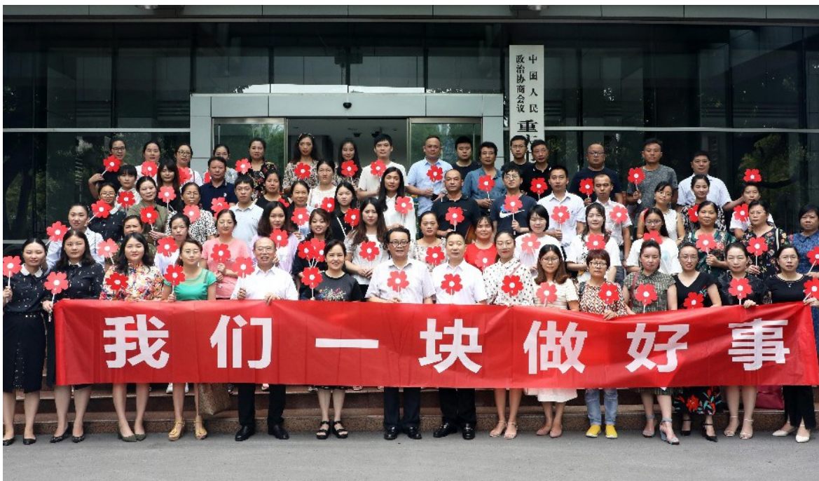
2019年9月10日 永川区为期三天的“99公益日”募捐活动筹款总额为1538.51万元