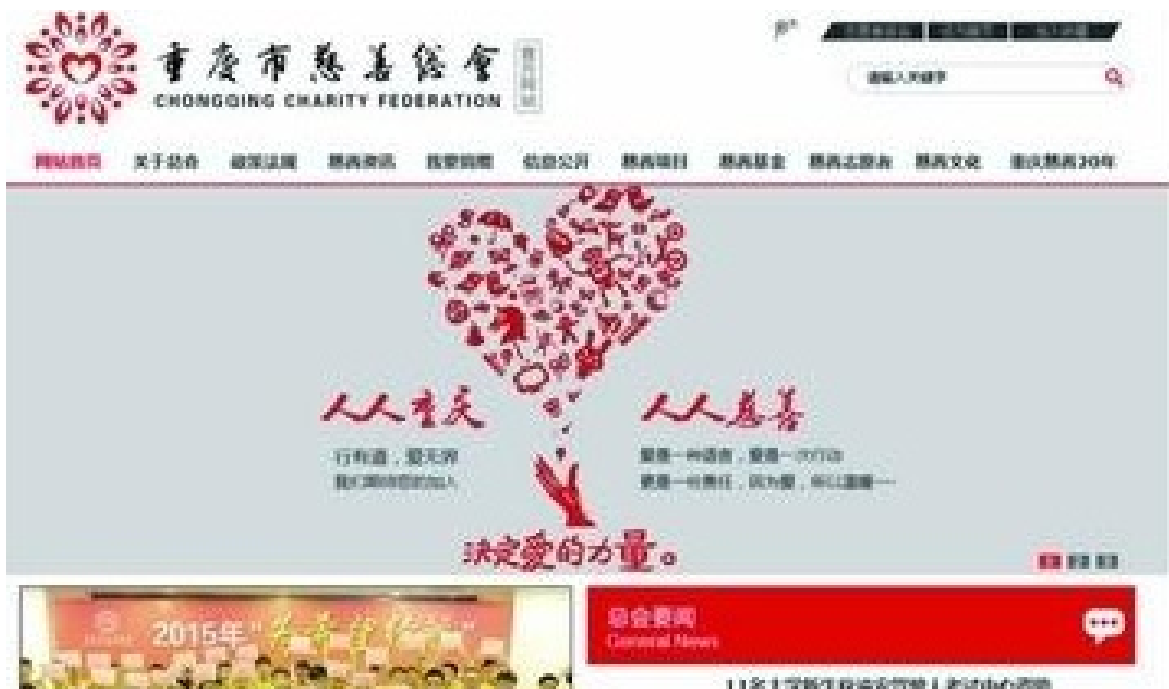
2015年7月1日 重庆市慈善总会新版官方网站 ( http://www.cqcszh.com/ ) 正式运行