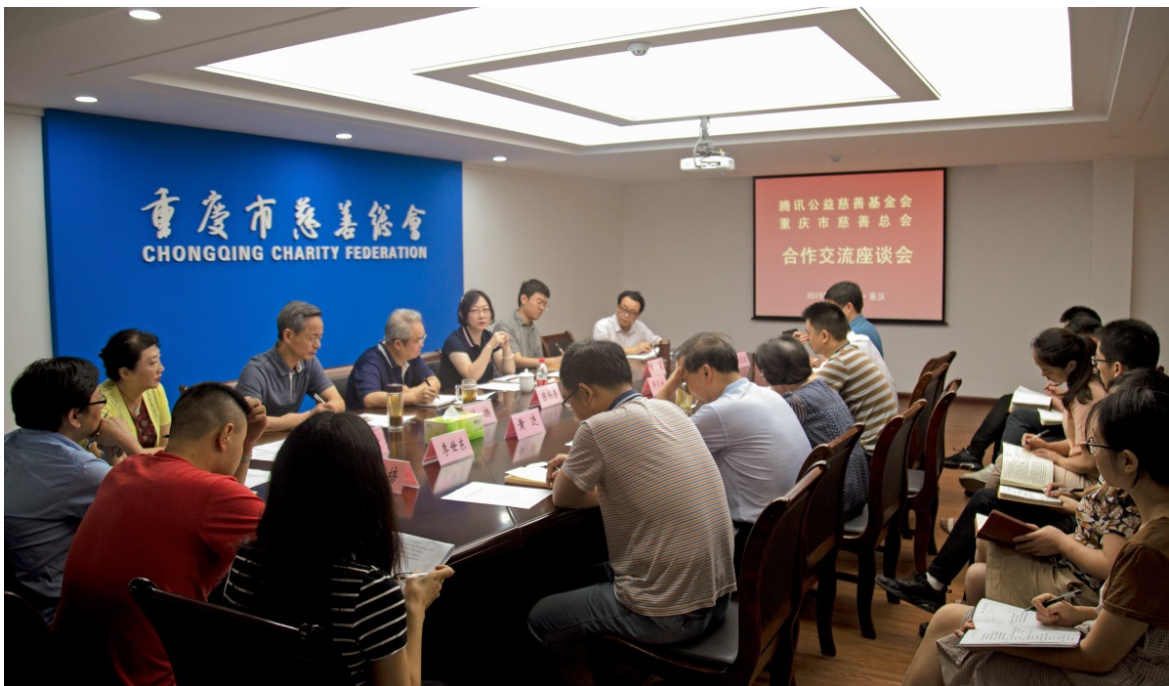
2019年7月11日 重庆市慈善总会、 腾讯公益慈善基金会举行合作交流会