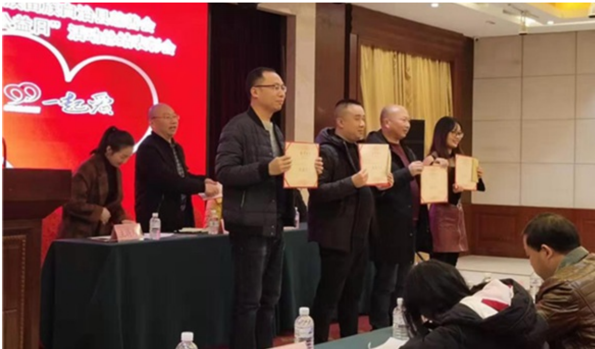
2019年12月5日秀山县慈善会在亚西酒店 多功能会议室召开2019年“99公益日”活动总结表彰会