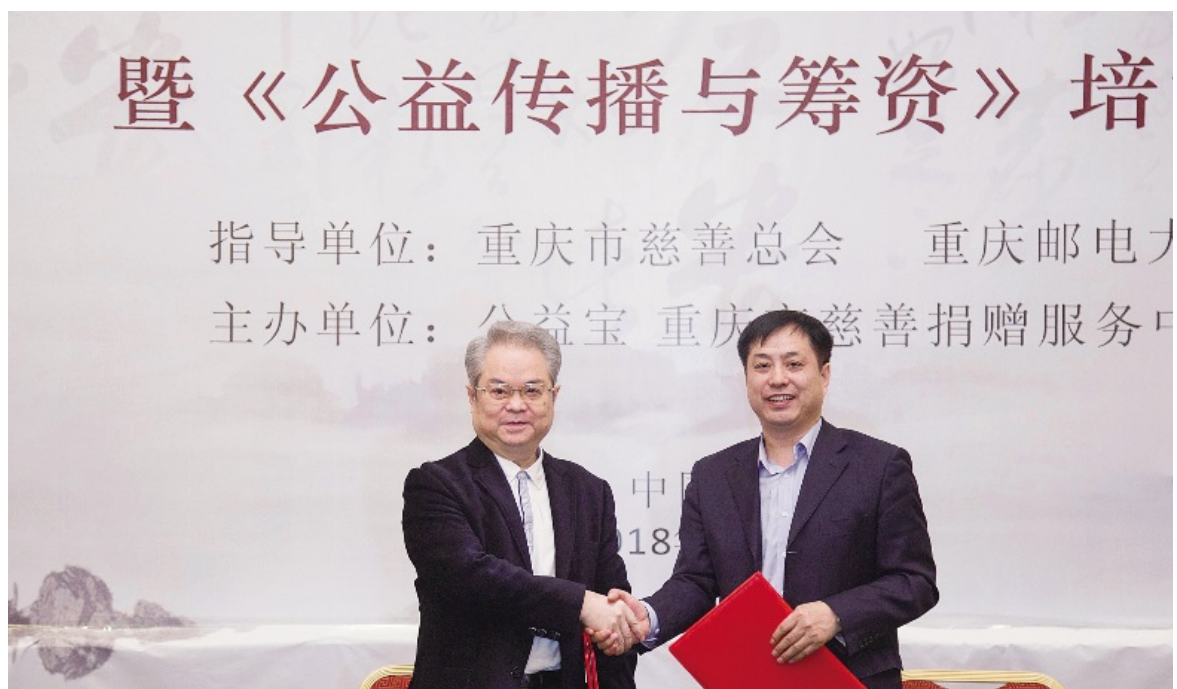
2018年3月16日，重庆市慈善总会和公益宝在渝举行战略合作协议洽谈会，签署战略合作协议