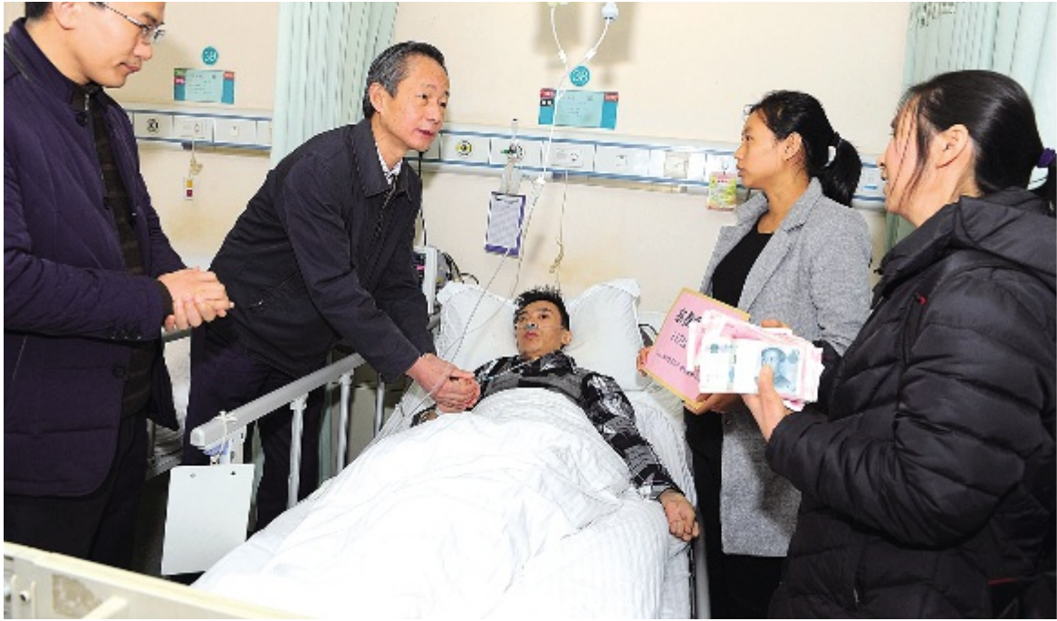
2017年1月15日“微慈善”平台为脑胶质瘤患者募捐11.7万元