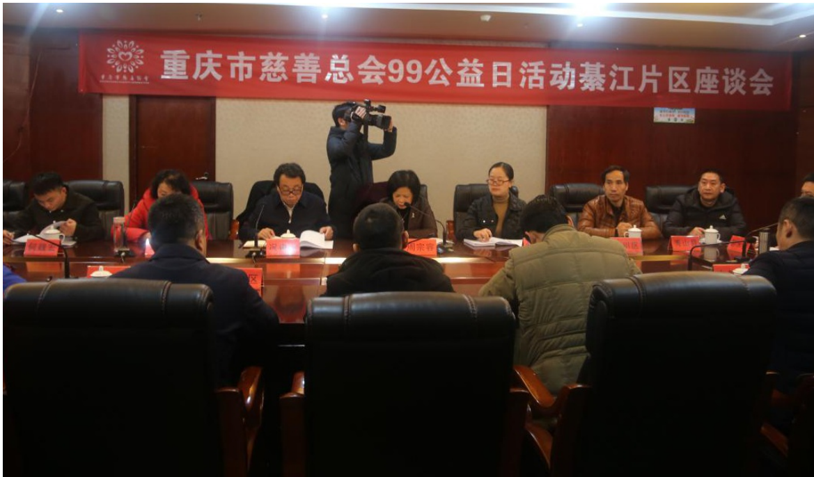
2018年12月12日，重庆慈善总会 在綦江区组织召开“99公益日”工作座谈会