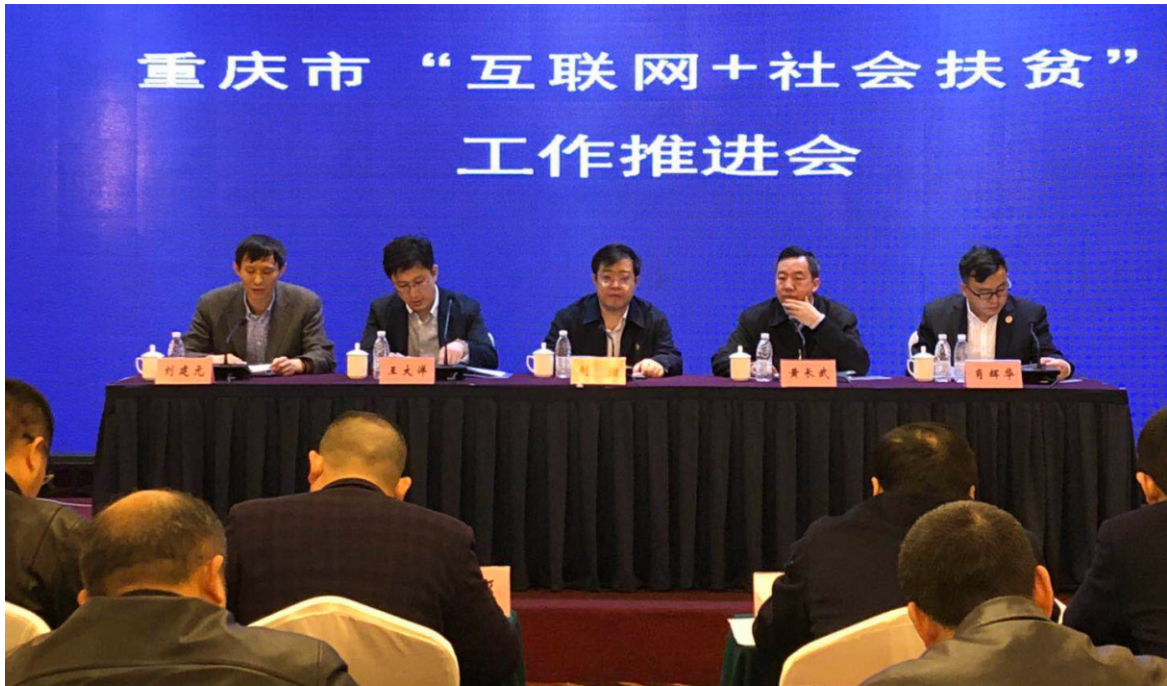
2018年3月21日 重庆市“互联网+”社会扶贫工作推进会召开