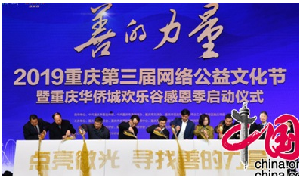
2019年11月23日 2019重庆第三届网络公益文化节启动