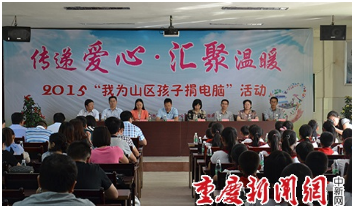
2015年10月8日 “我为山区孩子捐电脑” 活动捐赠仪