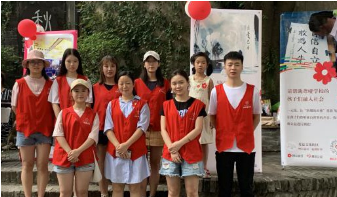
2019年9月7日重庆市慈善总会志愿者总队 慈善文化大队“99公益日”在北碚图书馆线下募捐活动