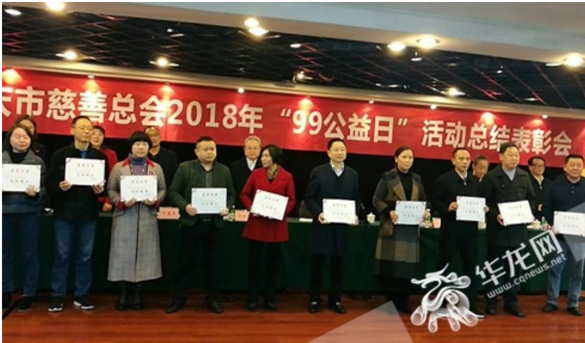
2018年11月12日 重庆市慈善总会2018年“99公益日”活动总结表彰会暨“互联网+慈善”论坛（第十七讲）