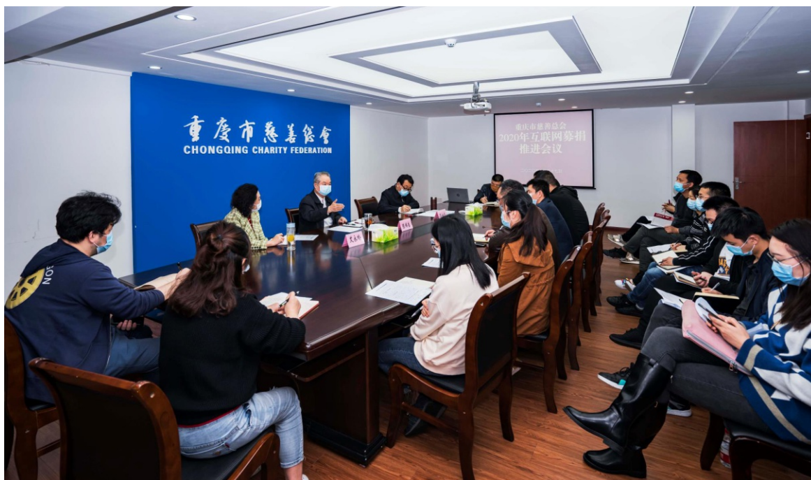
2020年3月27日，重庆市慈善总会召开了互联网募捐推进会