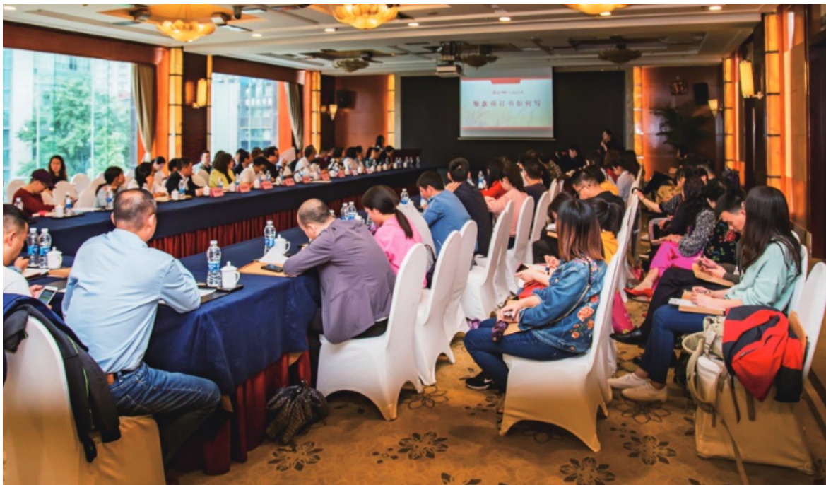
2019年5月20日，“互联网+慈善”论坛（第二十讲）