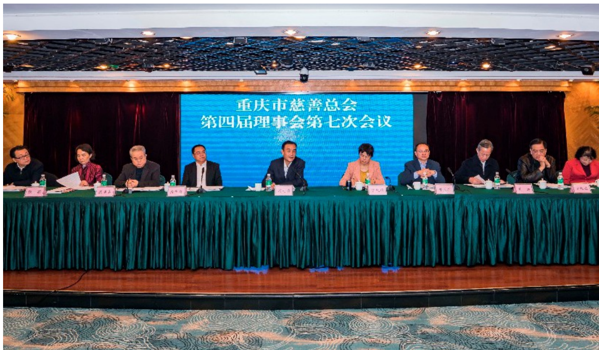
2019年12月20日，重庆市慈善总会召开第四届理事会第七次会议