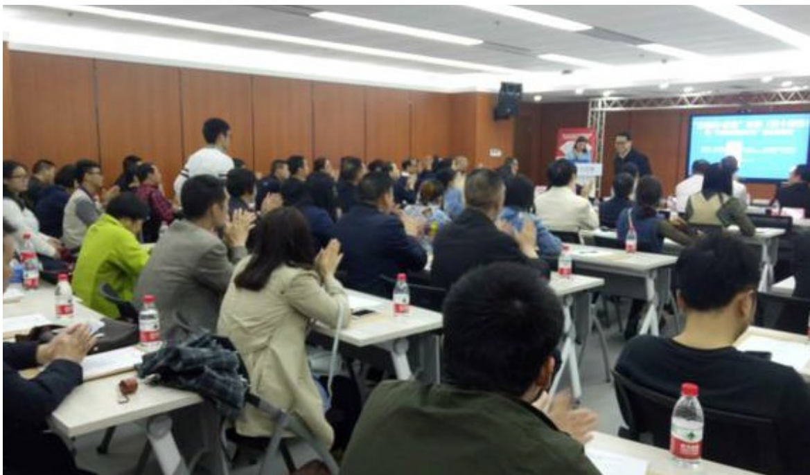
2018年4月13日“互联网+慈善”论坛（第十四讲） 暨“志愿者增能计划”第九次培训，华龙网201会议室