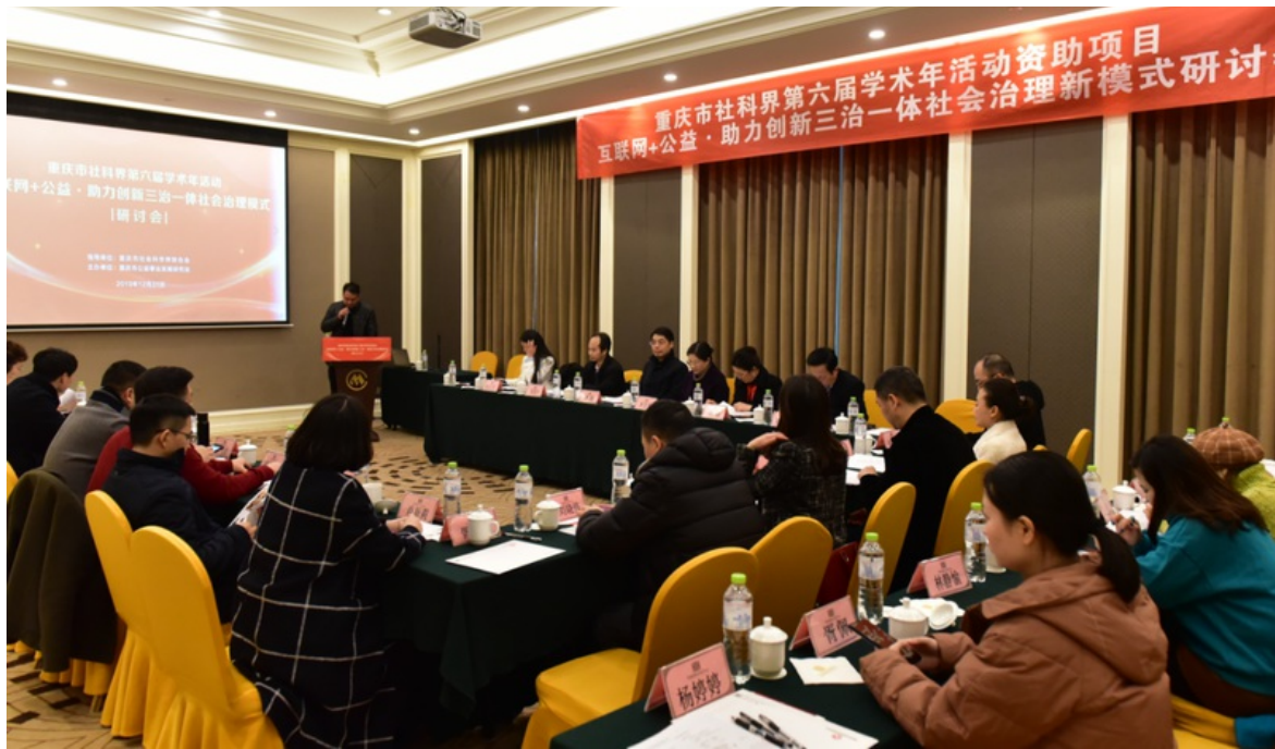
2019年12月31日 “互联网+公益·助力创新三治一体社会治理模式”研讨会在重庆华商国际会议中心举行