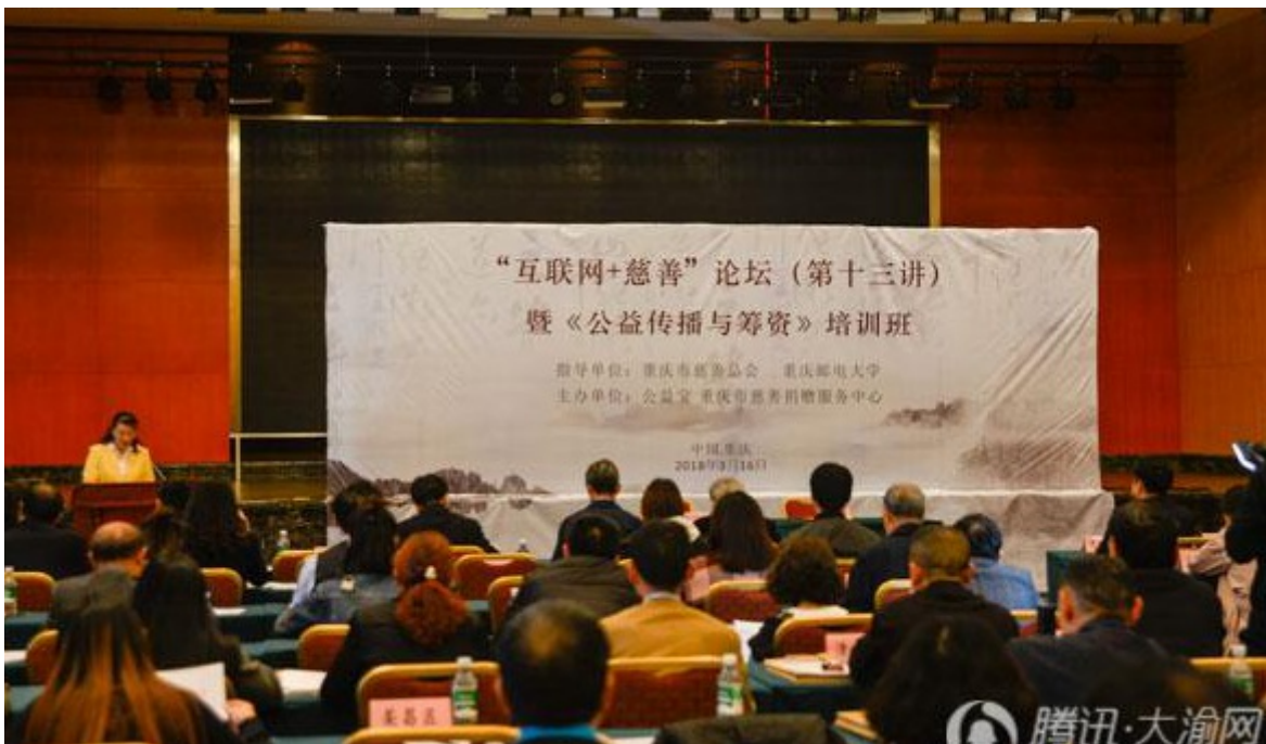
2018年3月16日，由公益宝和重庆市慈善总会、重庆市慈善捐赠服务中心联合主办了“互联网+慈善”论坛（第十三讲）在渝举行