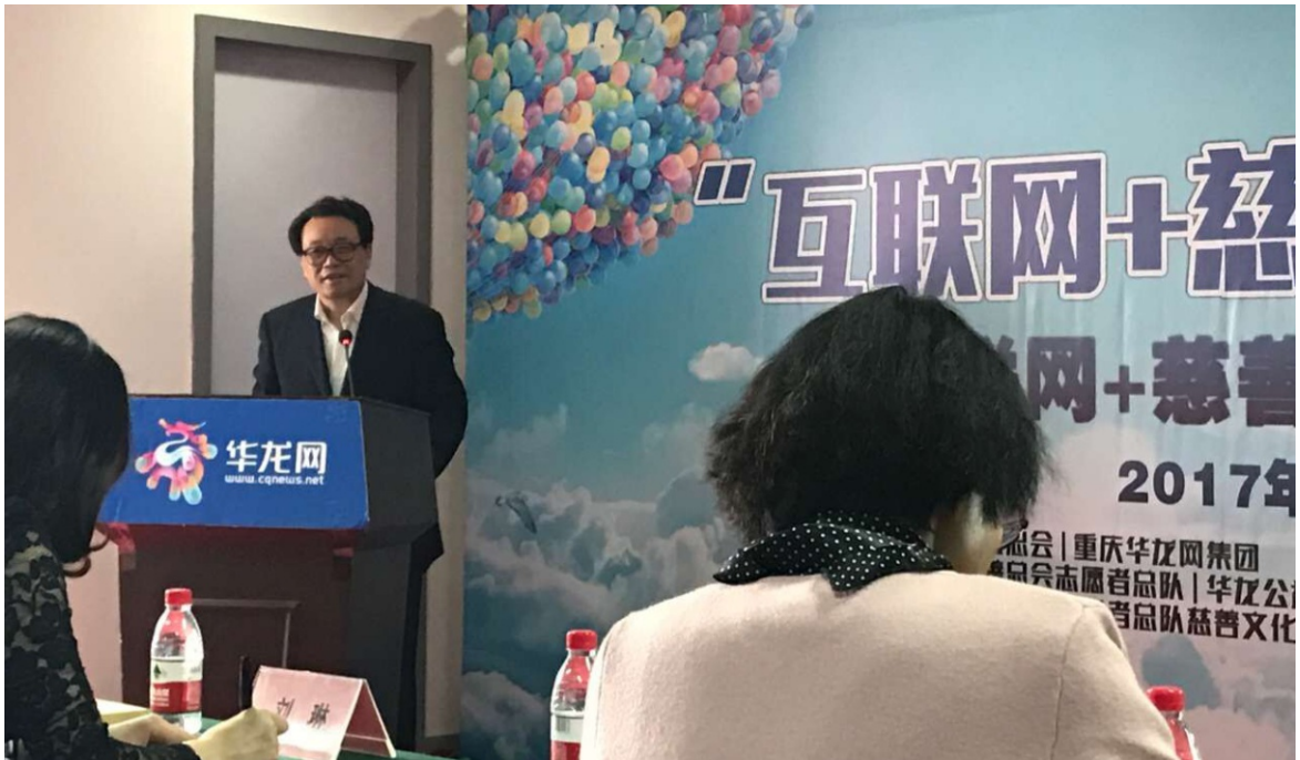
2017年6月23日慈善法与“互联网+慈善”——“互联网+慈善”论坛（第八讲）地点：两江新区青枫北路18号凤凰A座7楼华龙网多功能厅