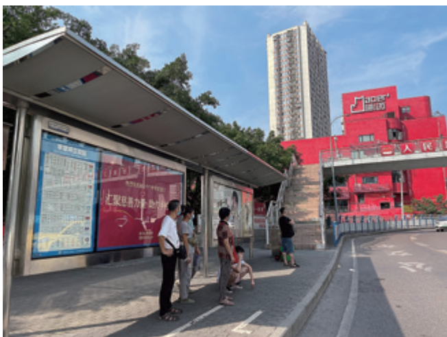
公交车站宣传广告