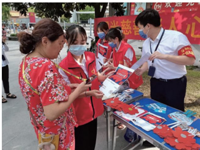
志愿者引导市民参与活动

同时，市慈善总会将对“99公益日”项目严格实施清单化、项目化管理，加大透明公示力度，约请第三方对慈善项目进行评估、审计，指导、监督有关区县慈善会、社会组织、志愿服务组织把所有善款落实在项目上、落实在助力乡村振兴上、落实在困难群众身上，不辜负广大捐赠者的爱心和善意，让困难群众真正得到实惠。✿