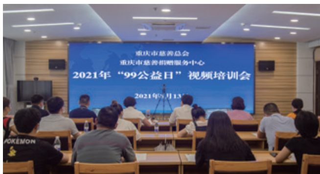
重庆市慈善总会 99 公益日视频会

其中，《又遇云朵上的村庄》《乡村人的一技之长》等助力乡村振兴类项目筹募款项 3.8 亿元，《援助困难家庭》《抚慰星星的孩子》等助力城市扶弱济困类项目筹募款项 0.8 亿元，《社区治理创新发展》等助推公益事业等项目筹募款项 0.43 亿元。