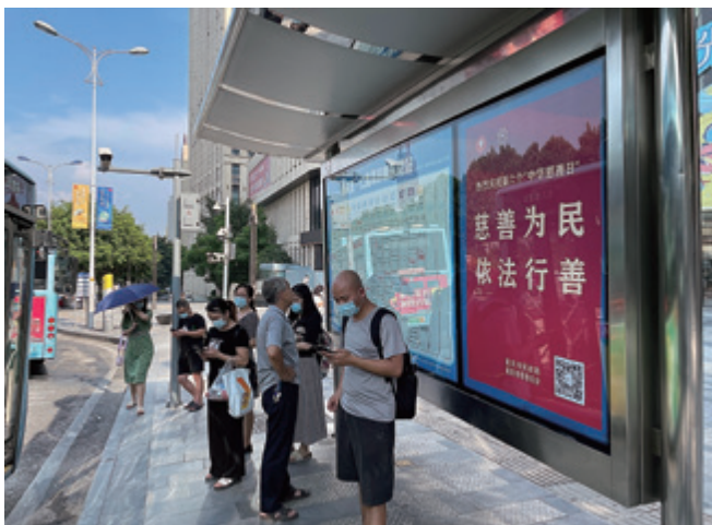
公交车站宣传广告