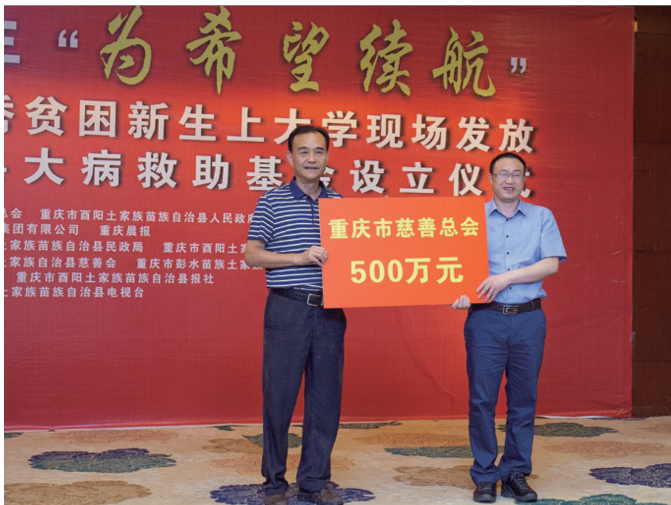
2017年8月15日，市慈善总会在酉阳土家族苗族自治县县举行2017年“为希望续航”——援助优秀贫困新生上大学现场发放暨酉阳土家族苗族自治县大病救助基金设立仪式。

此次荣获“慈善项目和慈善信托奖”的重庆市渝东南少数民族地区脱贫攻坚助推综合项目是由市慈善总会指导实施的慈善品牌项目。自2014年实施以来，该项目已累计捐赠渝东南少数民族地区款物2.2亿元，惠及困难群众数十万人次。