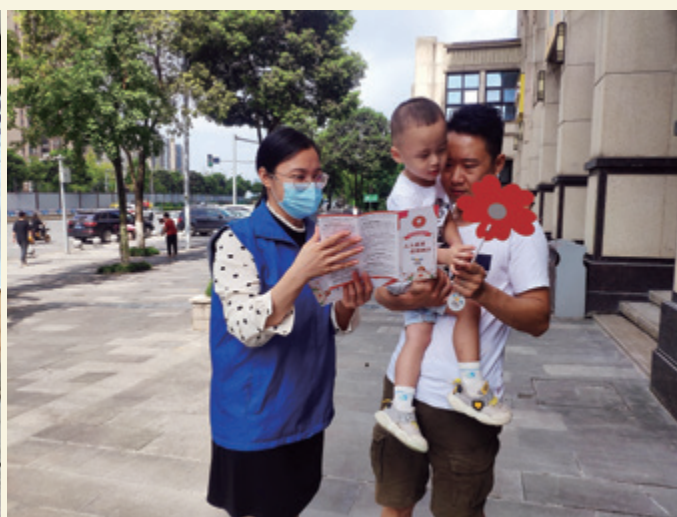
做公益做慈善，从小开始引导