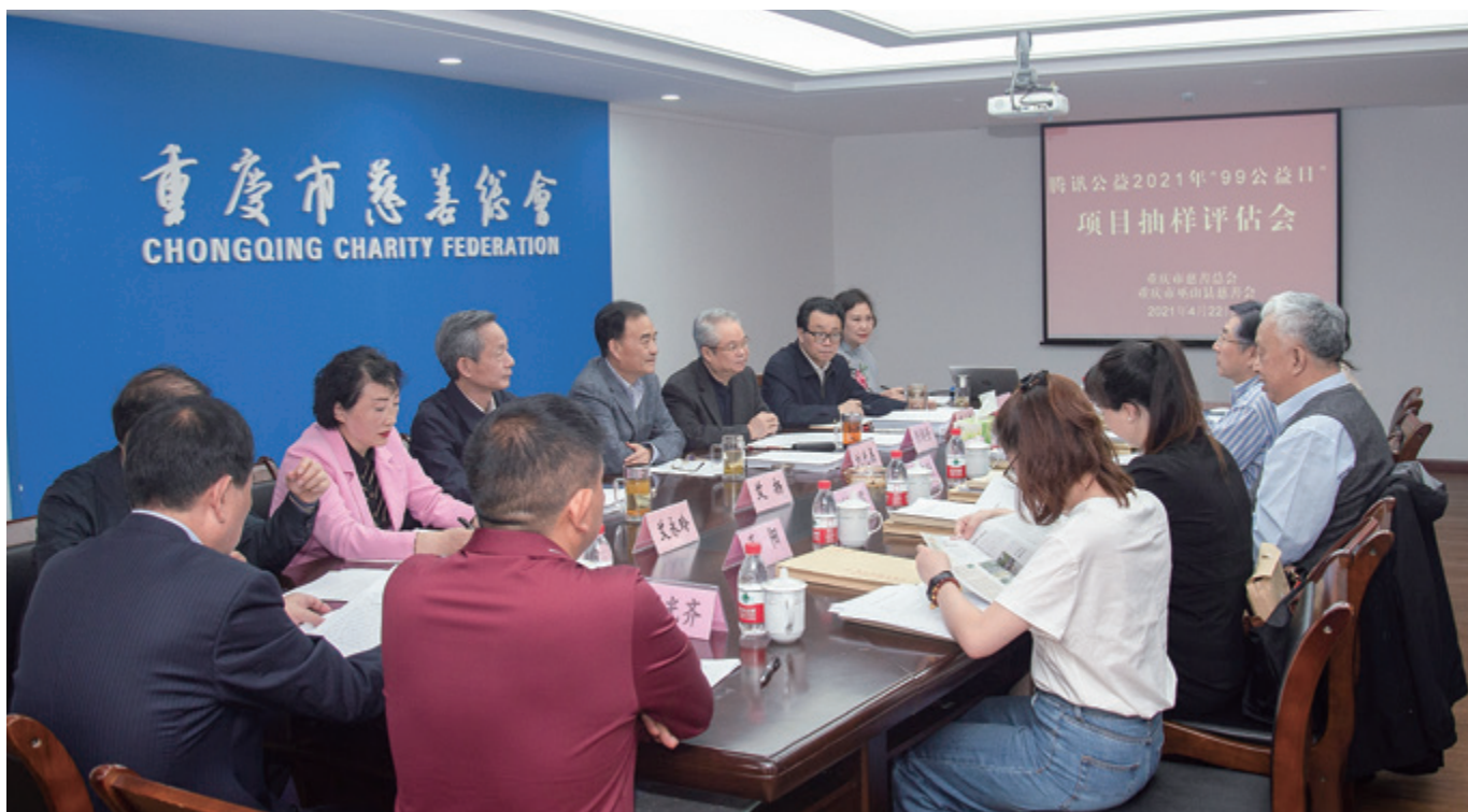
99 公益日项目抽样评估会

为作好“99 公益日”相关工作，市慈善总会坚持早谋划、早动员、早培训。早在去年 10 月 30 日，市慈善总会召开 2020 年“99 公益日”活动总结表彰大会，会上就 2021 年“99 公益日”筹备工作进行了部署和动员。