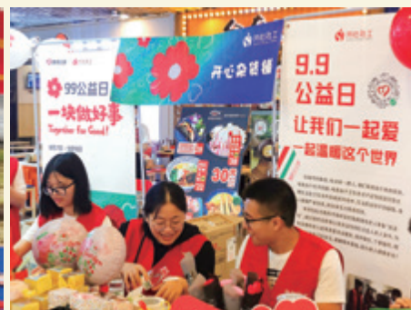
“你看，今天捐款人真多”