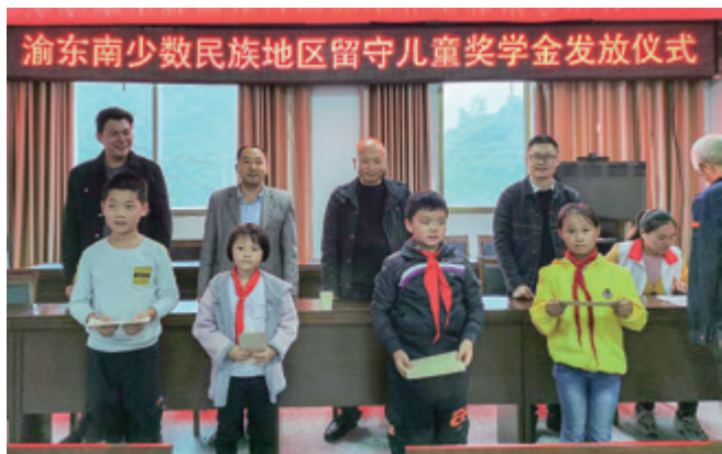
2020 年 9 月 15 日，秀山县隘口镇平所村为 20 名留守儿童发放渝东南少数民族地区留守儿童助学基金 4 万元奖学金。

当地五所学校捐赠 2 万元；向 600 位困难群众捐赠价值 60 万元的购物卡；金科集团捐赠 27.4 万元用于隘口镇精准扶贫，捐赠衣物及书籍，价值约 88 万元；耐德工业集团捐赠秋冬衣服 500 余件，价值约 1.5 万元；普瑞眼科医院为 97 名村民免费筛查眼病；重庆新沁园食品有限公司在 2019 年中秋节之际，捐赠月饼价值 3.6 万元。