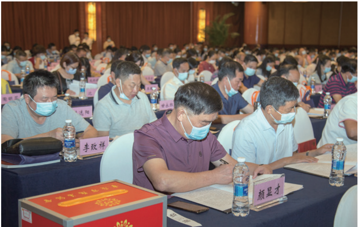
与会者认真听取报告