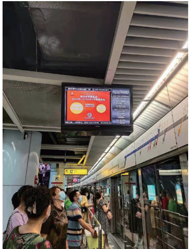
地铁站内屏幕正在播放慈善宣传内容