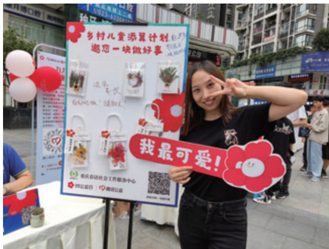
爱心人士打卡 99 公益日线下活动

项目质量高，筹募效果好，市慈善总会深谙其道。2021 年是“十四五”规划的开局之年，助力巩固拓展脱贫攻坚成果、助力推进乡村振兴是慈善事业发展的重要任务。市慈善总会联合区县慈善会、社会组织、慈善专项基金围绕助力乡村振兴、促进共同富裕，精心策划包装了 530 个项目参与今年的“99 公益日”活动。