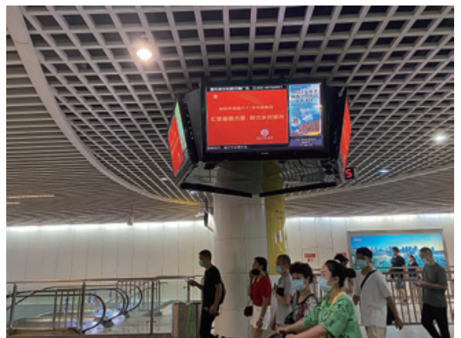
地铁站内宣传广告