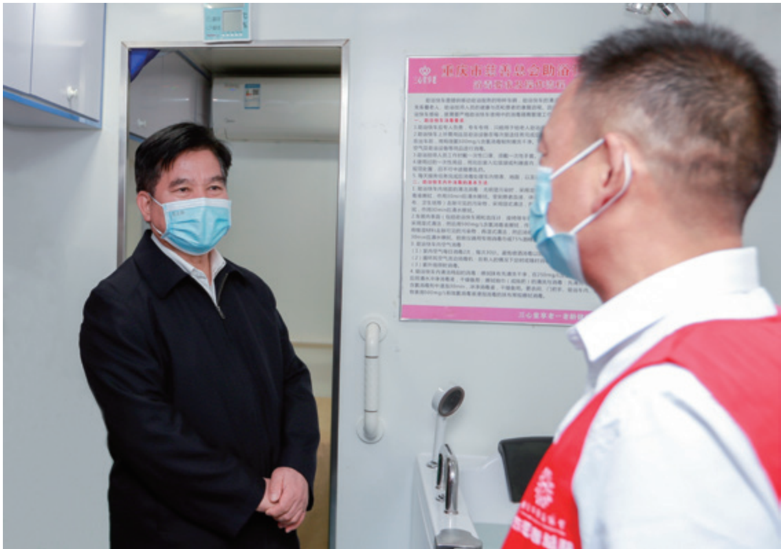
李纪恒（左）走进“助浴快车”跟助浴工作人员交流