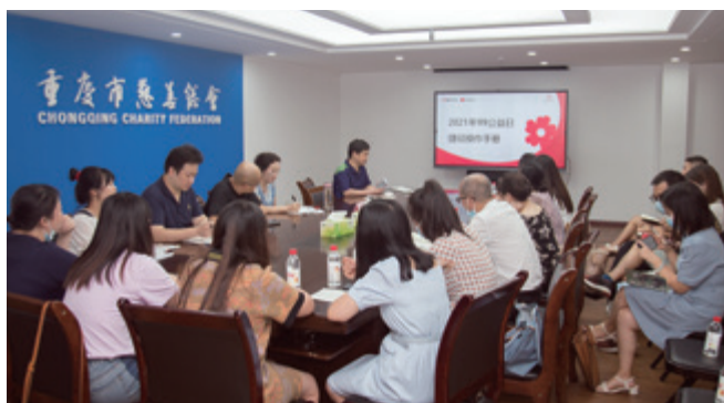
99 公益日规则解读培训

今年“99 公益日”活动时间为 9 月 1 日至 10 日，较往年仅 9 月 7、8、9 日三天大大延长。活动中，市慈善总会联合各区县慈善会在机场、高铁、地铁、公交车站、高速路边、商城、广场、社区、村社及微信朋友圈等发放宣传资料、张贴海报、悬挂横幅、投放宣传视频等 500 余万份（次）。