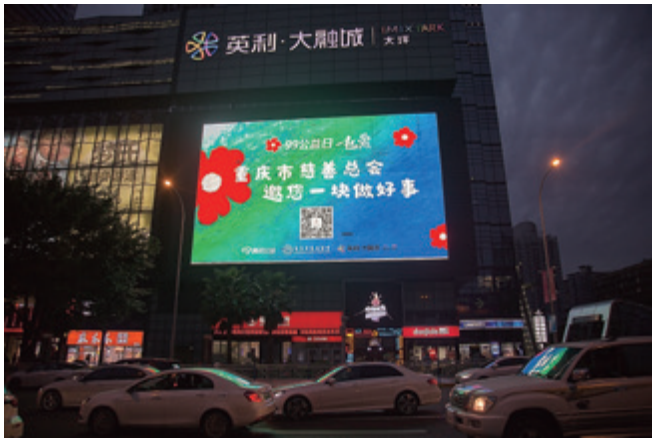
重庆大坪英利大融城 LED 高清广告