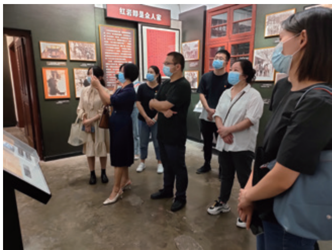
走进纪念馆寻找红色足迹

抗日战争时期，中共中央南方局和八路军驻渝办事处设于红岩村。周恩来、董必武、叶剑英、博古、吴玉章等中国共产党领导人曾在此生活、工作，为中国抗日战争的胜利作出了卓越的贡献。抗日战争胜利