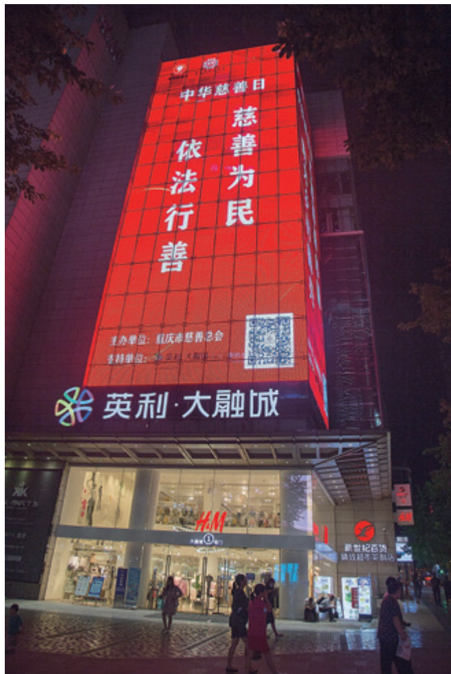
重庆解放碑英利大融城LED高清广告

9月5日至11日在解放碑、大坪大融城外墙LED屏投放宣传广告。市慈善总会还选择了人流量比较大的轨道3号线站台和20个公交站台，投放宣传广告，提升慈善意识，营造慈善氛围。