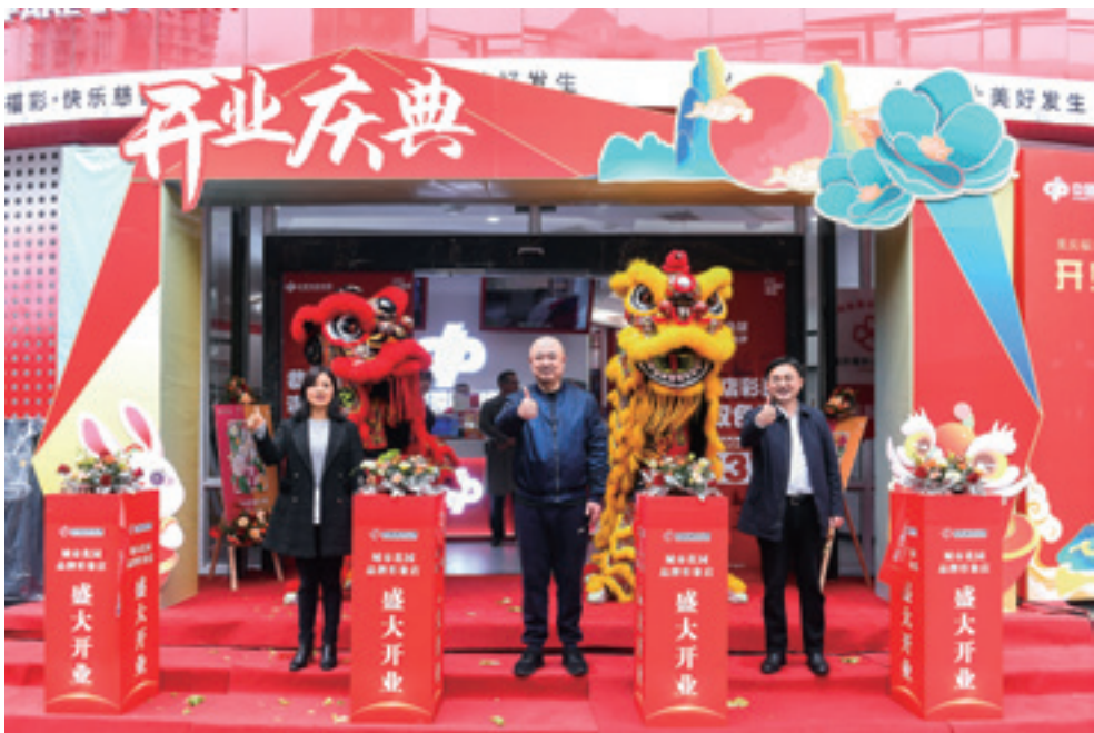
城市花园品牌形象店盛大开业

城市花园品牌形象店的成功开业，再次为福彩渠道注入新活力，推动了销售渠道创新，增强了消费者购买体验。未来，重庆福彩将充分发挥福彩品牌形象店的示范作用，积极探索将福彩文化与渠道建设深度融合，持续向社会传递福彩正能量，为社会福利事业做出更大的贡献。🌸