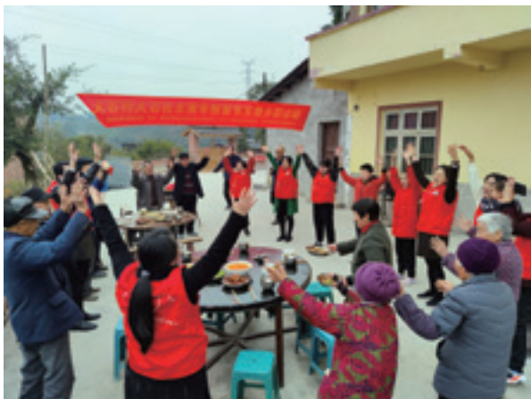
敬老餐开餐前,志愿者与留守老人一起互动

去年以来,“留守老人节气敬老餐”项目在南岸区多个乡村社区成功开展。该项目根据二十四节气,每隔半个月就近选择在一个农户家里,依据