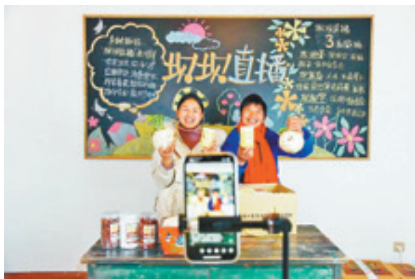
坝坝直播间让乡村特产走出大山，助力农民增收

近日，走进綦江区三角镇中坝村，时刻能感受到这里乡村振兴已按下“快进键”——产业路修通后，村民们纷纷回家修房，就业创业；90 万元慈善资金的注入更是让中坝村的茶园发展蓬勃兴旺，520 户村民实现增收致富；更有村民当起了“主播”，线上销售土特产，将慈善助力乡村振兴的成果传递到各地。