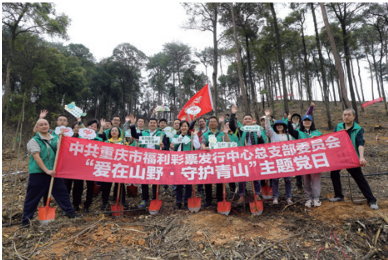
重庆福彩中心“党员先锋岗”代表参与植树公益活动

从山火救援，到助力森林修复，随处可见重庆福彩人的身影。山火来袭时，重庆福彩人挺身而出，奔赴山火一线；为助力扑灭山火，重庆福彩捐赠40万元福彩公益金紧急驰援璧山、北碚山火救