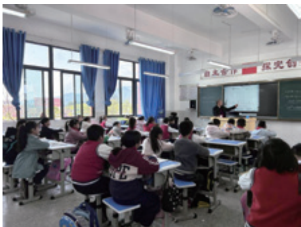
捐赠学生桌椅改善学习条件

垫江县慈善会工作人员表示:“我们经过深入调研,在了解全县学校办学条件现状及教师、学生基本情况后,对部分学校教学设施设备陈旧、老化等问题予以资金支持,助力学校完成办学条件