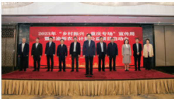
2023 年“乡村振兴·重庆专场”宣传周暨巴渝新农具计划公益项目启动会现场