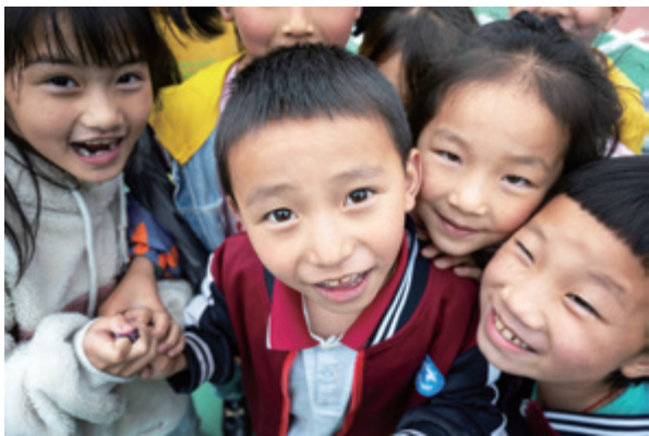
“公益福彩·幸福校园”受助学子

江津区嘉乐学校的孩子们在操场上打篮球,摔倒也不怕疼了;涪陵区白涛街道建峰小学建校50多年,孩子们终于第一次有了足球课;巫溪县古路镇中心小学的孩子们终于可以在操场自由奔跑了……去年夏天,为让福彩公益更阳光透明,让彩民更有公益参与感,重庆福彩创新公益参与形式,推出“一张彩票 一次公益投票权”活动,邀请彩民对“公益福彩·幸福校园”受助学校进行爱心投票,一起圆学子们的美丽校园梦。所获得的资助金根据彩民为各学校投票的数量进行排名决定。如今,在全市爱心人士助力下,重庆福彩已经完成了10所学校的“爱心操场”项目验收工作。