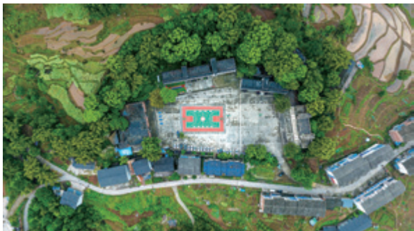
“公益福彩·幸福校园”受助学校