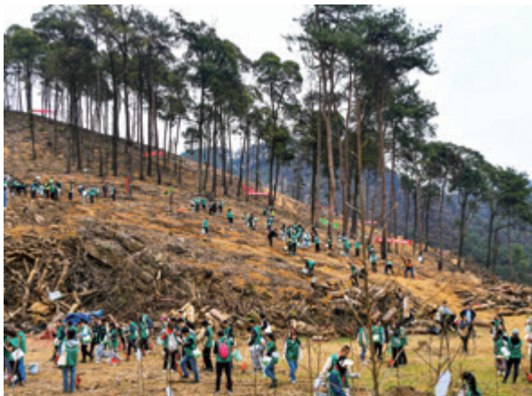
在北碚区缙云山火烧迹地种下“福彩公益林”

山火得到平息后,重庆福彩也站在重建受灾地区的前沿。涪陵、南川、江津、大足、铜梁、开州、万州、巴南、奉节和长寿等十个受灾区县的当地慈善会,获得了福彩累计100万元的慷慨捐赠。如今,受灾地区的森林都在慢慢恢复美丽与生机,长出的一片片新苗也展现出了新生的力量! 🌱