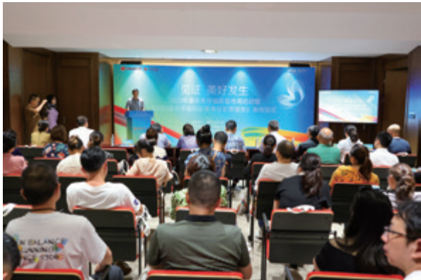
《2022 重庆市福利彩票责任彩票报告》发布现场

举行“见证 美好发生”——2023年重庆责任福彩宣传周启动暨《2022重庆市福利彩票责任彩票报告》(以下简称《报告》)发布仪式,这是重庆福彩第9次面向社会发布社会责任报告。