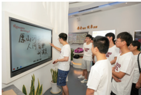
同学们留下美好寄语