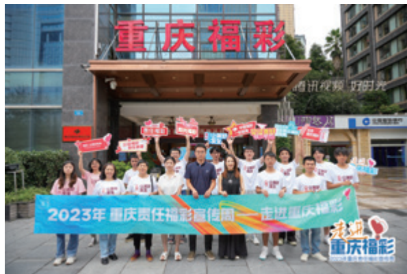
“走进重庆福彩”合影

受邀大学生均为“2小时公益”活动的受助学生，通过参观重庆福彩兑奖大厅、文化展示厅、数