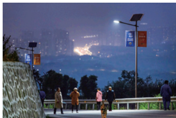
福彩公益路灯便利乡村老人夜间出行

从脱贫攻坚到乡村振兴，重庆福彩对乡村建设的助力始终“在线”。自2021年，重庆福彩启动“点亮乡村”——资助太阳能路灯公益项目为主题的系列公益项目后，截至2022年末，已为全市32个区(县)的66个行政村进行了资助，捐赠太阳能路灯3350盏。