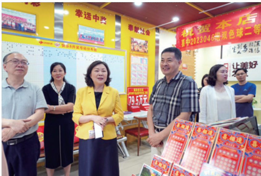
市民政局局长丁中平（左三）、副局长徐松强（左一）及相关处室负责人一行调研福彩投注站销售情况

最 近，市民政局局长丁中平一行到市福彩中心调研指导福彩发行销售工作，并实地走访了部分投注站，召开了调研座谈会。