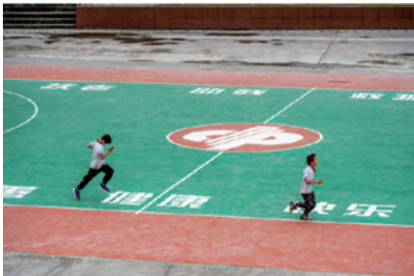
孩子们在福彩“爱心操场”上奔跑

据统计,“公益福彩·幸福校园”项目十多年来,已累计使用700多万元福彩公益金,改善了全市57所学校的办学条件。