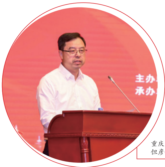
重庆市人民政府副市长 但彦铮讲话