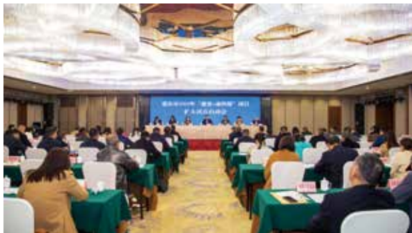
“慈善 + 渝快保”项目扩大试点启动会会场

情暖国际脊髓损伤关注日 重庆福彩捐赠 6 万元救助基金 43 携手传递爱心 共造美好家园 重庆福彩慰问城管一线人员 44 创新大本营主题活动为金秋添彩 45 璧山低收入“两癌”妇女得到中央专项救助金 45 祝福祖国强 共筑福彩梦 46 渝西投注站销售员走进重庆福彩 2022 年彩票公益金 补充全国社会保障基金 402.4 亿元 46 拄着拐杖也要登台高歌 47 福彩快乐 8 “快乐音乐会”为他圆梦