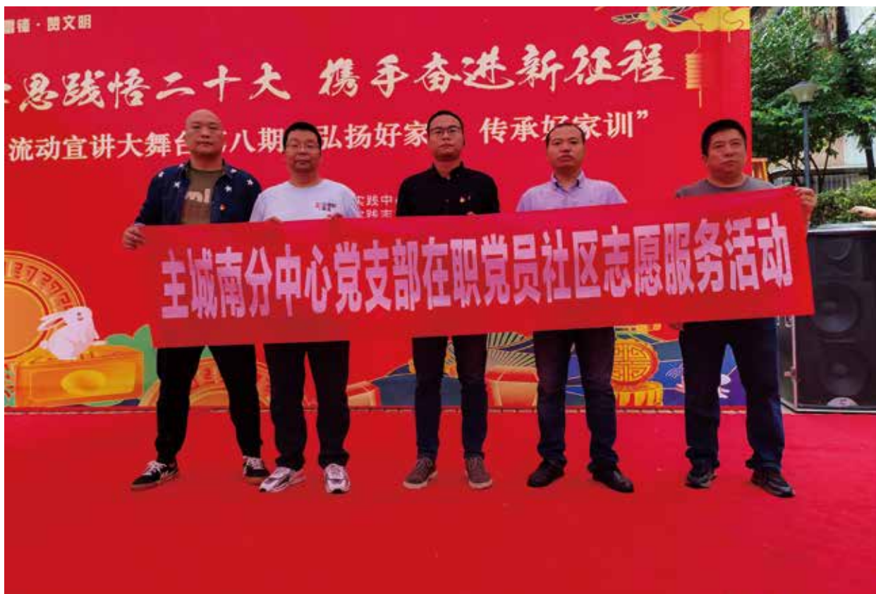
社区宣传活动现场

本次社区党员志愿服务活动，宣传了福彩公益，关爱了社区居民，锻炼了支部社区服务实践能力，培育了服务精神，持续提升了人民群众获得感、幸福感，展现了福彩党员的良好形象和社会责任感。✿