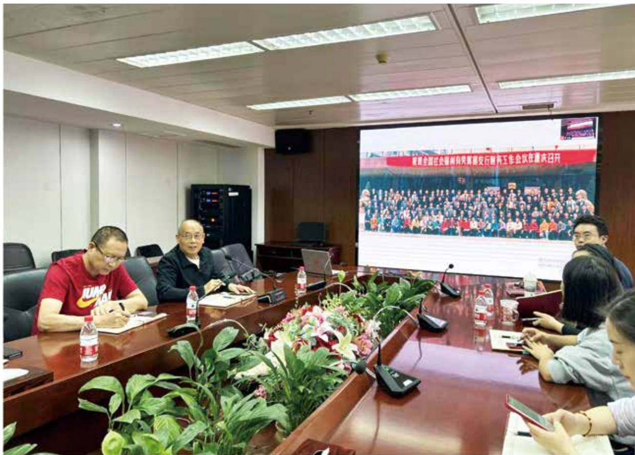
老党员分享福彩故事

活动现场，大家时不时提问交流，回顾难忘经历，曾经的福彩岁月在年轻党员、青年面前亦更加清晰深刻，老党员们过去的创业故事也激励着年轻党员不忘拼搏精神，牢记福彩使命，接力传承福彩事业，促进高质量发展。🌸