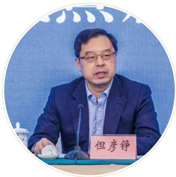
重庆市人民政府副市长但彦铮讲话

市委、市政府高度重视慈善事业发展和商业医疗保险发展工作，将其作为社会保险体系、社会治理体系的一个重要组成部分统筹推进。家军书记、衡华市长都对慈善工作所取得的成绩做了重要的批示指示。作为慈善事业的主管部门，民政局全力推进慈善事业发展；医保局积极参与；保险公司勇担责任。2022年，我市创新推出了“重庆渝快保”，引发了全国各个城市探索创新商品储备、商品保险或者是城市定制性储备保险。经过了几年的探索，把定位城市普惠型商业医疗保险向全市