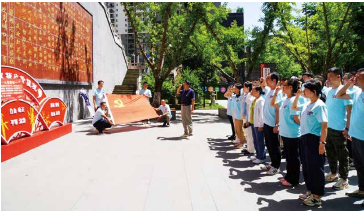
市福彩中心党员干部在红军纪念公园宣誓

为 深入开展学习贯彻习近平新时代中国特色社会主义思想主题教育，提高党员干部思想政治素养，市福彩中心组织党员干部前往城口，开展“不忘初心跟党走·公益福彩我先行”走进红色教育基地主题党日活动。