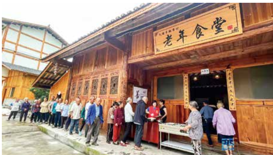
天馆乡魏市村老年食堂开张了

今年以来，市慈善总会全面贯彻落实市委书记袁家军调研酉阳时对“一老一小”工作的指示要求，将在4年内捐助200万元，支持该县全域性、全境式开办“老年食堂”，面向城乡广大“夕阳”群体开展助餐送餐服务，持续拓展和探索“可观、可感、可及”养老服务新模式，为和美和谐新农村建设提供慈善助力新型“解锁方式”。