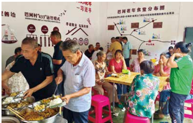
酉阳镇巴网村:老年食堂其乐融融

发挥“老年食堂”助餐聚集性优势,积极开展诗书文娱兴趣活动,建立老少兴趣文娱团队,举办跳摆手舞、唱山歌、象棋、书法比赛等,通过小奖品等形式对其参与兴趣活动予以褒扬,增强其参与意识、协作意识,培育老少情、邻里情,拉近心与心的距离,营造浓郁的家庭式温情,让老人老有所依、老有所乐。(本刊综合)✿