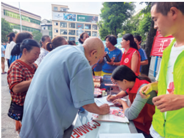
市民参与“重庆慈善周”活动

障。同时,利用互联网技术,项目还开展远程健康知识讲座,邀请专家线上答疑,突破地域限制,将健康知识传递给更多村民。