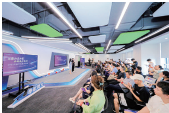
向企业家宣传慈善文化，引导他们关注支持慈善公益

为进一步弘扬慈善文化，市慈善联合总会还倡导发起“巴渝慈善文学”活动，通过举办慈善诗歌朗诵会、编辑出版巴渝慈善文学丛书等形式，动员社会各界人士积极参与创作诗歌、小小说、散文等多类慈善文学作品，培育“人人心怀慈善，人人参与慈善”的良好氛围。