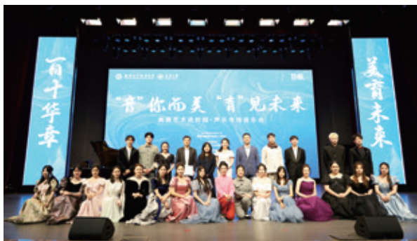
慈善文化艺术走进校园

观峰村是市慈善联合总会于 2023 年命名的首个“慈善文化示范村”。近年来，该村党支部坚持宣传践行以孝德文化为重点的慈善文化，在村里建设了孝德广场、孝德文化长廊、孝德名人榜、孝德文化墙、农耕文化体验馆等，总结推广“每周不忘打电话、教会父母学上网”等“新二十四孝”，