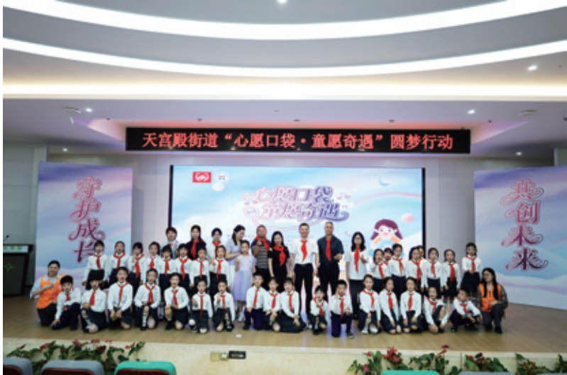
2025年5月29日，两江新区天宫殿街道依托社区阳光基金开展“心愿口袋·童愿奇遇”圆满行动，帮助530名学生事项小小心愿

资金的有效使用比筹集更为关键。邢家桥社区建立了一套完整的项目化运作机制，确保每一分钱都用在刀刃上。社区通过居民议事会、问卷调查、网格员走访等多种方式，精准识别居民最迫切、最现实的需求，在此基础上确定资助优先级。