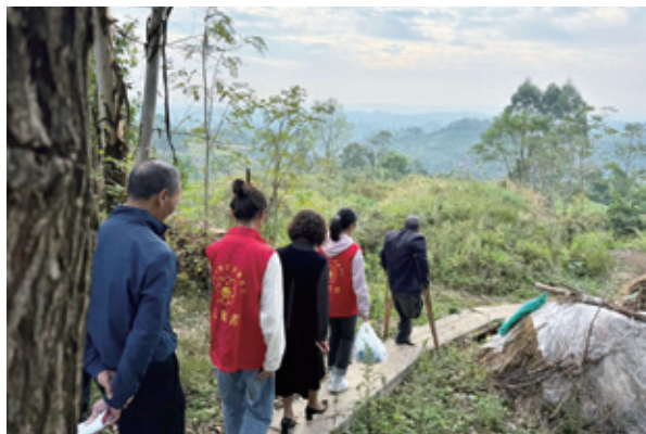
前行在慈善公益的路上

助老、助幼方面,自2018年推出“助浴快车”项目以来,10辆“助浴快车”开进全市29个区县100多个街道、乡镇、社区和养老机构,为7万多位老人送去舒适和温暖;通过线上线下捐赠投入资金超1400万元,帮助6个区县开办老年爱心食堂,为超60万人次老人提供方便、热乎、可口的饭菜;联动巫溪县慈善会推出“云守护独居失能老人”慈善公益项目,为70岁以上独居失能且居住偏远的老人安装远程红外探测仪,目前已完成300多个探测仪安装;携手腾讯公益慈善基金会,发起“善满山城帮扶计划”,搭建数字关爱平台,为困难老人和困境儿童发放关爱券,“一老一小”可以按照需求兑换商品和服务,提升了慈善帮扶的精度和温度,截至2025年8月,该项目已惠及全市520