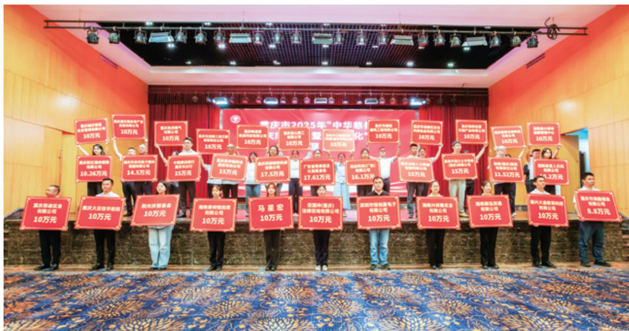
每一次举牌，都凝聚着社会的关爱

“十三五”时期，总会把助力脱贫攻坚作为发展慈善事业头等大事，捐赠款物 27.65 亿元，占同期总支出的 85% 以上，帮扶贫困人口 123 万人次，成为重庆社会力量扶贫主力军。2021 年，总会荣获中共中央、国务院授予的“全国脱贫攻坚先进