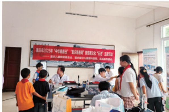
让慈善善意温暖着孩子们

项目借助腾讯公益平台上线，引发广泛关注，吸引大量爱心人士捐款，为项目推进提供资金保