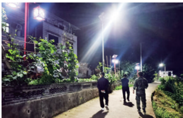
路灯下，村民品味慈善的“味道”