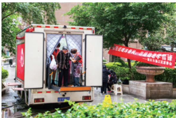
“助浴”让老人在关爱中安享晚年