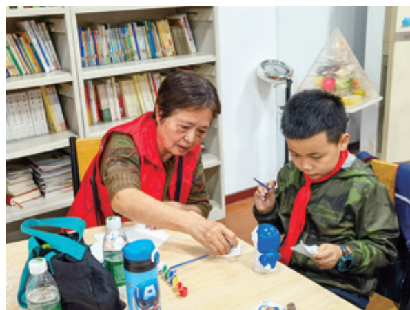
慈善文化“五进”活动滋润着希望和未來

民政部 中央社会工作部 文化和旅游部 全国总工会 共青团中央 全国妇联 全国工商联 2025年8月21日