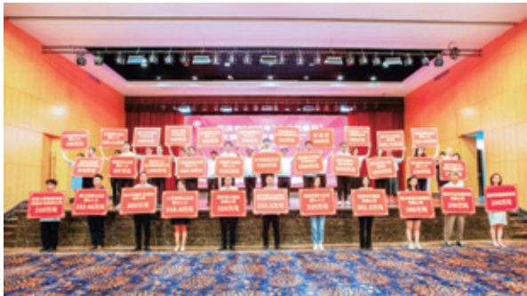
善如潮涌 为爱举牌