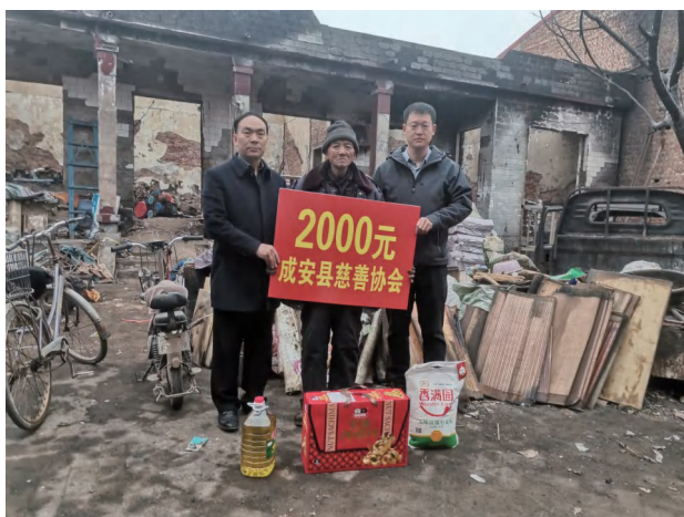
2025 年 1 月 24 日，成安县慈善协会组织看望火灾致贫困难退役军人。