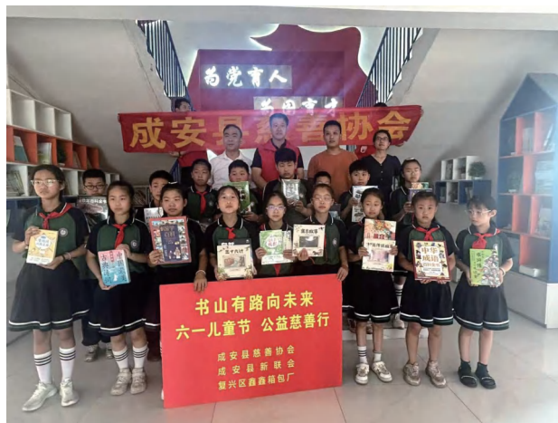
2025 年 6 月 1 日，成安县慈善协会 联合成安县新联会，复兴区鑫鑫箱包厂向长巷中心小学 捐赠图书和书包。