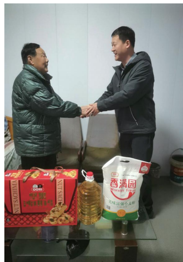
2025 年 1 月 26 号，成安县慈善协会慰问援越老战士。