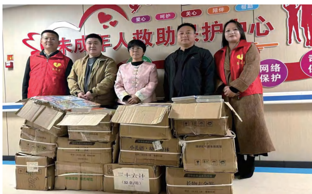
◀ 2025 年 9 月 5 日，成安县慈善协会向成安县未成年人保护中心捐赠图书。