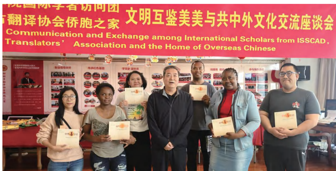
2024年4月，北京大学南南合作与发展学院在邯郸举行“《文明互鉴美美与共》中外文化交流座谈会”，对如何推广《中华善字经》进行交流。

善文化的触角，还延伸到了社区与外省市。邯郸市锦绣善园以《中华善字经》为设计理念，