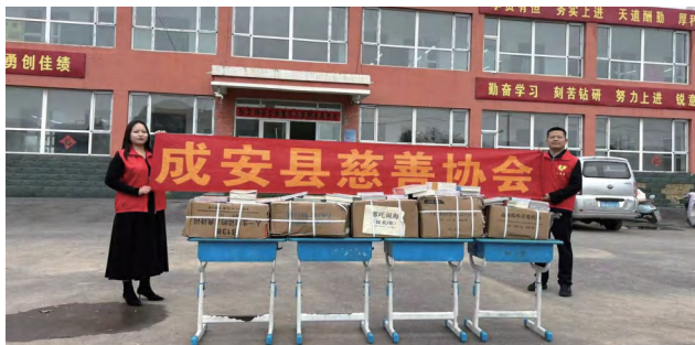
◀ 2025 年 9 月，成安县慈善协会在“中华慈善月”开展慈善进校园活动，向成安县陈边董小学捐赠图书。