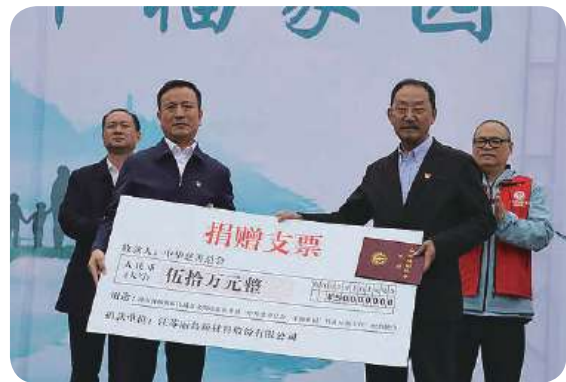
中华慈善总会“幸福家园”村社互助工程启动仪式现场

“幸福家园”村社互助工程是由中华慈善总会报民政部备案，联合全国各省市慈善总会，与民政部依法指定的慈善组织互联网公开募捐信息平台“公益宝”合作，利用合法资质，构建的一个慈善赋能乡村、社区，助力脱贫攻坚，促进乡村振兴，探索基层治理的平台型项目。截至目前，全国首批共有17个省市慈善会与中华慈善总会联合实施这一项目。