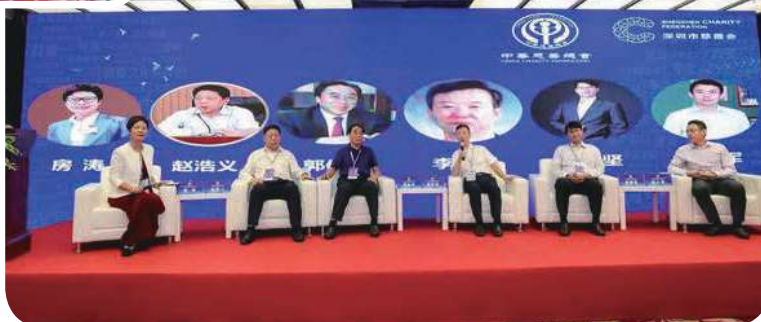
活动现场圆桌对话