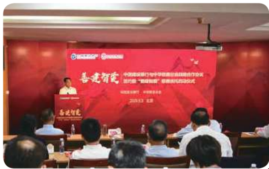
《战略合作协议》签约暨“善建智爱”慈善信托启动仪式现场