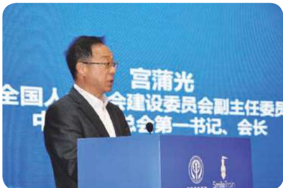
中华慈善总会会长宫蒲光在“微笑列车”项目全国会议上发表讲话