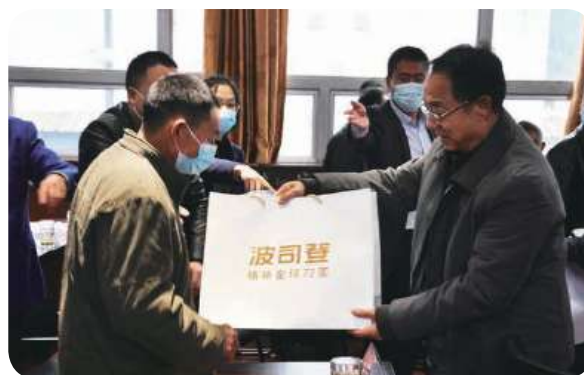
宫蒲光会长向受助群众代表发放慰问品与慰问金