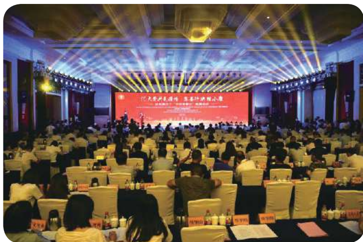
“汇大爱共克疫情、集善行决胜小康——庆祝第五个‘中华慈善日’慈善活动”于郑州盛大举行

9月4日，由中华慈善总会、中共河南省委宣传部、中共河南省委直属机关工委、河南省民政厅、河南省扶贫办、河南省慈善总会、河南广播电视台联合主办的“汇大爱共克疫情、集善行决胜小康——庆祝第五个‘中华慈善日’慈善活动”于郑州盛大举行。全国人大社会建设委员会副主任委员、中华慈善总会党委书记、会长宫蒲光，中华慈善总会党委副书记、秘书长边志伟，中华慈善总会纪委书记兼会长助理胡传木等领导