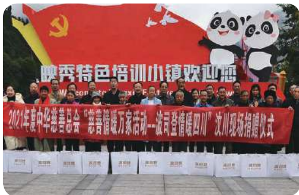
中华慈善总会2021年度“慈善情暖万家活动——波司登情暖四川”启动及捐赠仪式于汶川映秀镇举行