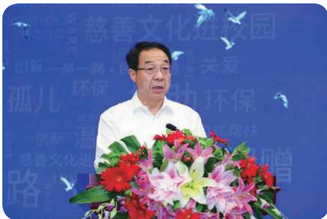
全国人大社会建设委员会副主任委员、中华慈善总会会长宫蒲光发表重要讲话

伟，深圳市人大常委会副主任贺海涛，深圳市政协原主席、市慈善会会长姚新耀，深圳市人大常委会社会建设工委副主任蒋勇，深圳市民政局副局长陈文清出席论坛。