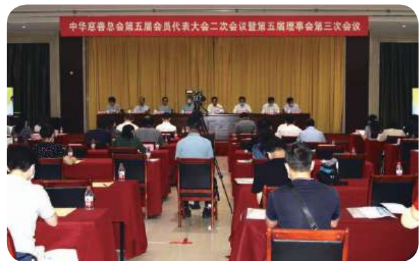
中华慈善总会第五届会员代表大会第二次会议暨第五届理事会第三次会议顺利召开