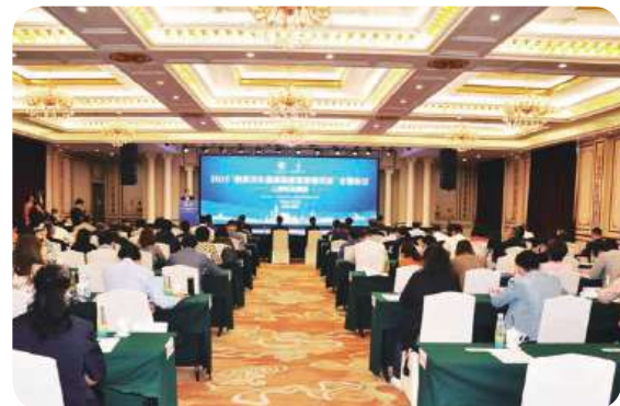
“微笑列车唇腭裂修复慈善项目”全国会议现场

10月22日，由中华慈善总会和美国微笑列车基金会联合主办，珠海市慈善总会承办的“微笑列车唇腭裂修复慈善项目”全国会议在广东省珠海市珠海度假村星光会议中心举行。全国人大社会建设委员会副主任委员、中华慈善总会会长宫蒲光，珠海市委副书记赵建国，珠海市委副书记胡新天，微笑列车基金会(美国)全球高级副总裁及北亚项目总监、北京代表处首席代表薛瑜出席会议。会议主题为“让微笑更美丽”，寄托了微笑列车项目最美好的寓意与祝福。会议由中华慈善总会秘书长边志伟主持。