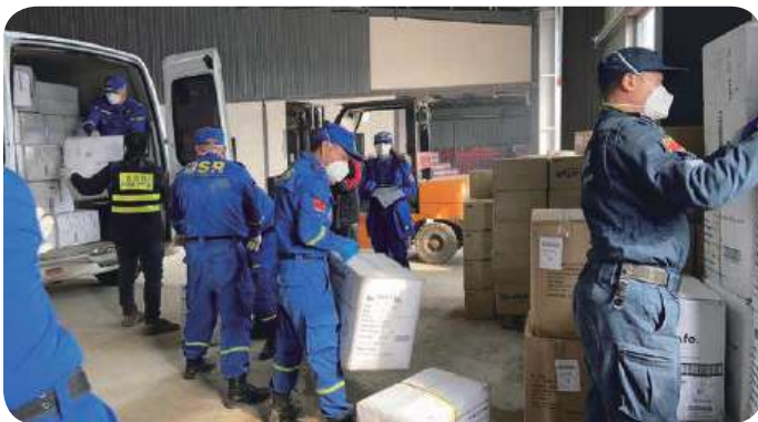
“中华慈善总会·湖北省慈善总会（蒙牛）疫情防控捐赠物资联合应急仓库”正在进行抗击疫情物资转运工作

1月21日，在2019年度工作总结大会上，总会参与疫情防控作了初步动员部署。1月24日第一时间向全社会发出《呼吁书》启动公开募捐，成立了“抗击疫情行动领导小组”和6个专门工作机构，制定具体工作方案。1月29日，总会召开会长办公会，调度募捐工作，强调要依法依规、有序有效开展各项募捐抗疫工作。2月2日，总会向全体员工发出《关于进一步做好新冠肺炎疫情防控工作的指示》，提出具体要求，全力推动各项工作。在抗疫斗争中，总会全体员工紧急动员、放弃休假、坚守岗位、夜以继日、团结奋战，积极开展筹募活动，及时分发善款善物，与此同时，还直接参与了湖北一线的抗疫援助行动。