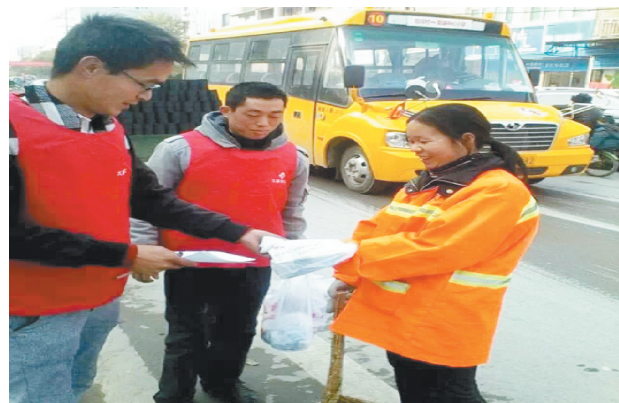
义工们给环卫工人发护手霜。

本报讯(社区记者朱小明 通讯员王鸿举)有这么一群人,盛夏,人们在家中享受空调时,他们在烈日下挥汗如雨;寒冬,人们在家里捂着暖手宝取暖时,他们还在马路上清扫作业,他们就是环卫工人。6日上午,钟祥市义工联的义工们在钟祥发起了“冬暖钟祥——致敬城市美容师”活动,给环卫工人送护手霜,让他们感受温暖。