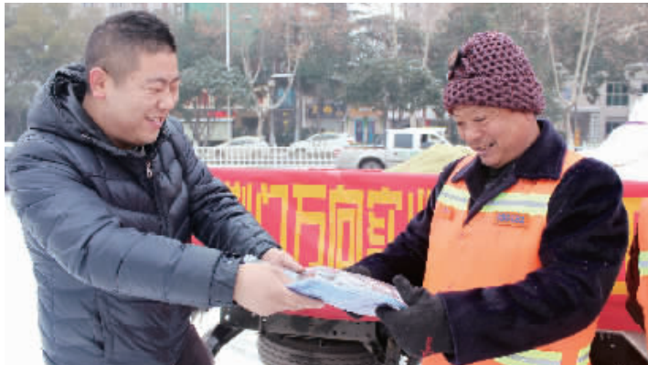
29日,荆门万向实业公司工作人员为奉献在一线的环卫工人送去300余套棉手套、帽子、围巾等御寒物品,并嘱咐他们天冷要注意保暖。