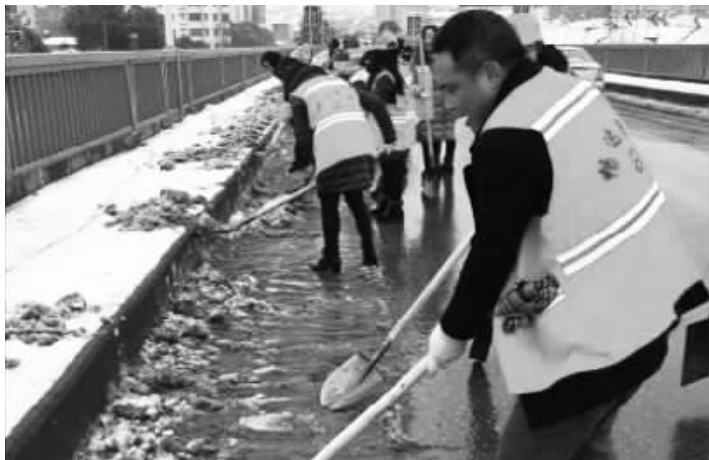
29日,钟祥市畅达养护公司组织20余人铲除和清扫钟祥大桥桥面冰雪,确保桥面的安全畅通。