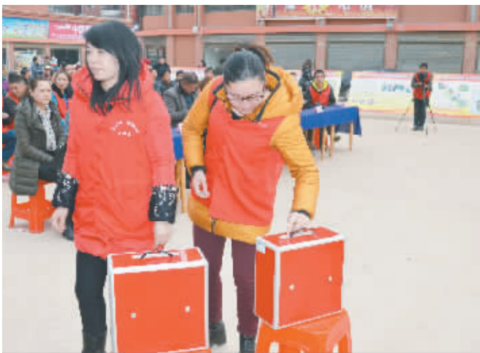
活动现场，义工们踊跃捐款。