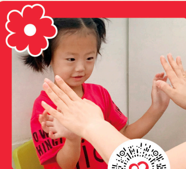
和小红花 一块做好事吧

晋城市慈善总会联合晋城市臻心社会工作服务中心发起的“陪伴事实孤儿成长计划”项目，将通过开展暑期夏令营、陪伴活动、暖心包裹等服务，帮助我市的事实孤儿。