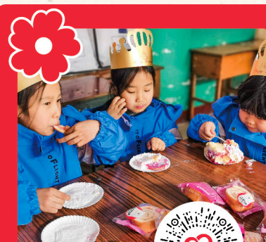
和小红花 一块做好事吧

给予别人爱者，也会收获爱的回馈，感受到爱的真谛。今年以来，晋城市慈善总会联合晋城市臻心社会工作服务中心通过社区走访调研，根据城区范围内 100 对 60 周岁以上老人的需求，决定为老人免费拍摄婚纱照，书写老人的爱情故事。