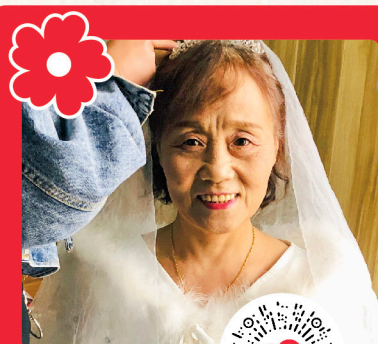
和小红花 一块做好事吧

当今时代，是一个互联网时代，互联网快速、高效、公开和透明的特性，已经体现在社会、工作、生活的各个方面，慈善也不例外。互联网慈善实现了对传统慈善的数字化、网络化创新，拉近了公众参与慈善活动的时空距离，有效提升了慈善资源整合能力和慈善社会动员能力，展现了巨大的发展活力和空间。互联网慈善势在必行，也是未来慈善发展的方向，晋城市慈善总会通过与腾讯公益积极沟通联系，在今年的“99公益日”上线了三个网络募捐项目，其中“康复援梦翌起来”完成募捐目标，其他两个项目仍在进行中。这是我市慈善事业发展的有益探索，我们期待社会各界爱心人士动动手指，积极参与。