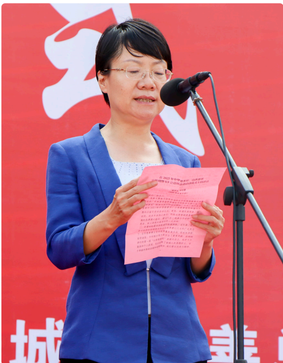
副市长邓志蓉出席活动并讲话