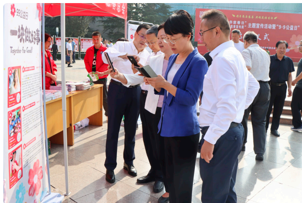
市领导拿出手机带头为三个网络募捐项目扫码捐款

此外，市慈善总会在9月5日所在宣传周，围绕今年“中华慈善日”的宣传主题“携手参与慈善，共创美好生活”，通过太行日报、晋城电视台、太行日报公众号、晋城在线、户外大屏、电梯、公交站点及晋城市慈善总会内部官网、公众号等开展了多形式、立体化的宣传，营造了“人人可慈善 慈善为人人”的浓厚社会氛围，建设“文明城市，尚善晋城”的普遍共识。