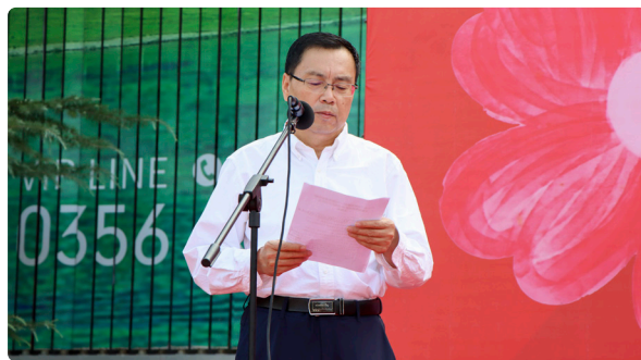
市慈善总会会长尹红岩主持活动仪式