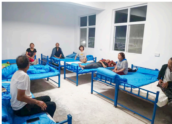
今年汛期，水头村村民在集中安置点心里很踏实。

2022年7月16日凌晨，横河镇遭遇一场强降雨，溪源河水位暴涨，溢出河道。水头村位于溪源河沿线，基础设施、水电路网被严重冲毁。在修复受损设施的同时，村“两委”决定在地势较高的位置新建一处集中安置点，便于在汛情发生时及时转移并安置居住在地势低洼区域的居民。