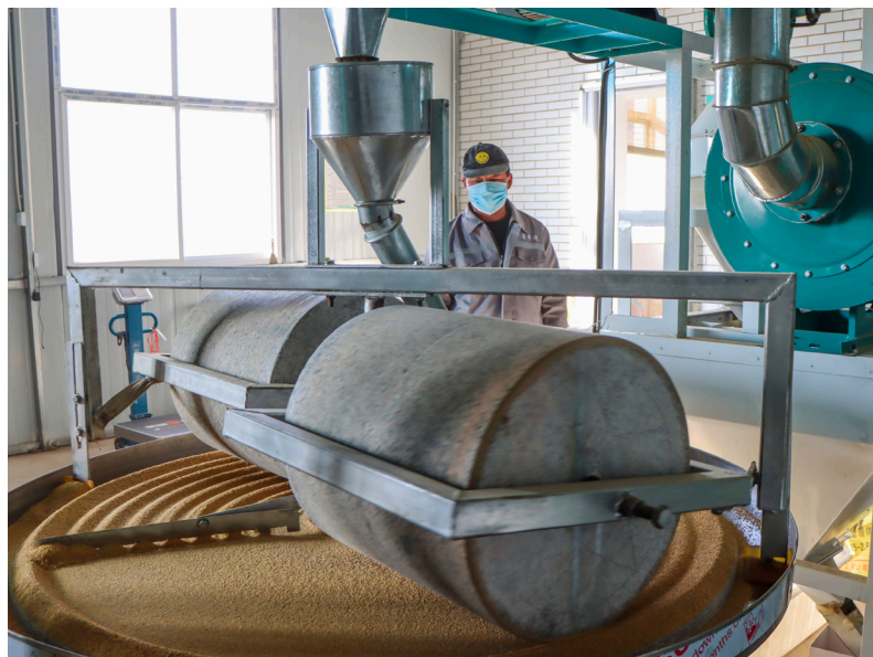
山西鲁丰沅农业有限公司购买的新谷子加工机，正在加工小米。

该公司是鲁村村“两委”领办的农民合作社，主要从事农产品收购、加工、销售等业务。今年以来，在抓党建促基层治理能力提升专项行动中，村“两委”班子经过多次入户走访座谈，了解留守老人的生活现状，决定依托“鲁村小米”品牌影响力，通过“公益宝”平台上线“鲁村小米五统一耕作纾困帮扶项目”，既解决留守老人播种容易收割难的问题，又解决他们行动不便，生产运输困难问题。