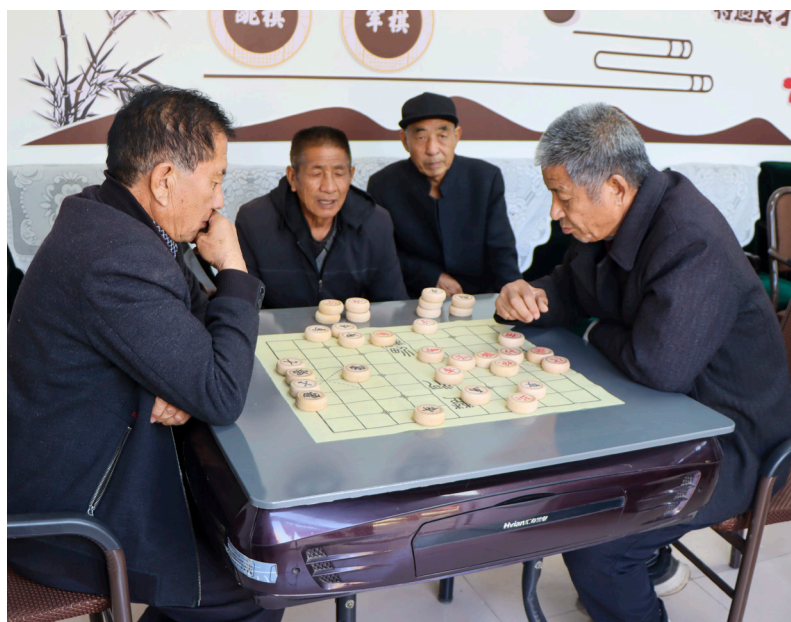
高平市神农镇团东村修复扩建的魁星楼文化活动中心成为村民休闲娱乐的好去处。

魁星楼是一栋建于清代道光年间的建筑，相传每年“冬至”，学堂的先生都要带学生们来这里祭祀。修复魁星楼并在其周边建设文化活动中心意义重大，团东村“两委”摩拳擦掌想把这个项目干好，但该工程预算总投资达63万元，前期本级自筹18万元，还存在45万元的缺口，困难不言而喻。关键时刻，“幸福家园”工程给了团东村“两委”足够的底气。