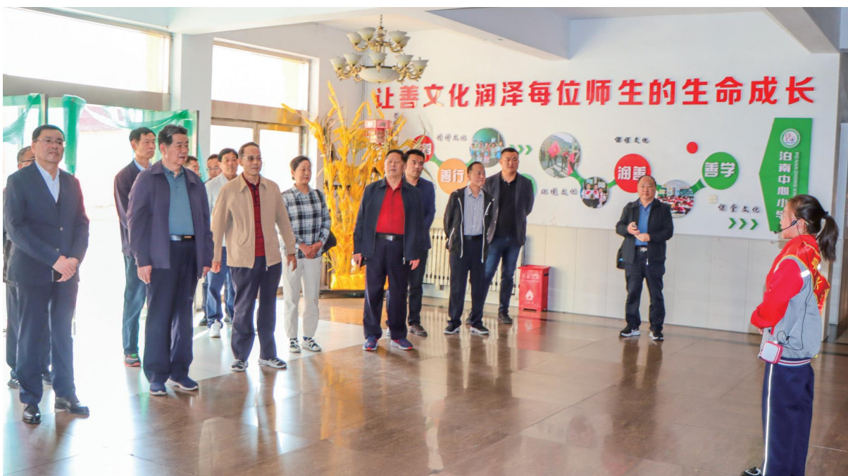
河南省平顶山市慈善总会领导到泊南小学参观考察

“文化墙”和“慈善文化走廊”、劳动实践基地硬件设施、“慈善之家”办公室，建成后将为善文化的传承续航起到积极作用。