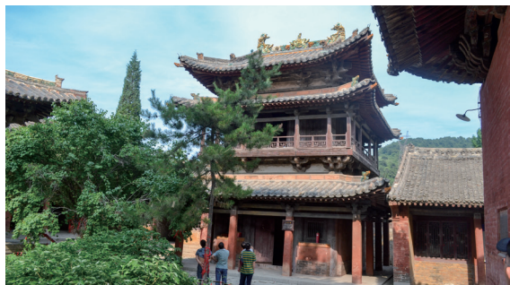
西溪二仙庙内的金代东梳妆楼

阔三间，进深六架椽，五铺作斗拱，琴面式单下昂单檐歇山式屋顶，灰色筒瓦铺制。这座典型的金代大殿建筑屋顶上，饰有琉璃脊兽，琉璃构件做工精细，称得上是我国琉璃艺术精品。