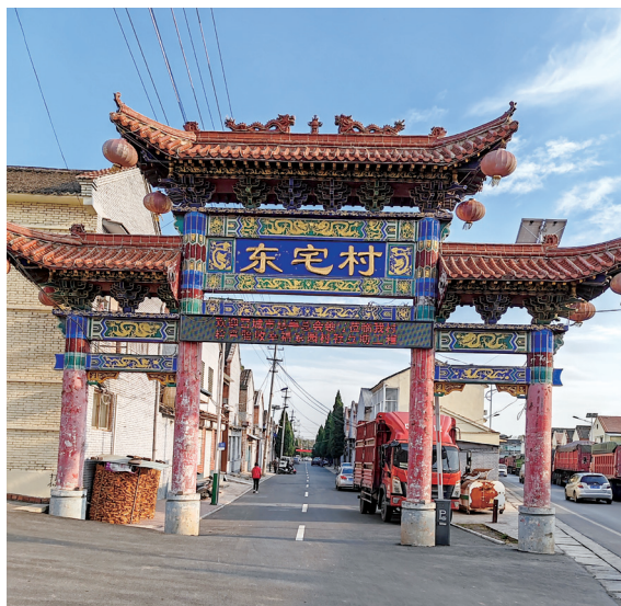
改造后的马村镇东宅村街道