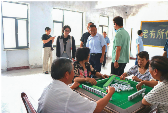
徘徊村的村民在群众文化活动中娱乐

的路上。经过不懈的努力，高平市慈善总会先后配捐近百万元，支持村（社）两委完成了神农镇团东村魁星楼活动中心、东沙院群众文化活动中心、邱村（石沙村）户户通道路提升工程、东城办凤和村群众文化康养中心、北城办王降村红色文化遗产继承（王降小铺）、三甲镇徘徊村群众文化活动中心、底池村乡村记忆室修缮、许家村老年幸福家园建设、寺庄镇柏枝庄文物保护修缮、马村镇东宅村街道修复提升等12个项目，经晋城市慈善总会检查验收全部合格并挂牌。