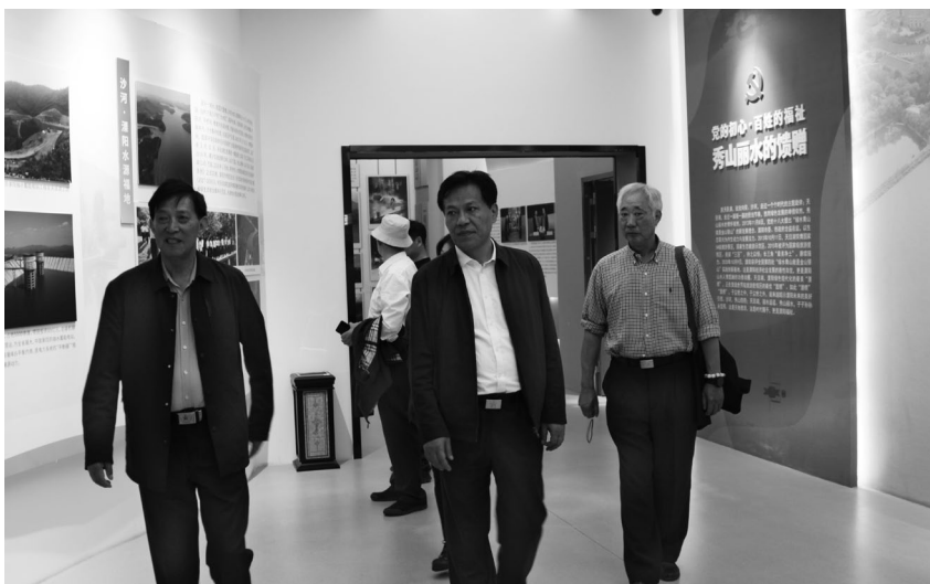
调研组在江苏省溧阳市沙河精神展览馆了解“沙河精神”

塘马战斗精神涌入了塘马人的血脉，促使着“敢闯敢干、勇于创新”的塘马人不断奋进。2017 年，在别桥镇党委政府的主导下，塘马村以红色文化凝聚乡村奋进力量，以党建引领乡村治理，以特色产业撬动乡村产业兴旺，从昔日的革命老区小村蝶变成“精神焕发的新农村”，实现了“干部能带头，群众有劲头，村庄有看头，种田有奔头”的目标。2017 年到 2022 年，塘马村的乡村旅游收入从 0 增长到 200 余万元，人均收入从 1.5 万元增长到 3.5 余万元。同时，吸引村民返乡创业就业百余人，承接乡村建设培训千余次，农业规模化经营比重