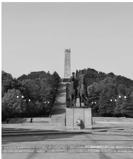
位于江苏省句容市茅山镇的苏南抗战胜利纪念碑

2022年10月，句容“铁军东进战地 茅山红色传承”红色旅游融合发展项目成功入选江苏省第一批红色旅游融合发展示范项