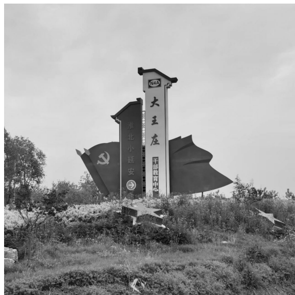
“淮北小延安”——大王庄

开阔的广场上，新四军四师暨淮北抗日民主根据地将士名录墙整齐排列，核准一位、增刻一个名字——这是峥嵘岁月酬壮志、万里江山铺锦绣的名录墙。正中间的墙上篆刻着一行大字：“新四军是老百姓的武装，是武装起来的老百姓，要真心诚意地听老百姓的呼唤，受老百姓指使，为老百姓流血！”