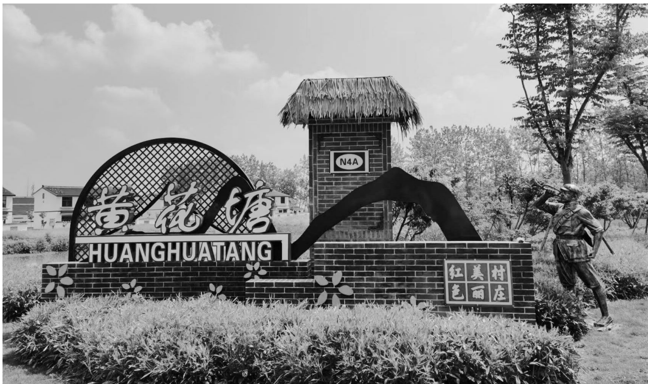
昔日战地黄花塘，今日黄花分外香