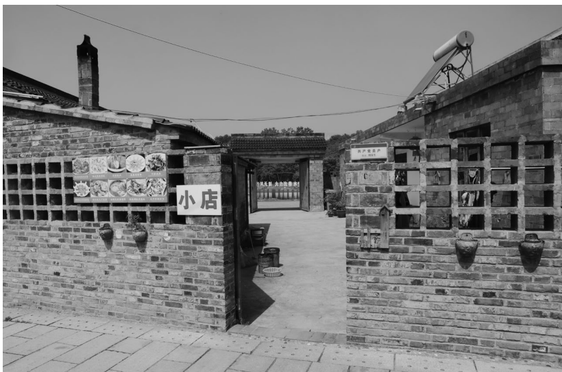
红色旅游及“红餐”的开发，让江苏省句容市茅山风景区管委会李塔村下属的陈庄自然村从“红村”成为“网红村”