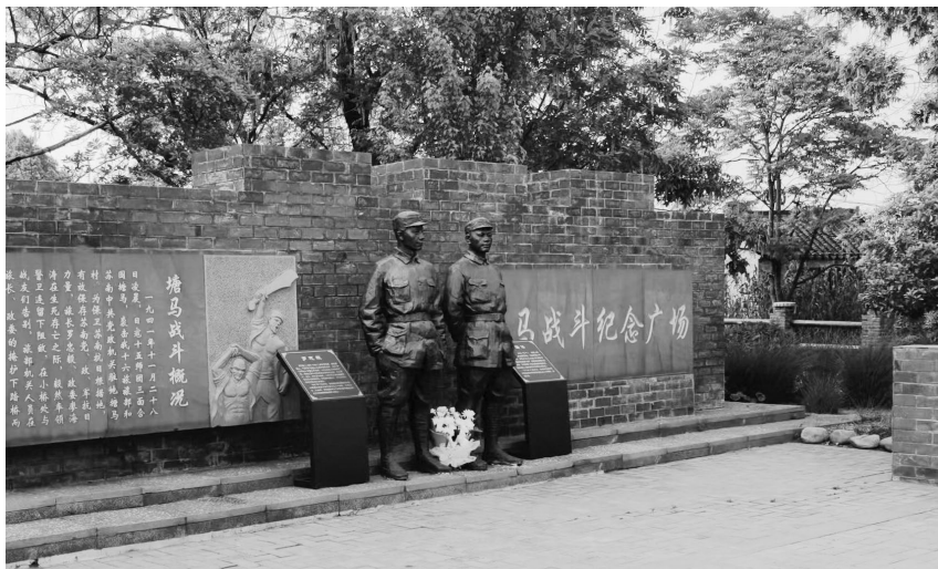
忠毅赴国难，海涛镇苏南。今日塘马暖，不忘别桥寒。图为位于江苏省溧阳市别桥镇塘马村的塘马战斗纪念馆

塘马战斗精神也铸就了溧阳人的精神特质。在溧阳经开区管委会的大厅上，有这样一行字：笃定“能为必可成”，冲破“县级市思维”。在溧阳，我们听的最多的故事就是“要干就干大的”。1957 年，为改变当地“水流不存”的现状，十几万溧阳人，在没有大型机械工具的帮助下，用手和肩膀筑起了沙河、大溪两座水库。夜色中，景詹沙河大桥将 1 号公路的三色映照得更加温馨，沙河水库两岸的“喜看湖山千重浪 敢叫沙河换新天”壁画高耸入云，诉说着波澜壮阔的建设历史。1992 年，这两座水库又有了一个闻名全国的名字——天目湖风景区。依托“天目湖”品牌效应，溧阳冠以“天目湖”品牌的农副和旅游产品有 100 余只，天目湖砂锅鱼头和天目湖白茶成为其中