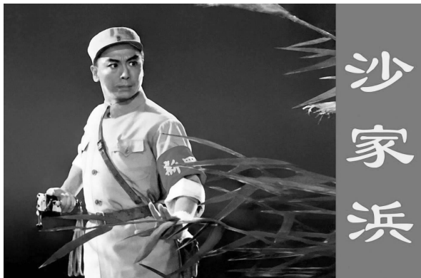
现代京剧《沙家浜》剧照

20世纪60—70年代，沪剧《芦荡火种》在上海公演，曾经风靡一时，人们便知道苏南有个“沙家浜”，沙家浜出了个阿庆嫂与沙奶奶；后来，中国京剧院根据沪剧《芦荡火种》改变为京剧《沙家浜》，成为八个样板戏之一，观众更广，名声更响，沙家浜这一“地名”更成为众所关注。