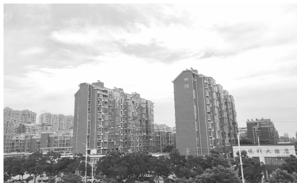
阜宁县金沙湖街道桃园村新貌

安置了村里的富余劳动力,解决了困难群众就业问题,收到了较好的社会效益和经济效益。沙滩浴场每年都需要清污,这是一项技术活,没人干过,大家认为,过去能吸水下的沙子,为什么不能吸淤泥呢?村里就找吸过沙子师傅们商讨,鼓励他们大胆尝试。在村干部和工人们的共同努力下,终于完成了浴场清污。仅此一项,每年村集体能增加3万多元。村里还成立了一支维修队伍,专门承接景区的维修业务,维修栈道、景观车棚、窨井等景区设施。为防止风沙飞扬,污染环境,服务队及时在景区喷水,环保部门设置在金沙湖的空气监测点指标,始终在规定的范围之内。桃园村实际上成了景区的美容师。