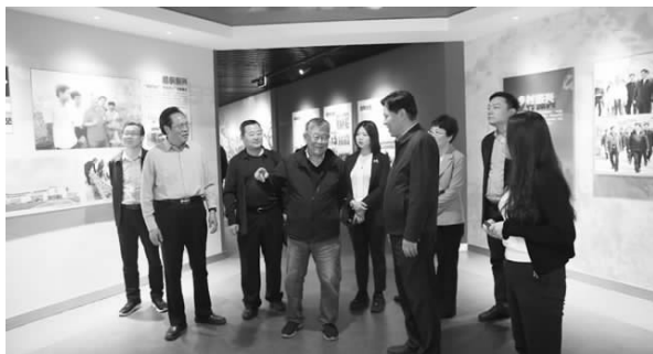
句容现代农业展示馆（原赵亚夫事迹馆）

初见赵亚夫，难掩激动。在句容现代农业展示馆（原赵亚夫事迹馆）外迎候我们的赵亚夫，比照片上看起来更加慈祥可亲，他一句“二十多年前就是你们《中国老区建设》杂志最早把我推向了全国”一下把距离拉得更近了。