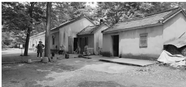
金坛阳山兵工厂旧址

勤装备的变化,于是,一方面加强了对茅山地区的封锁,另一方面四处寻找新四军后勤生产地。1941年6月中旬,日寇对茅山根据地扫荡。得到消息,阳山村军民迅速做好兵工厂与被服厂设备、物资的转移隐蔽和人员撤离工作。得知后勤基地被困,驻阳山村及周围的新四军和茅东县委迅速调整力量,趁夜幕即将降临,及时对日寇进行猛烈打击,敌人不敢恋战,仓皇逃离。由于兵工厂、被服厂地址暴露,1941年秋天以后,阳山兵工厂分批转移到建昌圩潘家墩和溧阳水西村。被服厂则继续隐蔽生产。他在新四军被服厂工作时使用的布尺和剪刀,目前收藏在茅山新四军纪念馆,纪念馆内同时还收藏着阳山兵工厂生产的小钢炮图片资料,作为茅山抗日根据地军民抗战的物证,向后人展示和讲述着那段烽火岁月里的新四军阳山兵工厂、被服厂的光荣历史。