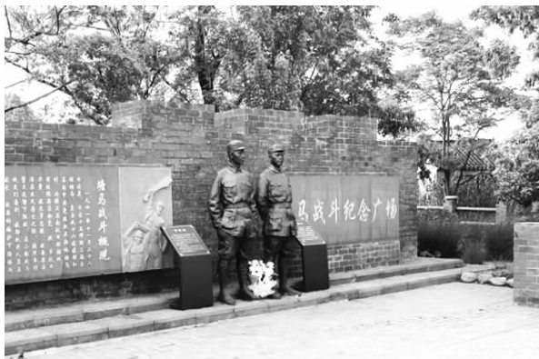
溧阳市别桥镇塘马村的塘马战斗纪念广场

促使着“敢闯敢干、勇于创新”的塘马人不断奋进。2017年,在别桥镇党委政府的主导下,塘马村以红色文化凝聚乡村奋进力量,以党建引领乡村治理,以特色产业撬动乡村产业兴旺,从昔日的革命老区小村蝶变成“精神焕发的新农村”,实现了“干部能带头,群众有劲头,村庄有看头,种田有奔头”的目标。2017年到2022年,塘马村的乡村旅游收入从0增长到200余万元,人均收入从1.5万元增长到3.5余万元。同时,吸引村民返乡创业就业百余人,承接乡村建设培训千余次,农业规模化经营比重达90%以上,2022年村集体经济收入达291.5万元。