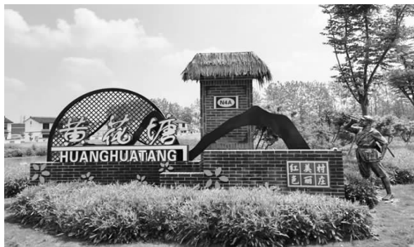
昔日战地黄花塘，今日黄花分外香

句歇后语，“张军长插秧——路路成行”。卞龙介绍，歇后语中的“张军长”是新四军副军长、二师师长张云逸。当时黄花塘群众没有种水稻的习惯，新四军把水稻种植技术带到当地。移驻之初正值春荒，部队供给难以保障。军部响应中共中央号召，积极开展大生产运动，成立了直属队生产委员会。当时已经50岁的张云逸与老百姓一起开荒种粮，还带头拾粪积肥，天不亮就外出，寒冬腊月也从未间断。他还养鸡，鸡蛋自己舍不得吃，送给伤病员改善伙食。经过大生产运动，军部机关很大程度上解决了自给问题。二师兵工厂生产的子弹、手榴弹等军用物资，除了自给，还能提供给其他部队。