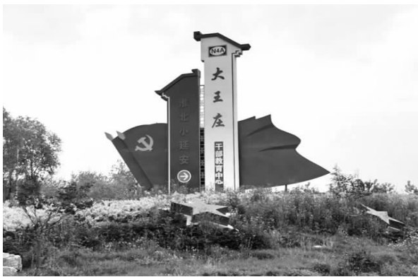
“淮北小延安”——大王庄

1942年12月,我淮北军民取得33天反“扫荡”斗争的胜利后,新四军第四师司令部、淮北区党委和淮北苏皖边区行政公署从半城和张塘村移驻大王庄,实行党政军一元化领导,淮北区党委重新改组,邓子恢为书记;同时取消淮北军政党委员会,全边区党政军民工作统一于区党委的领导。彭雪枫兼淮北军区司令员,邓子恢兼政委,张震兼参谋长,吴芝圃兼政治部主任。大王庄成为淮北抗日根据地的首脑指挥中心,直至抗战胜利。大王庄被喻为“淮北小延安”。