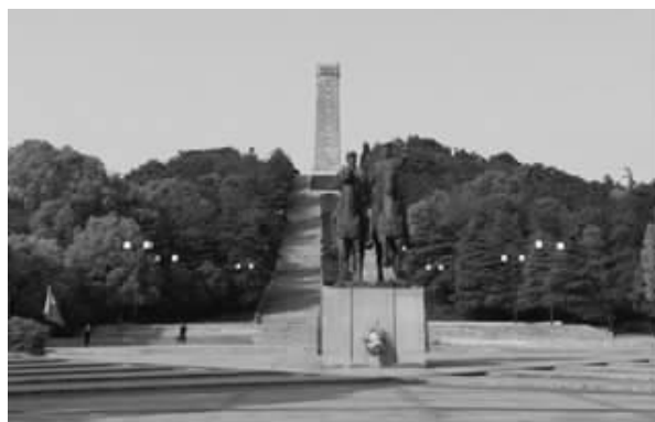
句容市茅山镇的苏南抗战胜利纪念碑

长眠于茅山的小号手,没有人知道他的名字,没有人知道他的家在何方,但他是茅山人民的儿子,他是新四军的代表。这就是“铁军精神”。