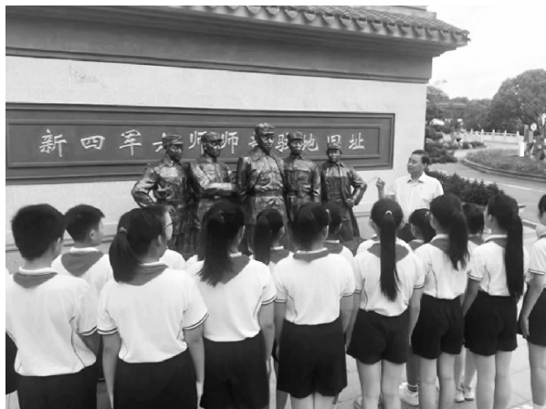
离退休老干部向青少年学生讲述革命故事

的物件，无声地诉说着那段硝烟弥漫的岁月，让人仿佛穿越时光，重回那段充满血与火的战斗岁月。展馆内分设“抗战燃烽火 忠魂铸铁军”“日寇犯长泾 泾水腾怒涛”“铁军驻长泾 抗日奏凯歌”和“英烈传千秋 精神颂万代”四个主题展厅，全面还原了抗日战争时期长泾地区的抗日斗争历程。