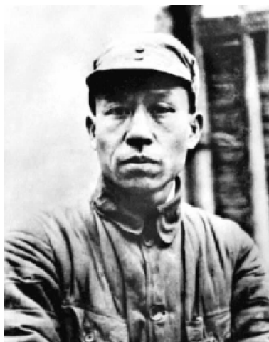
中原局书记刘少奇

1940年3月,国民党江苏省政府主席兼鲁苏战区副总司令韩德勤,乘新四军第5支队主力西援津浦铁路以西之机,调集第117师、独立第6旅及地方保安旅、团等共1万余人,向安徽省来安县半塔集地区进攻。第5支队留在半塔集地区仅有后方机关、特务营、教导大队等共2000余人。由于兵力悬殊,路东局势危急。中共中央中原局和新四军江北指挥部即令第5支队后方机关和留守部队固守待援,同时急调其他部队赶赴路东增援。3月21日起,坚守半塔集的部队在江北指挥部政治部主任邓子恢、第5支队政治委员郭述申等指挥下,与当地群众、自卫队紧密配合,击退国民党顽