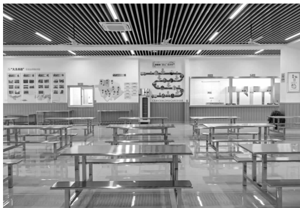
武进区岑村老年助餐食堂

深入开展“细心、热心、真心、贴心”保姆式服务。针对老年群体饮食习惯，参照老年群众保健要求，推出的菜肴以清淡的家常菜为主，让老同志感觉“家”的味道。同时，坚持做到：每周有安排，每天不同样。下一步，还将适时推出健康套餐、生日套餐。热心送餐上门。为了方便老年人就餐，妥善解决农村老年人居住分散问题，村委会将全村 26 个村民小组划分为 9 个助餐网格，招募一批志愿者，确保 10 分钟之内送到各个村民小组，30 分钟之内分发到每家每户。目前，老年助餐中心每天配送 300 份以上。真心听取意见。村委会明确专人负责，不定期听取村民小组组长、用年群众代表、相关人员家属、送餐志愿者的意见，及时进行研究，及时组织整改。贴心给予照顾。对于孤寡老人、行动不便老人，助餐中心考虑到这部分群众的特殊情况，适量增加饭菜份量，以满足中、晚两餐用膳之需。下一步，村“两委”计划将老年助餐服务与养老健康保健结合起来，为全村老年群体提供更多帮助。